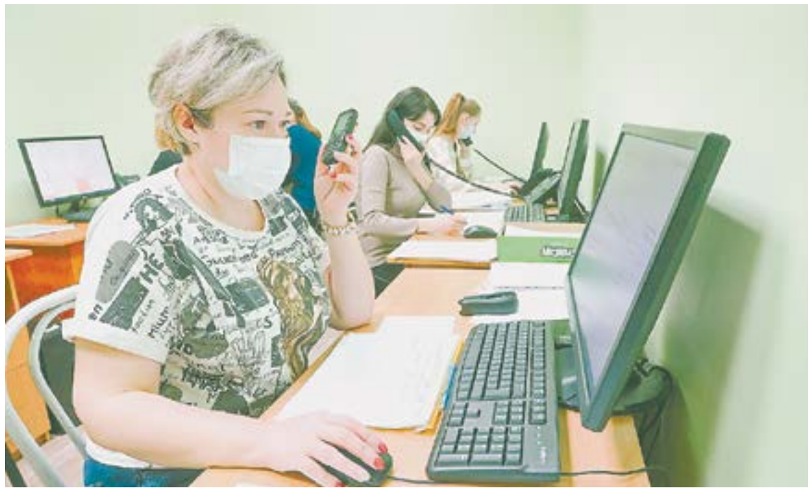
Трубки кол-центра 14-й поликлиники не замолкают ни на минуту.