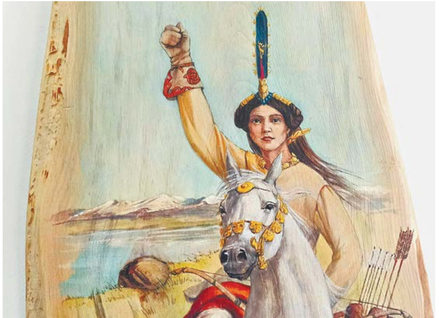
Принцесса Укока – навстречу жизни.

Так получилось, что в течение жизни у меня была возможность научиться как-им-то вещам, навыки мне по наследству передавались от родственников. В целом реставратор – это человек, который может в самых разных областях работать. С тка-