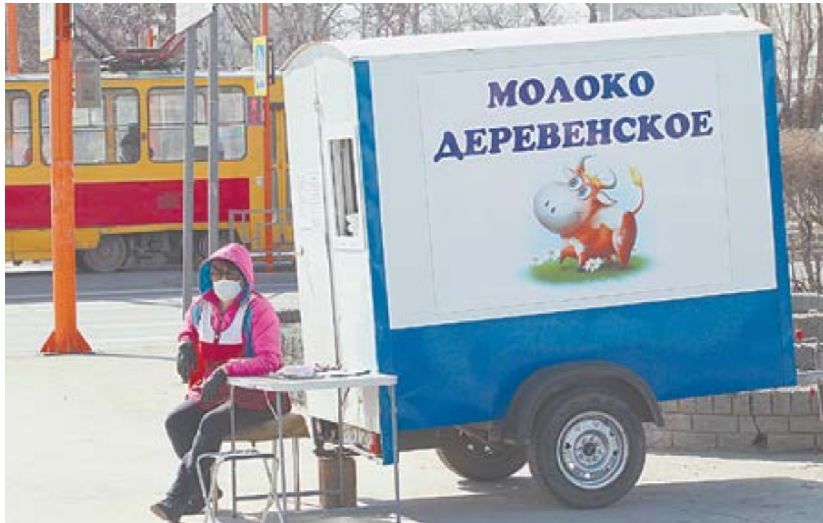
За прошлый год молоко в магазинах Алтайского края подорожало в среднем на 22,3%, поэтому число покупателей сокращается.

По данным компании PepsiCo (владеет Рубцовским молочным