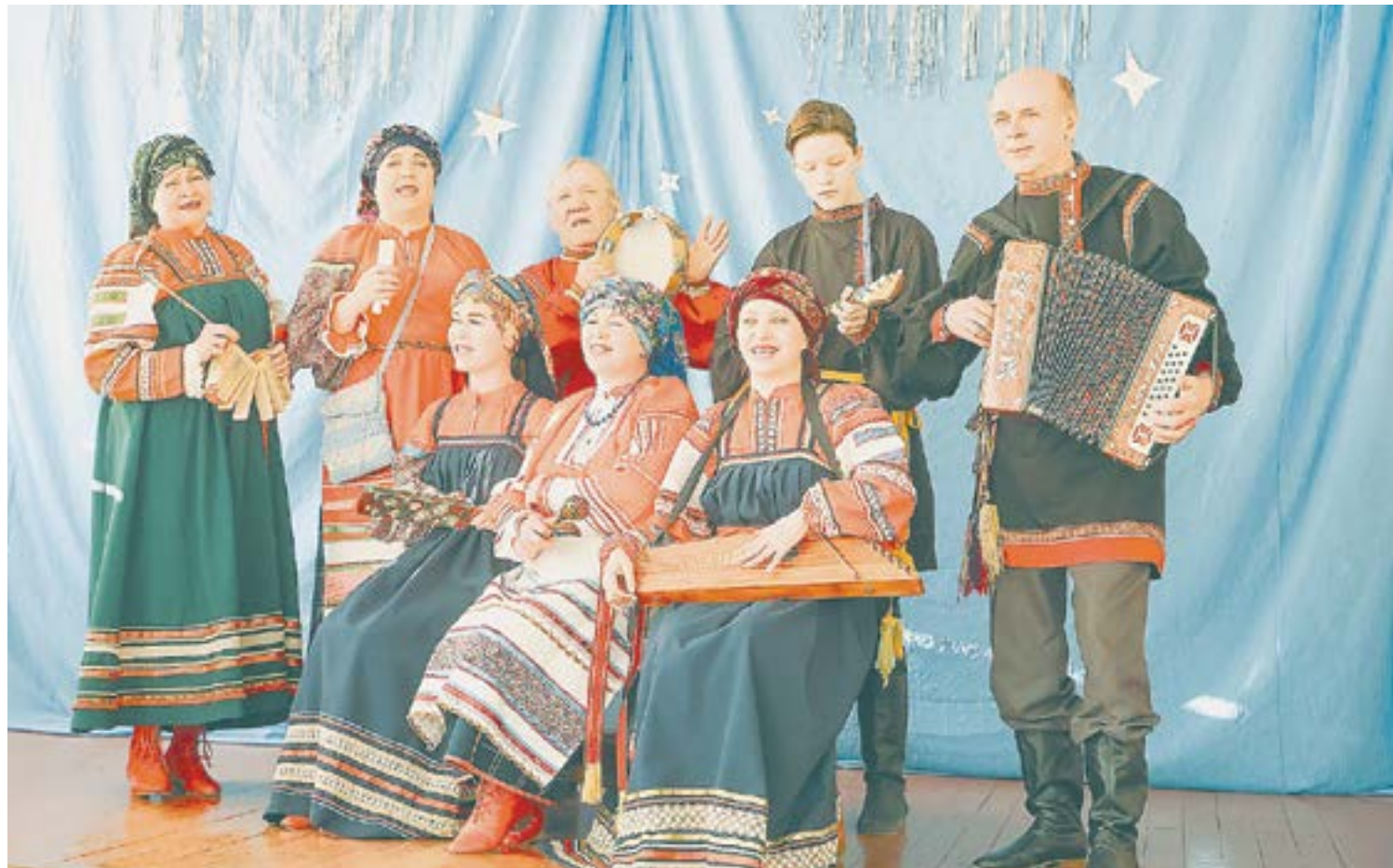
Старые песни о главном.