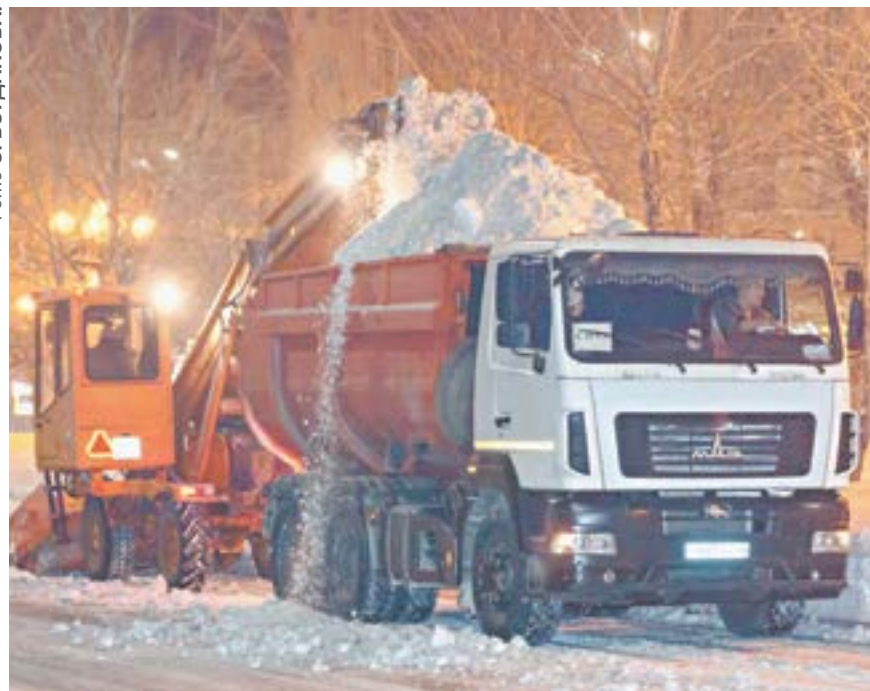
От поста в соцсети до решения вопроса иногда проходит несколько часов.