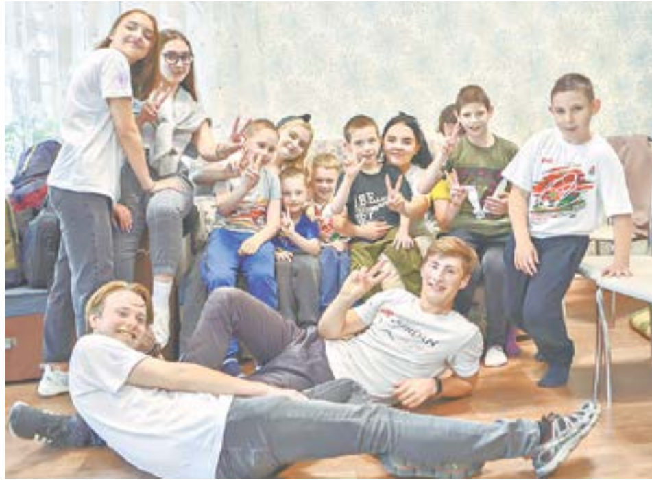
Приезд студентов – большая радость для детей.