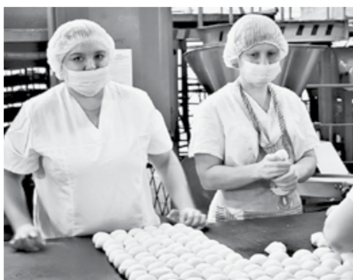
Бригада заготавливает тесто на расстегаи.

В отделе сбыта телефоны не умолкают. Заявки поступают отовсюду: из Михайловского, Волчихинского, Угловского, Егорьевского, Поспелихинского, Новичихинского, Курьинского, Змеиногорского, Третьяковского, Локтевского районов. Само собой разумеется, из торговых точек Рубцовска. В городе практически не осталось магазинов формата «у дома», где бы не торговали хлебом и другими изделиями