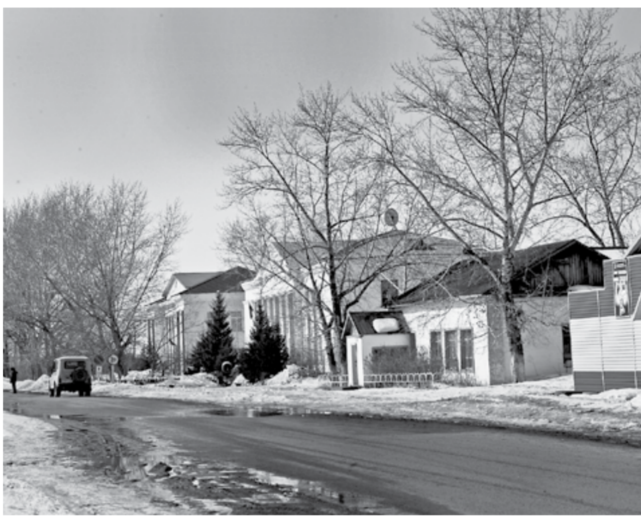
Собственные доходы поселений в Суетском районе минимальны.

Одна из главных причин объединения в муниципальный округ, по словам главы района, заключается в ничтожности бюджетов сельских поселений. На содержание дорог, водоснабжения, освещения нужны деньги, а их в селах нет. Собственные доходы поселений в Суетском