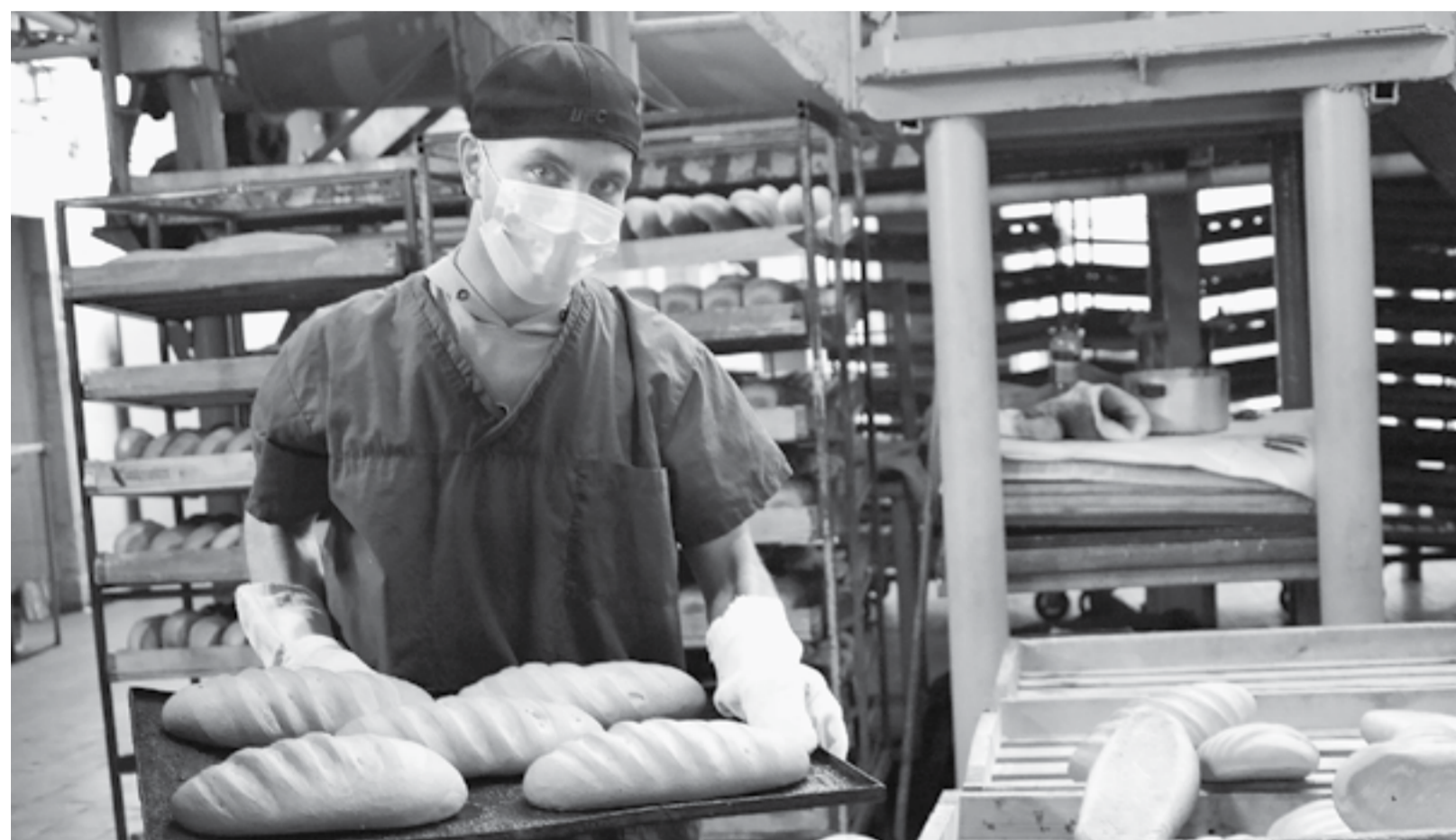
Батоны пользуются неизменным спросом.