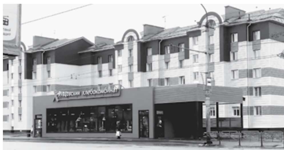
Фирменные магазины комбината расположены в удобных для покупателей местах.

Пять новых фирменных магазинов, расширение ассортимента продукции, пополнение автопарка – Рубцовский хлебокомбинат уверенно вернул себе место под солнцем. О нависшей два с лишним года назад угрозе закрытия никто и не вспоминает.