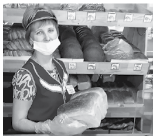
На прилавки – с пылу с жару.