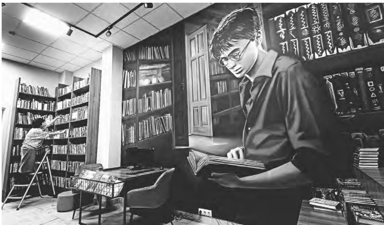
Комната, которую украсила аэрография Николая Замятина.