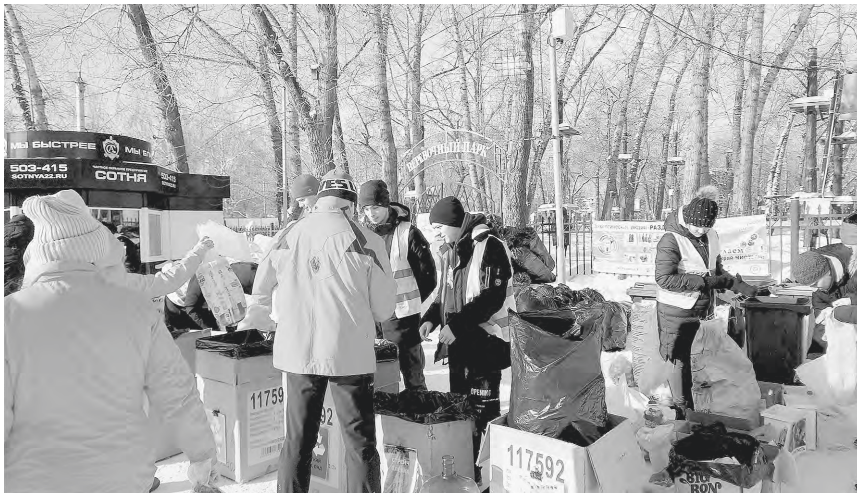
Более 900 человек стали участниками экоакции.

— Я всегда бережно относилась к природе и была очень рада, что нашла организацию с такими важными интересами. Как новичка, меня поставили в первый раз на прием несложной фракции — стрейч-пленки. На следующих акциях успела