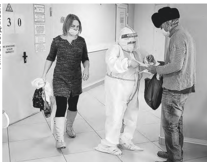
В краевом Диагностическом центре.