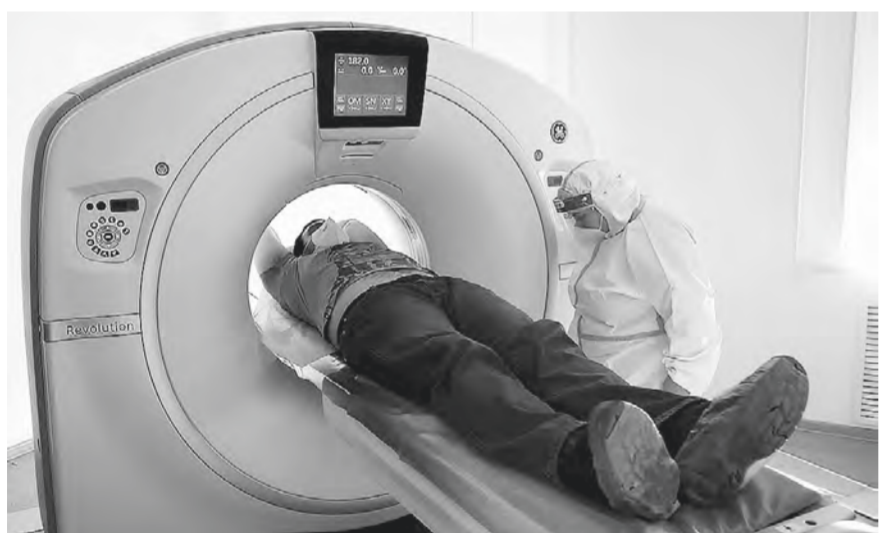
На аппарате компьютерной томографии.