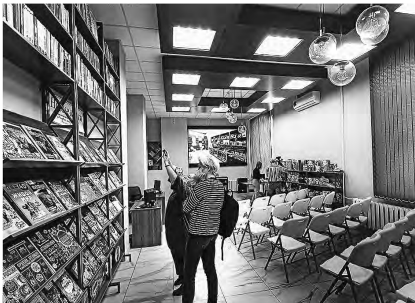
Зал для массовых мероприятий.