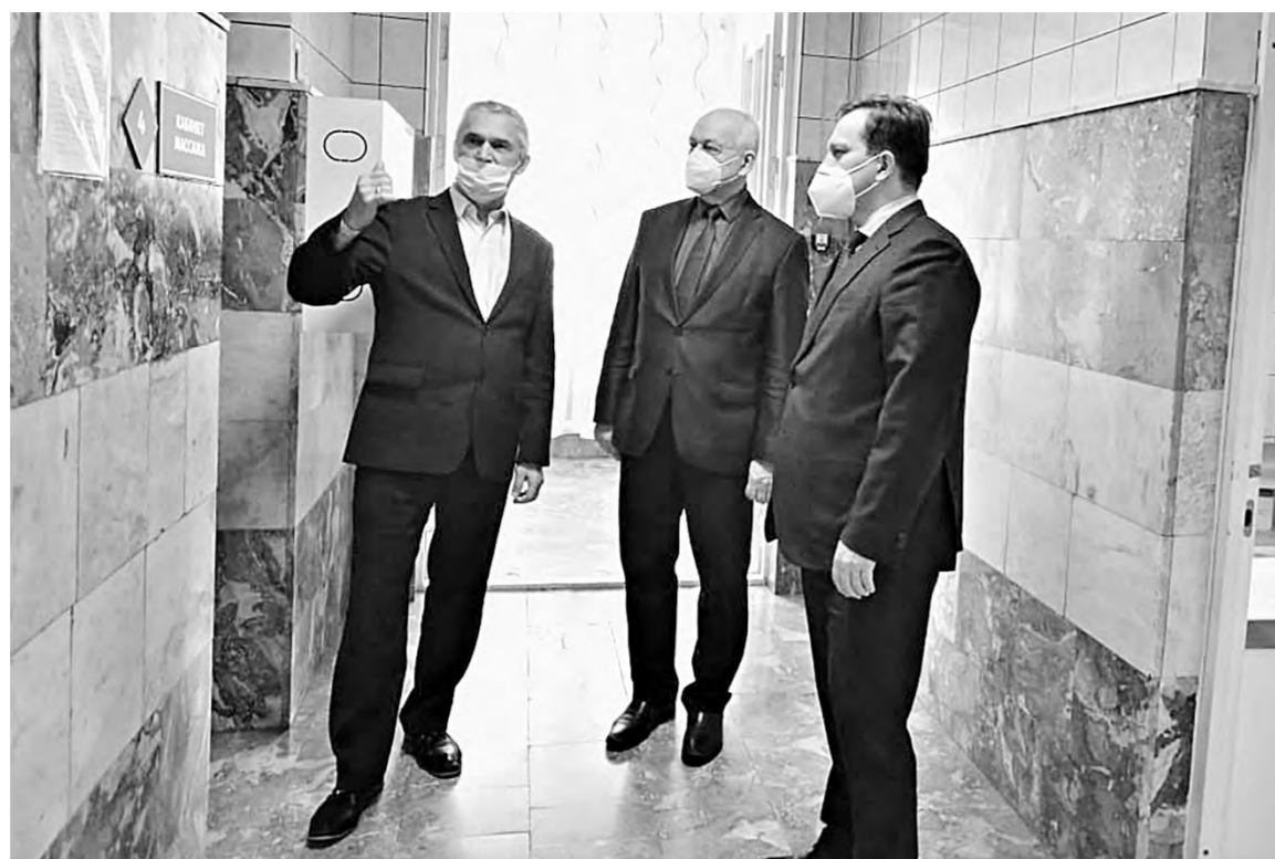
Министр здравоохранения проверяет готовность детской поликлиники.