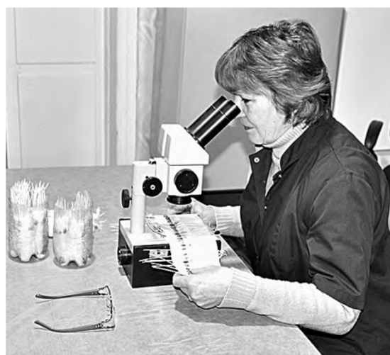
В лаборатории Россельхознадзора в Родинском районе идет проверка семян.

Так, с 27 января была приостановлена образовательная деятельность в 8-м классе Паклинской ООШ – филиала Ситниковской школы, но уже со 2 февраля все классы этой школы были закрыты на карантин. С 27 января по 2 февраля на карантине находились 3-й «В» и 4-й «Б» классы Баявской школы, с 1 февраля – 2-й «Б» класс, со 2-го числа еще два класса – 1-й «Б» и 10-й «А». Четвероклассники Нижнечуманской СОШ не учатся с 1 по 7 февраля.