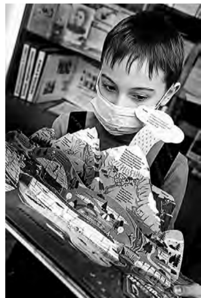
Целый мир – в руках твоих.