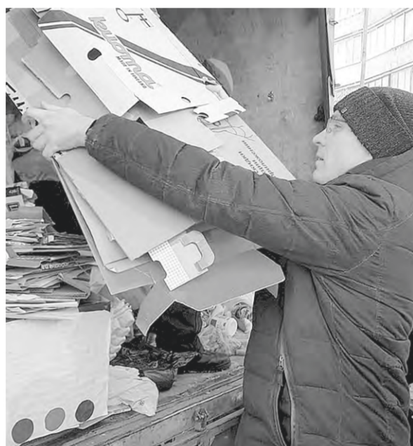
Переработчики приезжали за вторсырьем в выходной день.