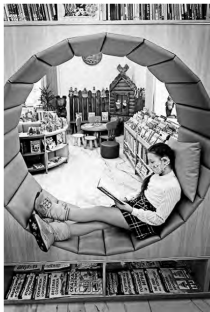
Вот как уютно здесь теперь!