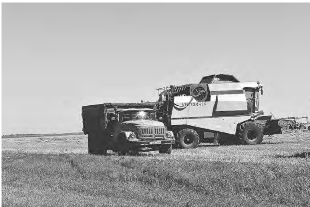
Аграрии Рубцовского района получили хороший урожай и прибыль.

По словам руководителя управления, в Рубцовском районе нет убыточных сель-