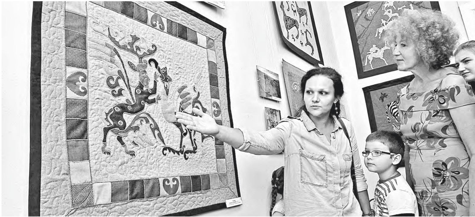
Мастерицы-лоскутницы вновь создадут декоративные панно к юбилею края.

Проект-посвящение юбилею региона под названием «Цвети и пой, мой край родной!» соединил авторскую панно лоскутным шитьем и получил губернаторский грант в сфере социально ориентированных НКО.