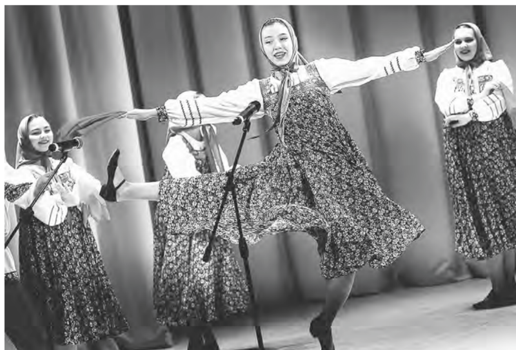
В день открытия на обновленной сцене.