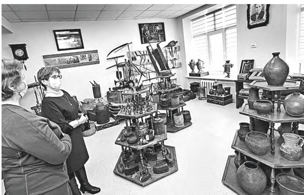
В музее выставлена лишь часть предметов из фондов.

Местный музей может похвастаться огромной коллекцией гонимых изделий и других