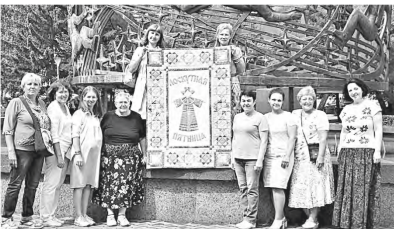
Участницы клуба «Лоскутная пятница».