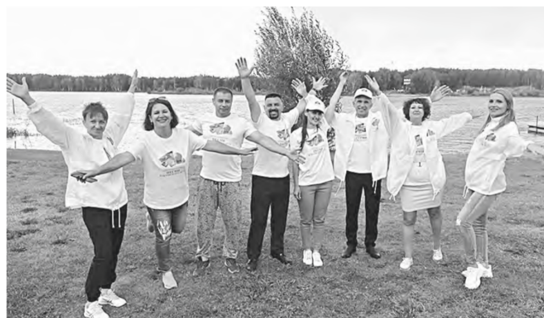
Новые песни композиторов-любителей объединены темой малой родины.