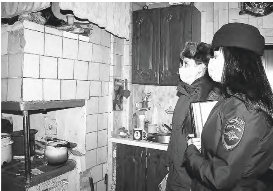
Инспекторы разъясняют простые, но жизненно важные правила.