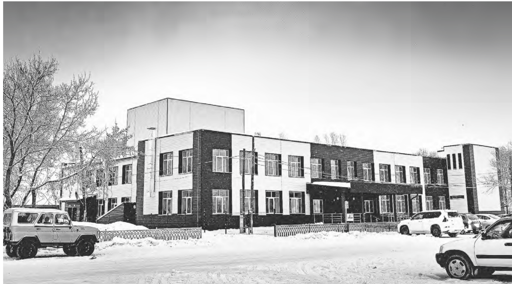
Капитальный ремонт здания обошелся в 47 млн рублей из бюджетов разных уровней.

В Бийском районе открылся после долгого капитального ремонта Дом культуры. Он стал одним из шести объектов в крае, отремонтированных в 2021 году в рамках нацпроекта «Культура».