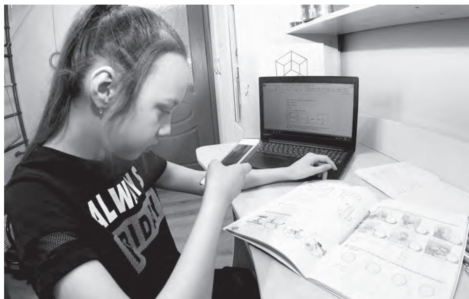
И снова удаленка...