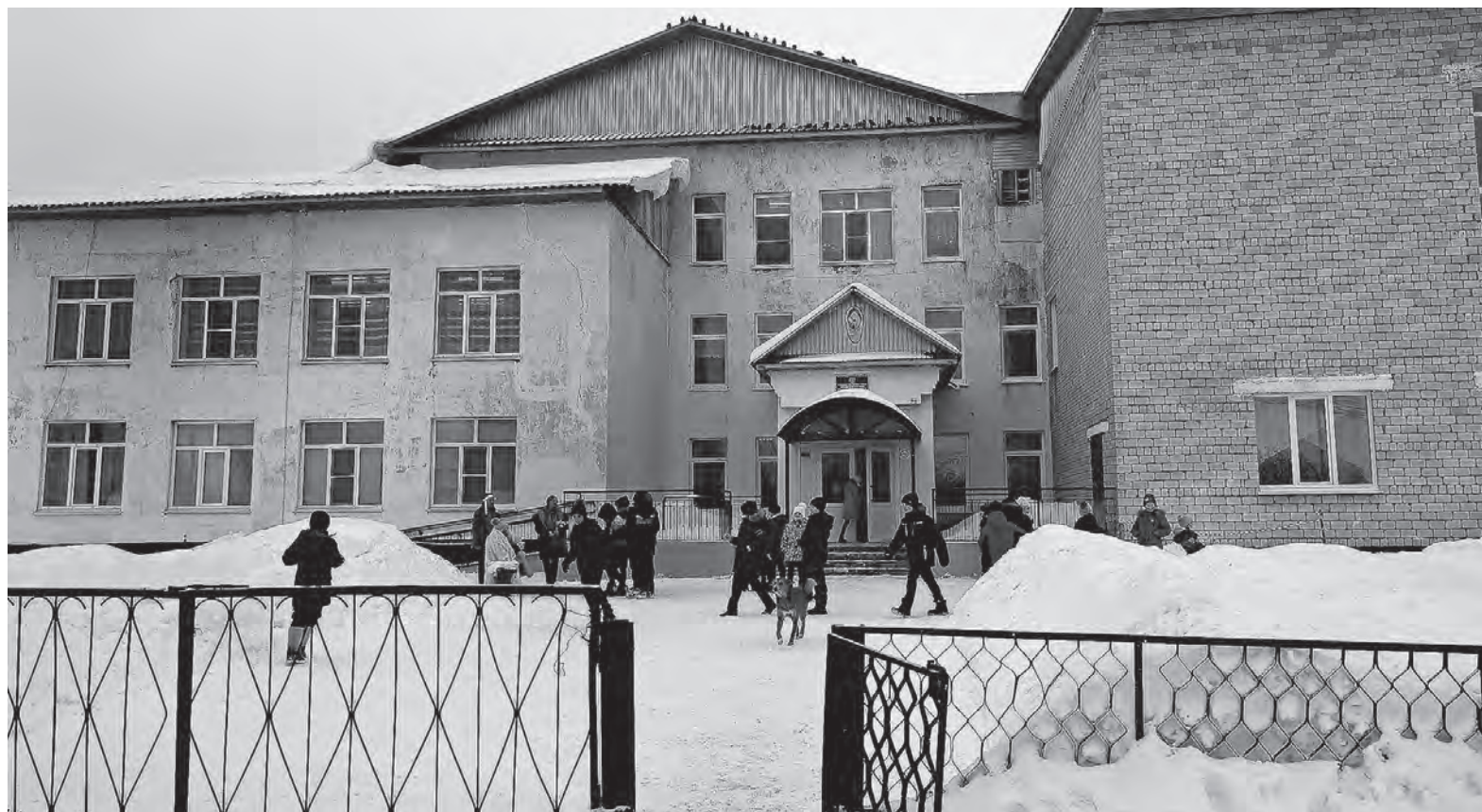
В сложной эпидемической ситуации школам края рекомендовали активнее «разобщать» детей.