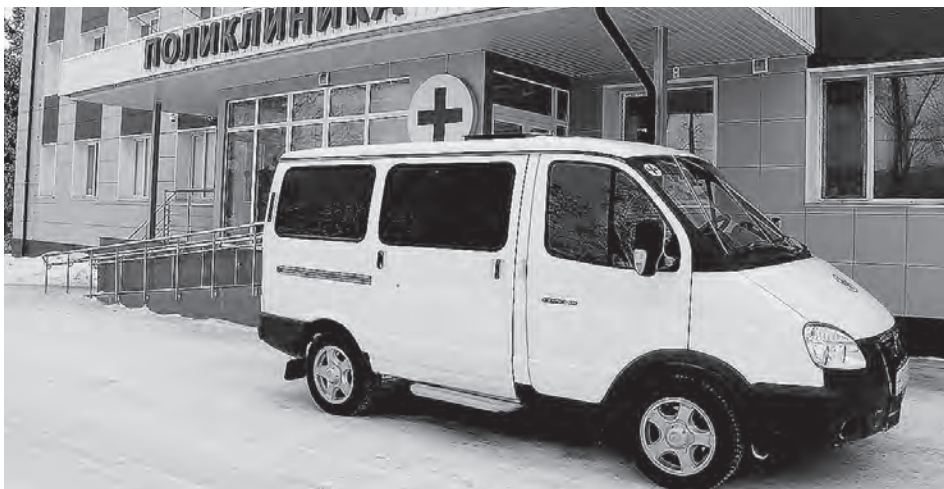
Большая нагрузка ложится на бригады скорой помощи.

Между тем поликлиники края работают в усиленном режиме. И кажется, такого наплыва пациентов они на своем веку еще не видели. Поэтому медики делают упор на оказание неотложной помощи. Участковые терапевты работают в кабинетах неотложки – помогают коллегам-фельдшерам. Именно из-за экстренных мер в некоторых поликлиниках края ограничили оказание плановой помощи. Например, на такие меры пошли в крупнейшей барнаульской поликлинике № 14, обслуживающей 100 тыс. населения Индустриального района.