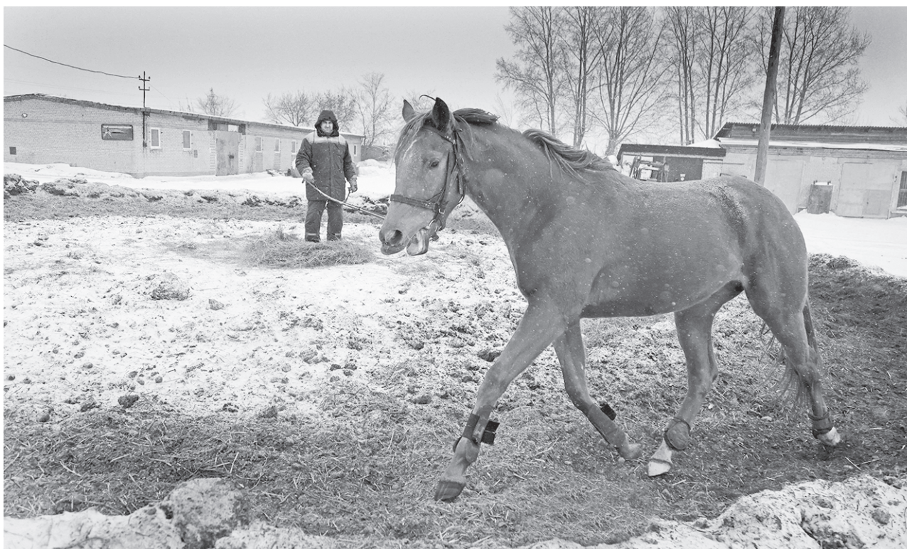
Тренировки рысаков проходят ежедневно.

Лошади выходят на соревнования с двух лет, а пик карьеры у них наступает в 6 лет. К этому времени животные уже достаточно окрепли и готовы показывать хорошие результаты. Есть, конечно, и скороспелые особи, которые показывают лучшие результаты в 4 года, а потом снижают показатели. С такими приходится больше работать, чтобы они к 6 годам не снижали планку. «На пенсию» ло-