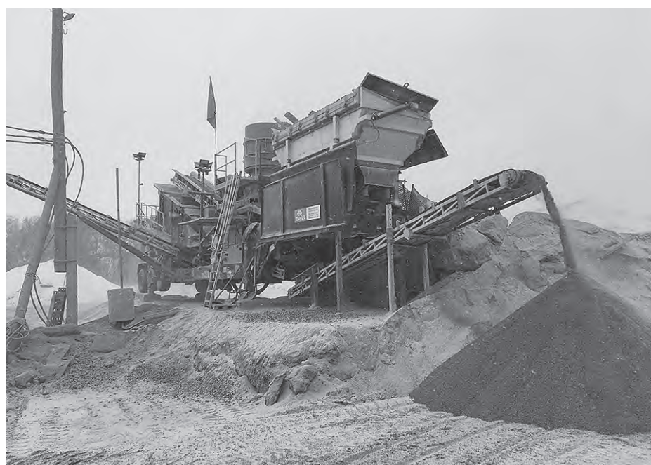
Предприятие работает круглый год.

– Мы работаем круглогодично, зимой и летом. Иногда прерываемся из-за сильных морозов. Когда температура воздуха опускается ниже минус 30 градусов, техника перестает справляться с нагрузками. Стоит учитывать, что в горах на несколько градусов холоднее, поэтому