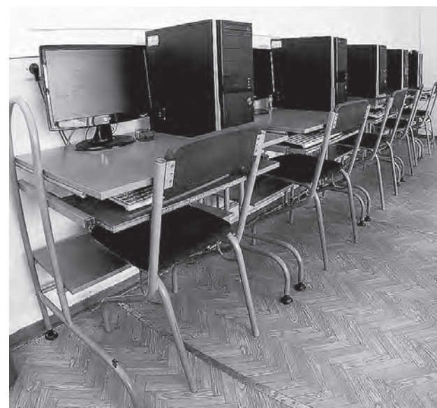
Пона полностью на дистанте 11 школ.