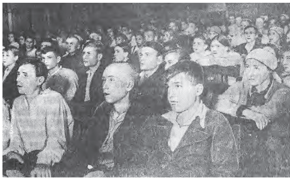
Митинг в клубе Барнаульского меланжевого комбината.

В предвоенном 1940-м в издательстве «Алтайская правда» работало 273 человека. Процент же текучести в 1939-м составлял 56,61. Принято в том году на работу было 159 человек, а уволено 149. Найдем ли мы когда всех коллег-фрон-