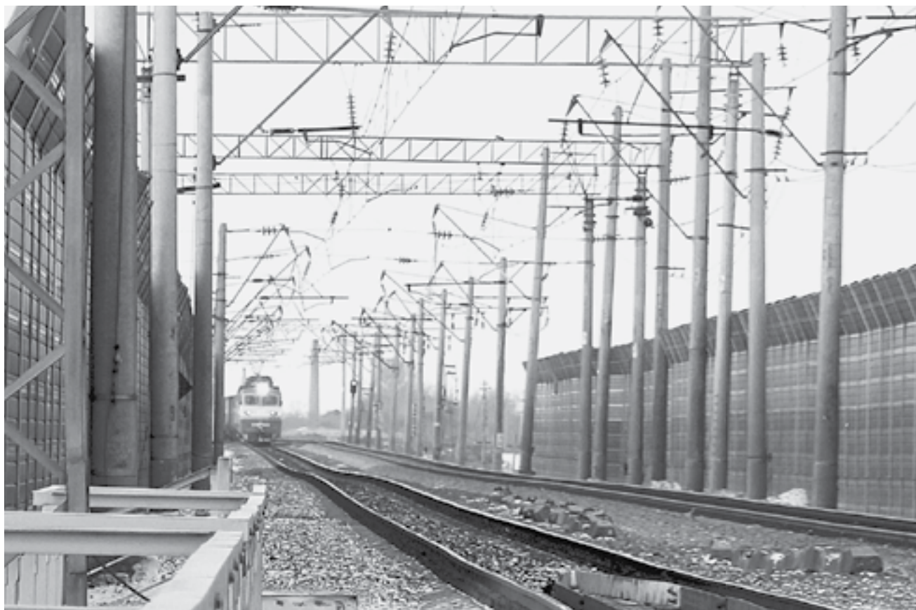
В Камне на железнодорожных путях не первый раз гибнет ребенок.