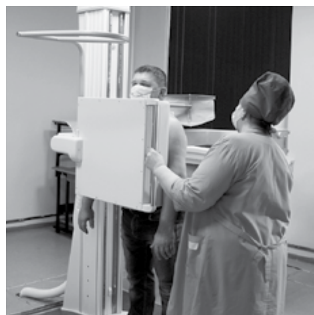
2 компьютерных томографа, 10 маммографов, 9 рентгеноаппаратов, 26 флюорографов приобретены в регионе в 2021 году по программе «Модернизация первичного звена здравоохранения Алтайского края».

На Алтае работают 1056 почтовых отделений (877 – в сельской местности). Ежегодно здесь принимают, обрабатывают и доставляют более 15 млн писем, 700 000 посылок, 1 млн денежных переводов.