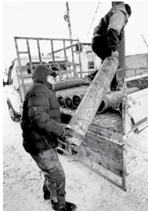
В больницах очень ждут баллоны с кислородом.