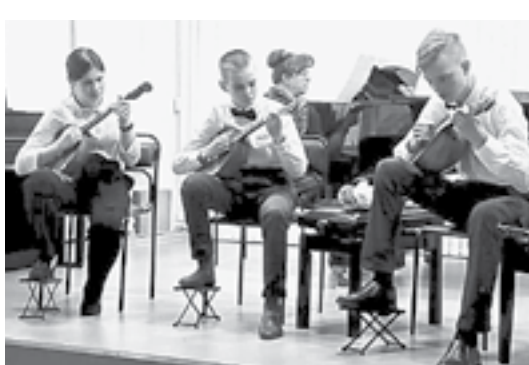
Домристы из Сибирского.

Впервые в районе проведен конкурс на районный грант «Молодежная инициатива». Бюджет финансовой поддержки составляет 30 тыс. рублей. На рассмотрение экспертного жюри было подано четыре заявки, после обсуждения проектных заявок лучшими были признаны две: «Скайт-лагерь» – Ельцовской школы, с бюджетом 11 200 рублей, направление – организация досуга детей, и кукольный театр «Жили-были в Пуштулиме» – Пуштулимской школы, с бюджетом 16 950 рублей, направление – оказание