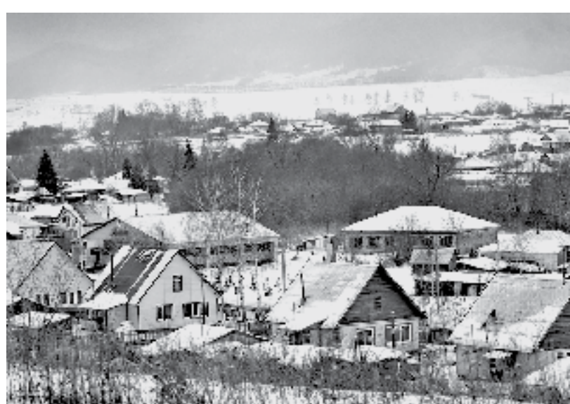
Объем трансфертов муниципальным образованиям – 41 795 млн рублей.

Оперативные итоги исполнения краевого бюджета за 2021 год рассмотрели на заседании комитета АКЗС по бюджетной, налоговой, экономической политике и имущественным отношениям. Доходы краевого бюджета в 2021 году составили 150 851 миллион рублей, или 112% к аналогичному периоду прошлого года. В том числе налоговые и неналоговые доходы – 73 556 миллионов рублей, или 112% к плану