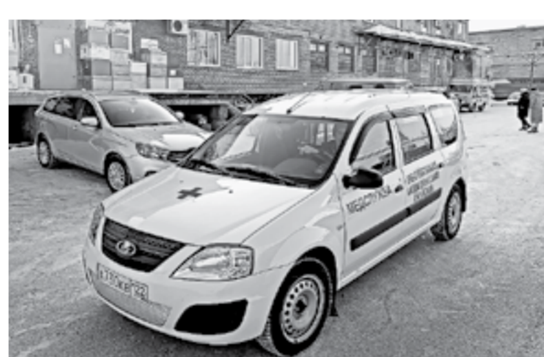
Препарат доставляют в детские учреждения здравоохранения.

Наталья АНДРОНОВА, Евгений НАЛИМОВ (фото)