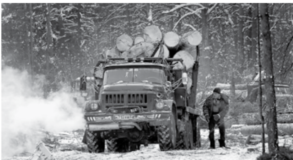
Каждый куб спеленной древесины теперь контролирует ЛесЕГАИС.

Раньше недобросовестные предприниматели могли по одному документу