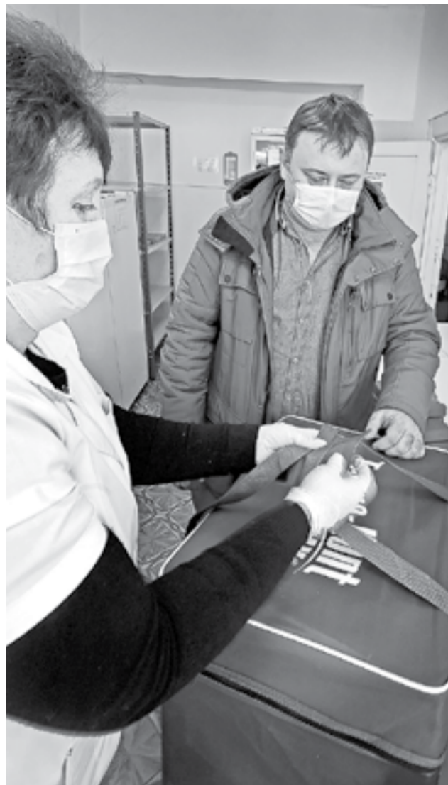
Регион получил вакцину одним из первых.