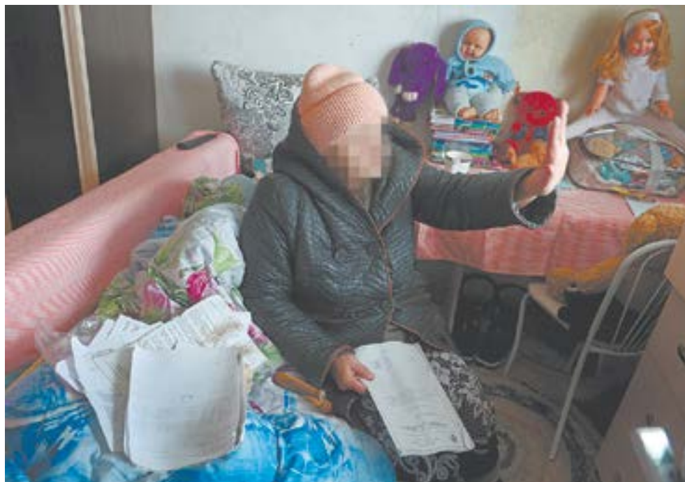
Вот уже много лет пенсионерка жалуется в различные инстанции, но при этом отказывается от предлагаемой ей помощи.

– А вы не пробовали летом просушить и обработать антигрибковым составом стены?