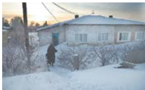
Жилье советской постройки нуждается в хорошем ремонте.

– Сколько у вас классов образования? – пошла в атаку моя визави. – Вы же видите, мне проще в новое жилье уйти, чем старое в порядок привести. Неужели я не работала, когда телятницей впахивала?