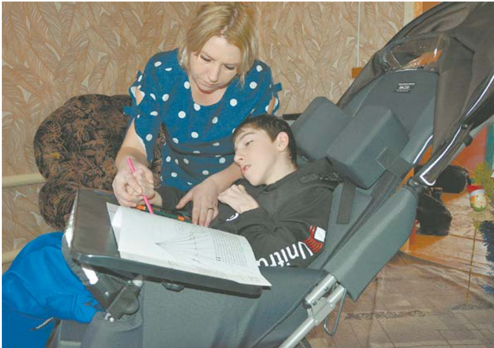
Рисовать можно и сидя в коляске.