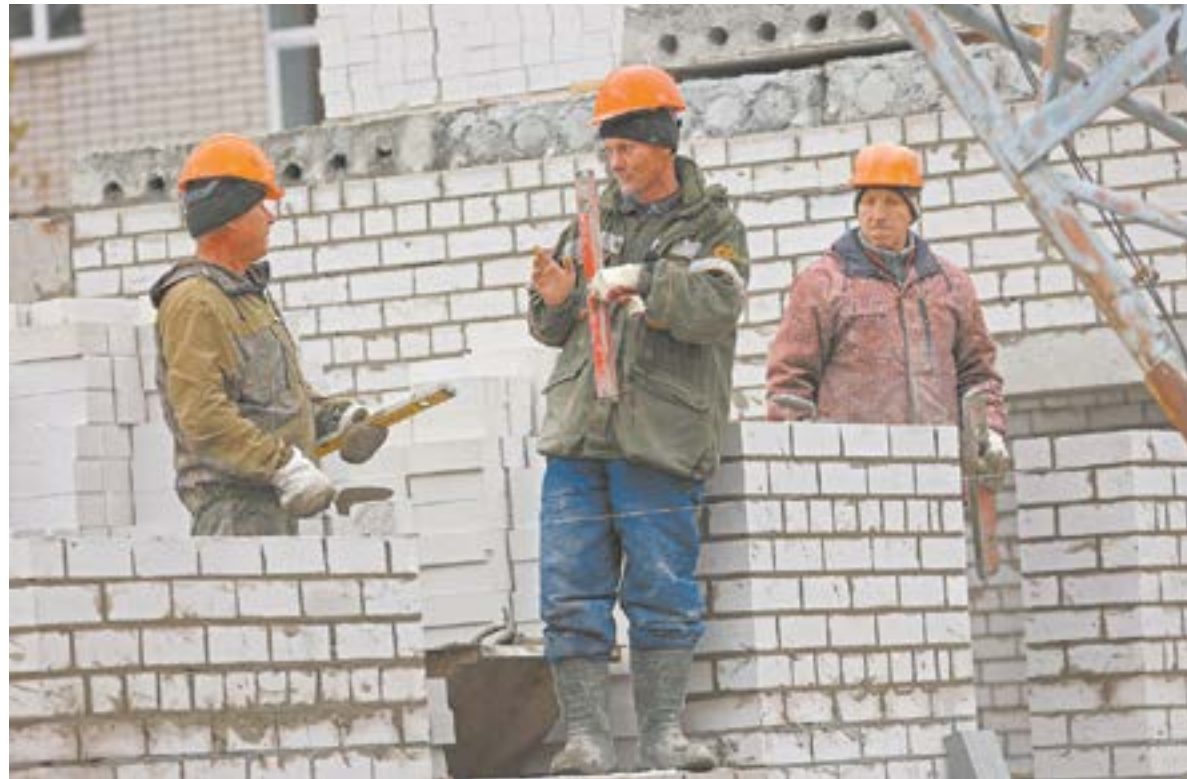
Желающих строить социальные объекты становится все меньше.

С октября 2020 года стал раскручиваться маховик инфляции: сначала начал дорожать металл, а в 2021 году и остальные материалы. Недостаток иностранных рабо-