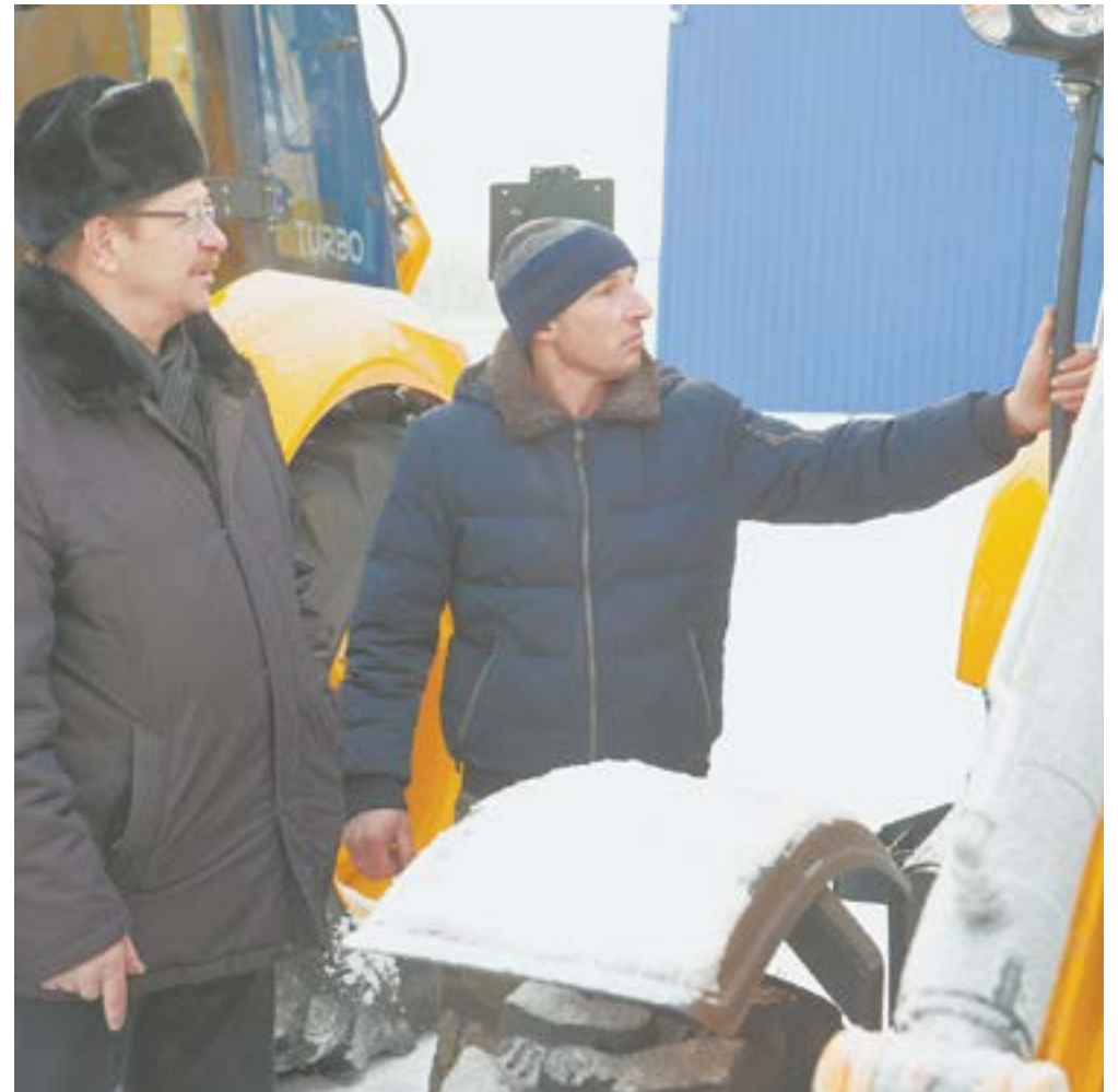
Новую коммунальную технику ждут в селах края.