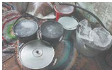
В доме без отопления вместо воды – лед.

«Человек общительный, доброжелательный, с односельчанами поддерживает уважительные взаимоотношения. Однако в силу своего заболевания тяжело переносит психоэмоциональные нагрузки. В такие периоды ослаблен самоконтроль. Состояние ухудши-