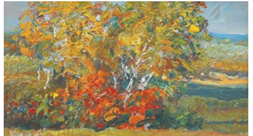
«Осенние ветры» (2019).