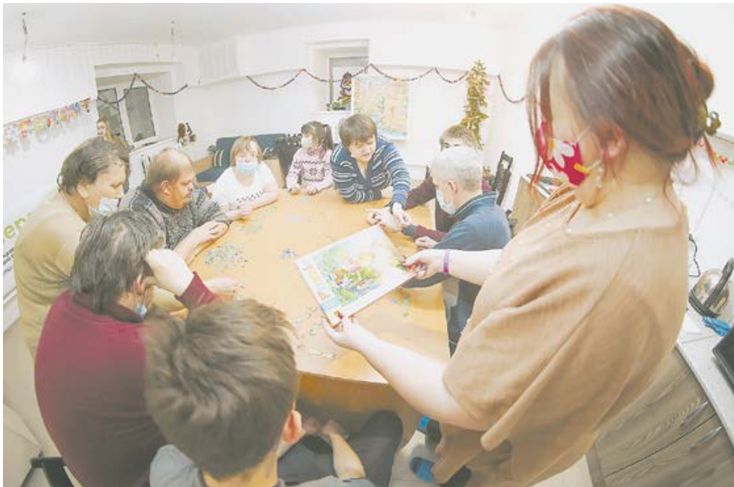
Главный принцип организации – командная работа.