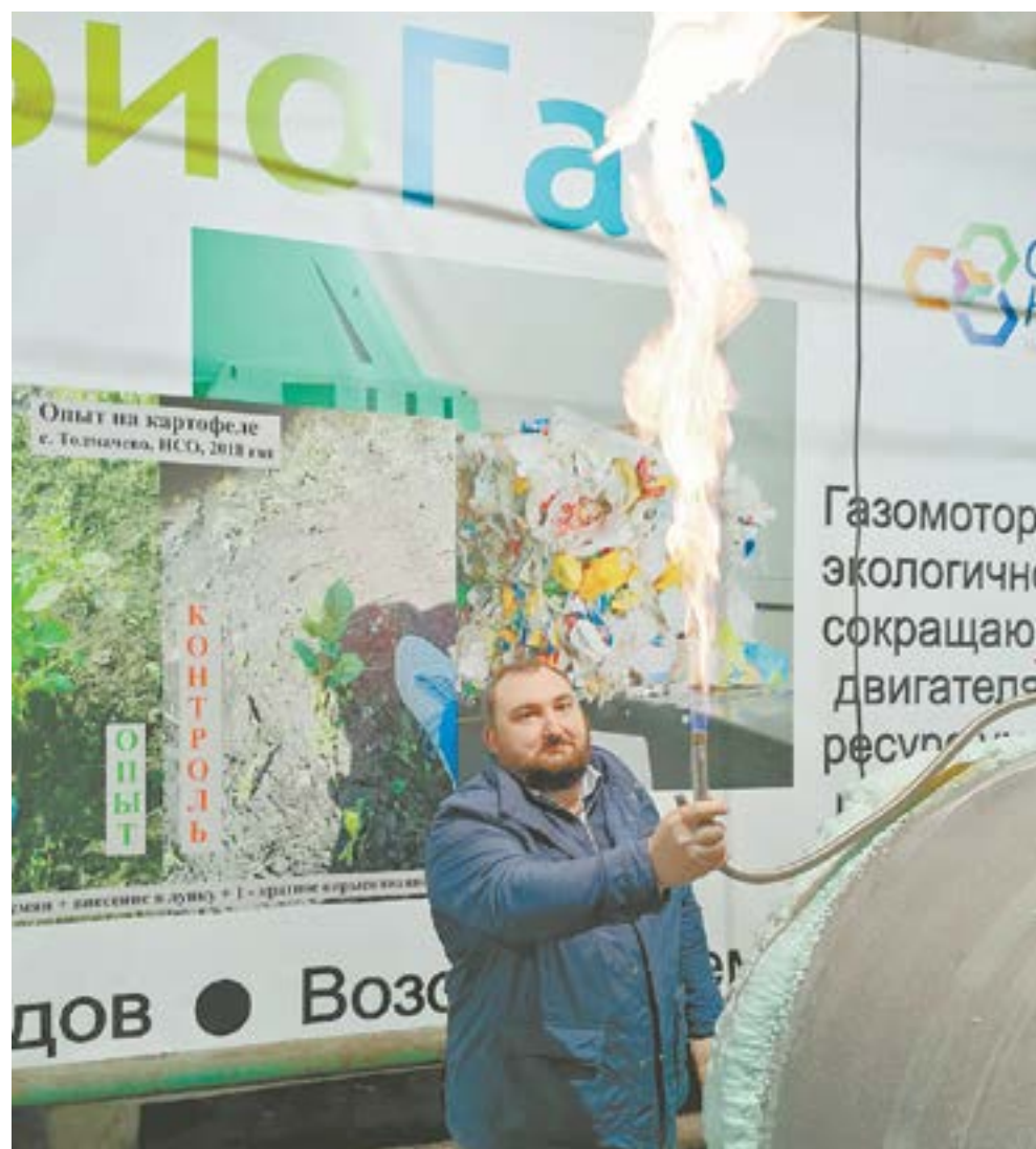
Новосибирцы получают из навоза биогаз и высококачественное органическое удобрение.