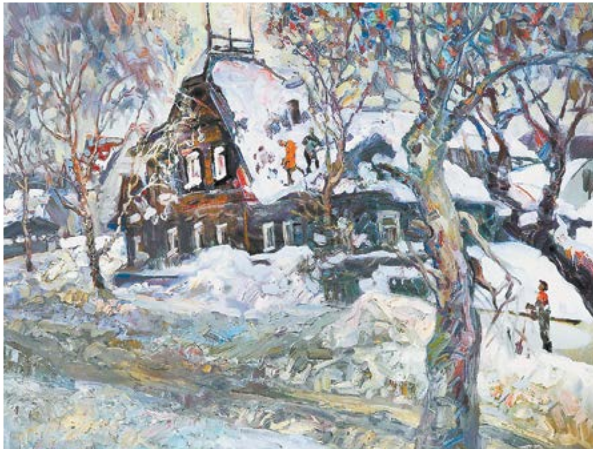
«Весна на улице Ползунова» (2020).

«Это удивительный тип художника: он абсолютно понимал, что