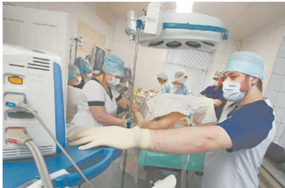
Эндоскопия в урологии – не завтра, а сегодня.

– В 1992-м году, когда я только начинал работать, к нам поступали лишь единицы пациентов с острым паренхиматозным про-