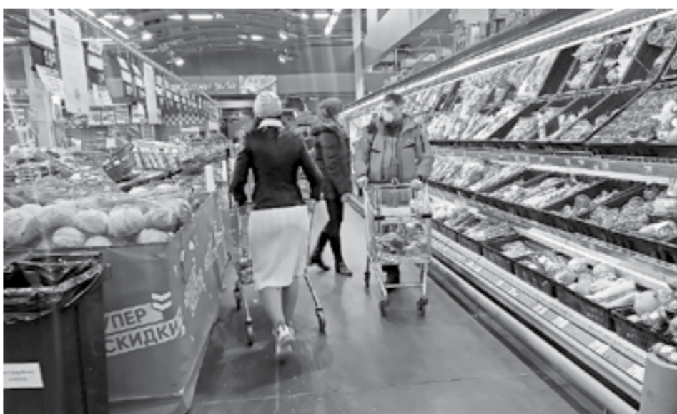
Торговые центры ориентируются на конкурентов.

И вот на прошлой неделе «Магнит», «Бристоль» и X5 Group, в которую входят «Пятерочка», «Перекресток», «Карусель», объявили, что до конца 2022 года не будут повышать более чем на 10% наценку на социально значимые категории товаров.