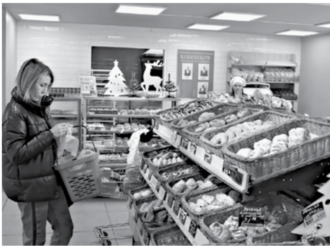
Большинство торговых сетей предлагают выпечку собственного производства.

Для обуздания инфляции он, в частности, посоветовал создавать потребительские кооперативы по примеру относительно бедных стран Латинской Америки и богатой