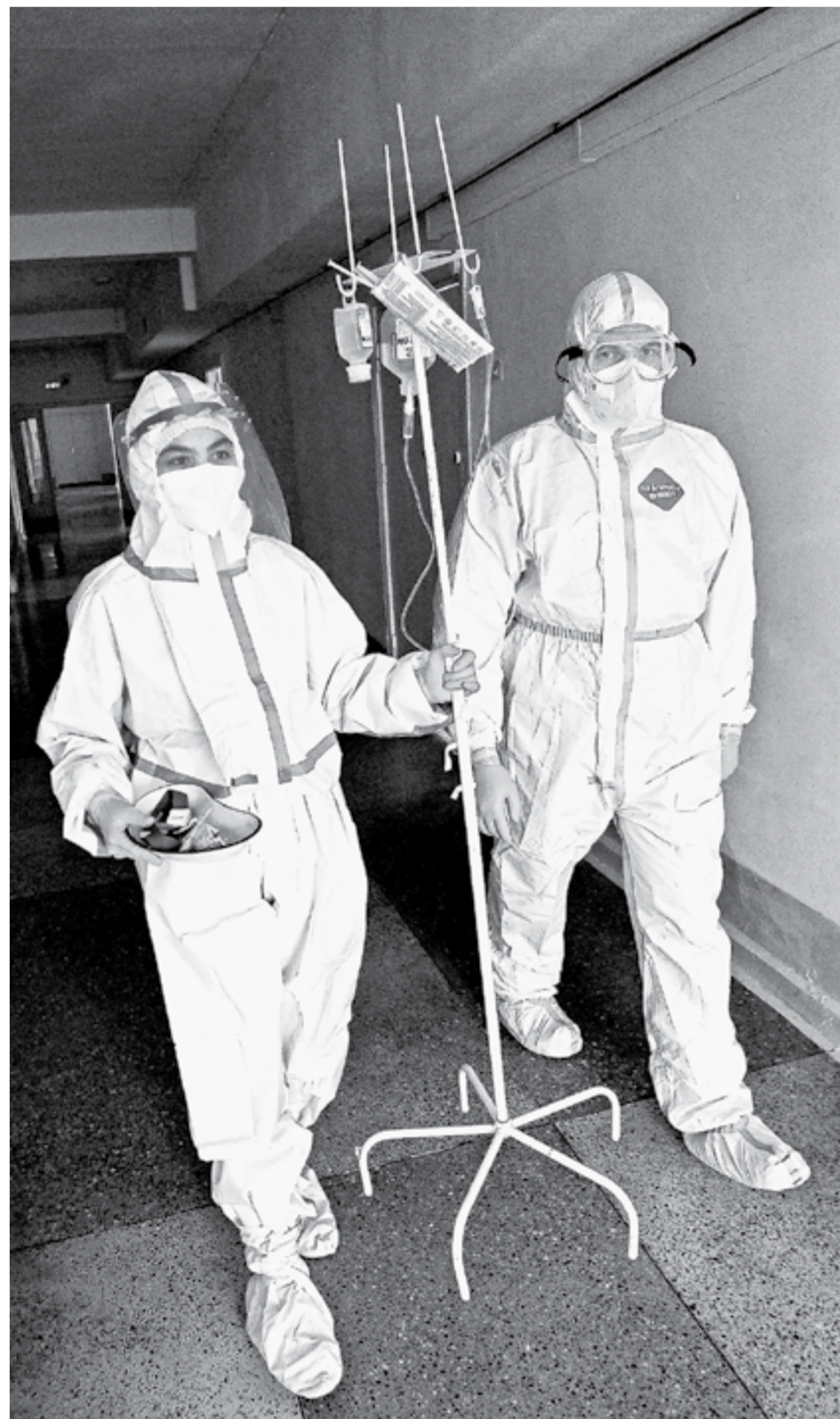
В медучреждениях снова режим повышенной готовности.