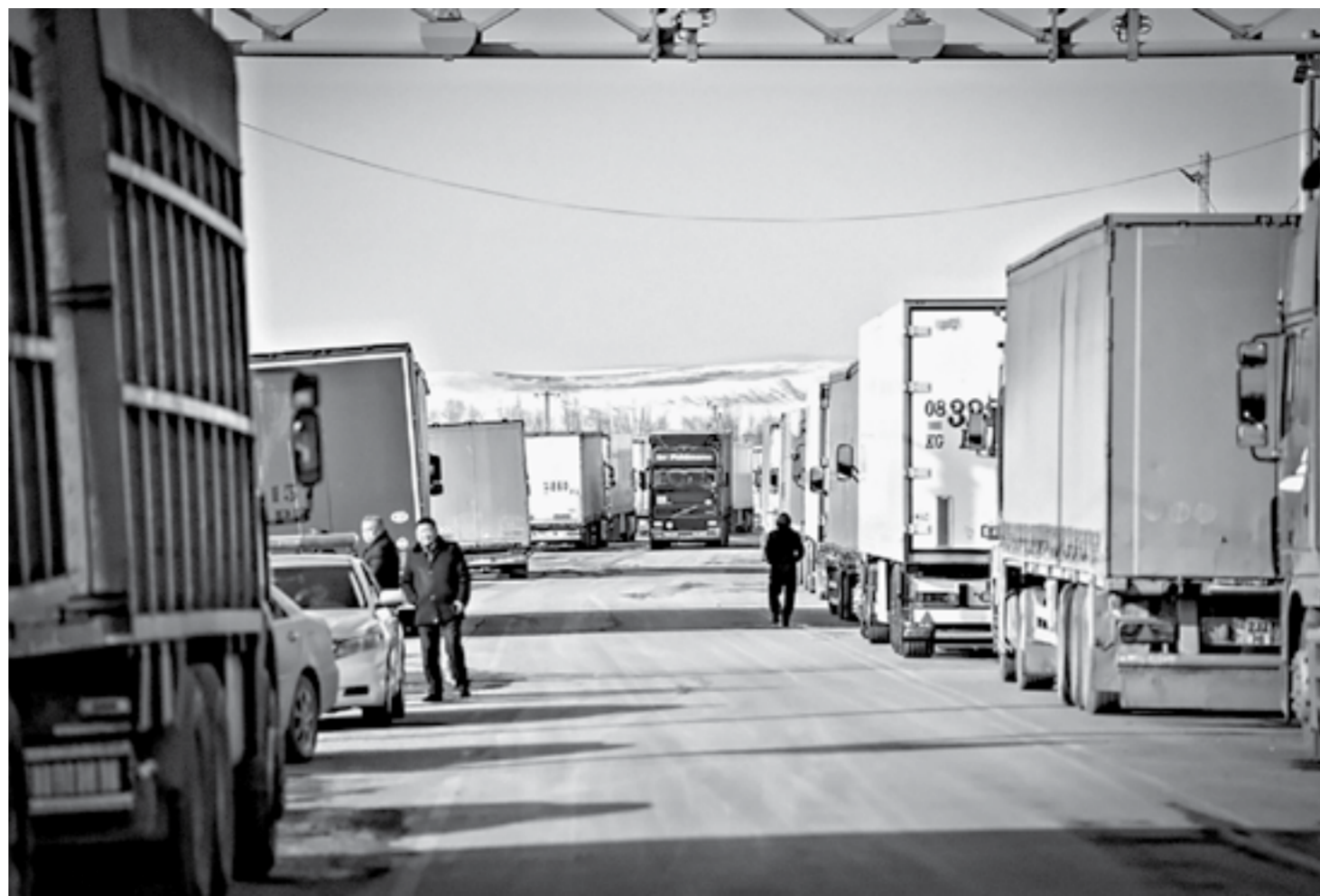
Пока не все транспортные компании решаются отправлять грузы в Казахстан.

Сегодня, 19 января, должны снять режим ЧС в Казахстане. И это очень важно для тех, кто ведет внешнеторговую деятельность с этим государством.