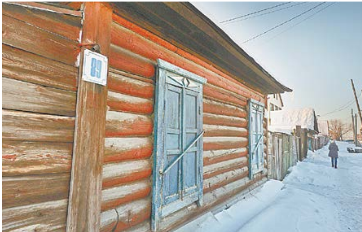
На улице Гоголя нет ни одной работающей колонки.