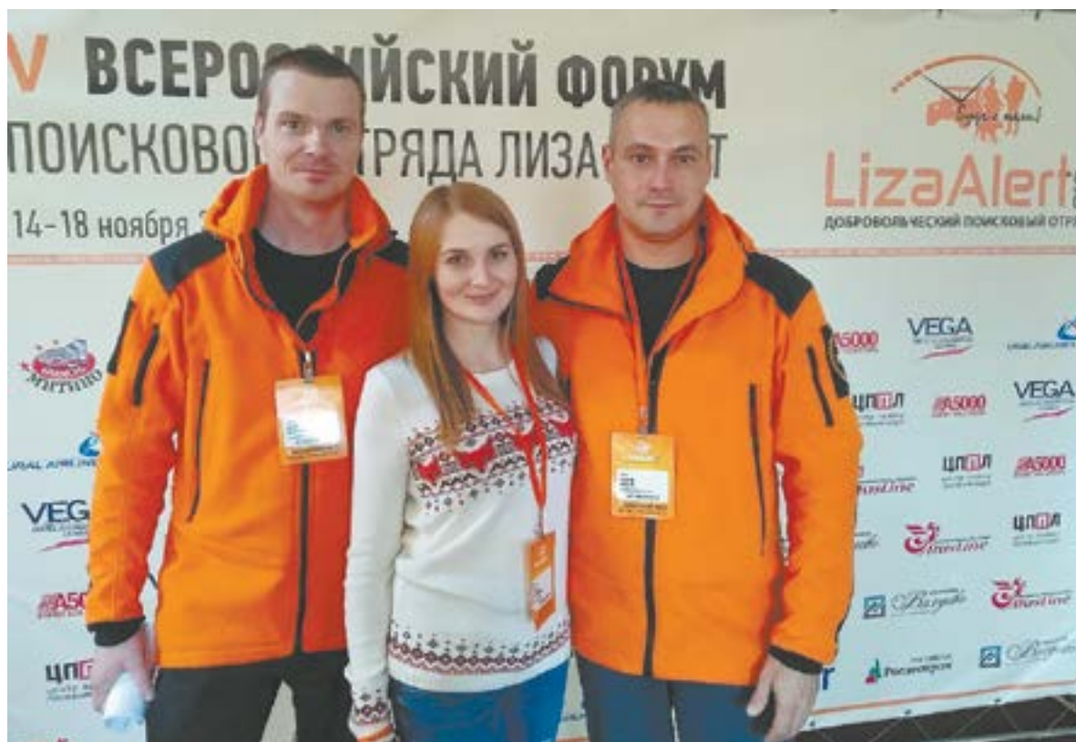
В отряде более 150 волонтеров.

Искали потерявшегося подростка около трех часов, учитывая все организационные моменты.