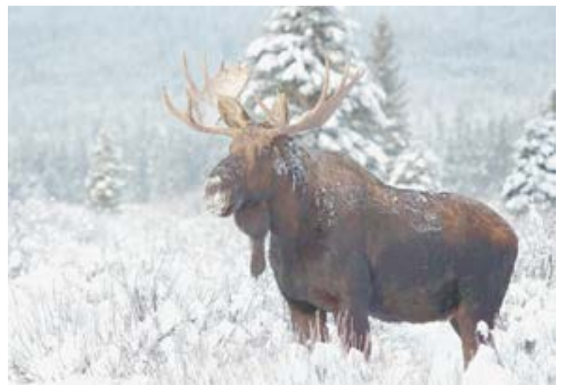
Хвоя – важный компонент зимнего рациона не только лошадей, но и диких животных.