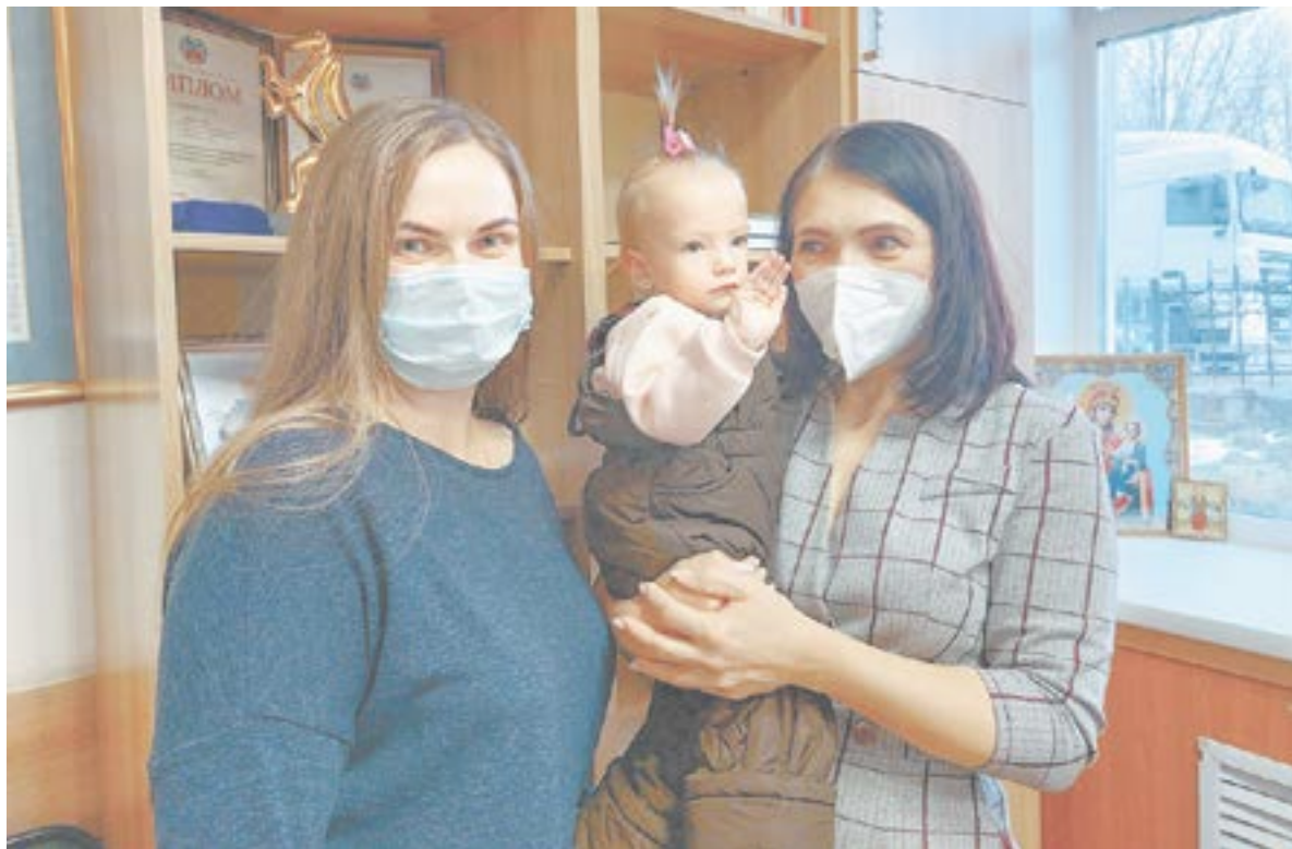
Благодаря доброте и отзывчивости благотворителей вновь удалось помочь особенным детям.

В этом году конкурс собрал более 220 участников из четырех ре-