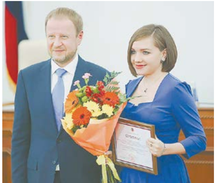
В зале – лучшие журналисты края.