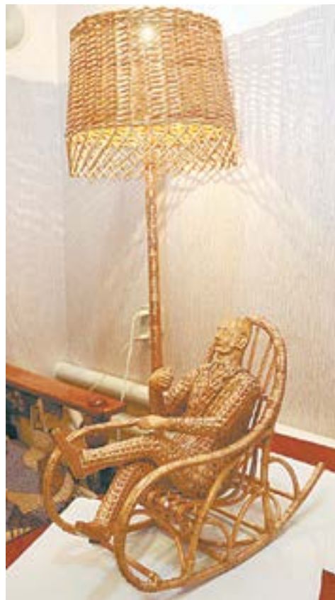
То, что добавляет уюта.