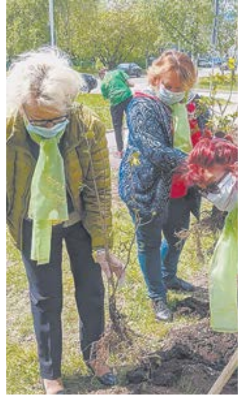
Посадка аллеи в память о В. Гризодубовой.

В 2021 году Союз женщин России отметил свое 80-летие, являясь правопреемником созданного в грозном 1941 году Антифашистского комитета советских женщин.