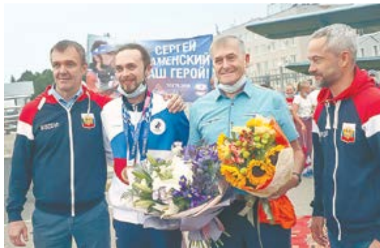
Чествование призера Олимпиады – стрелка Сергея Каменского.

«Я СЧИТАЮ, ЧТО ВСЕ НАШИ КОМАНДЫ ДОЛЖНЫ ПРИЙТИ К ТОМУ, ЧТОБЫ НА 15% ФОРМИРОВАТЬ СВОЙ «КОШЕЛЕК» ИЗ ВНЕБЮДЖЕТКИ».