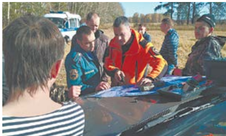
Чаще всего люди пропадают в летний сезон.