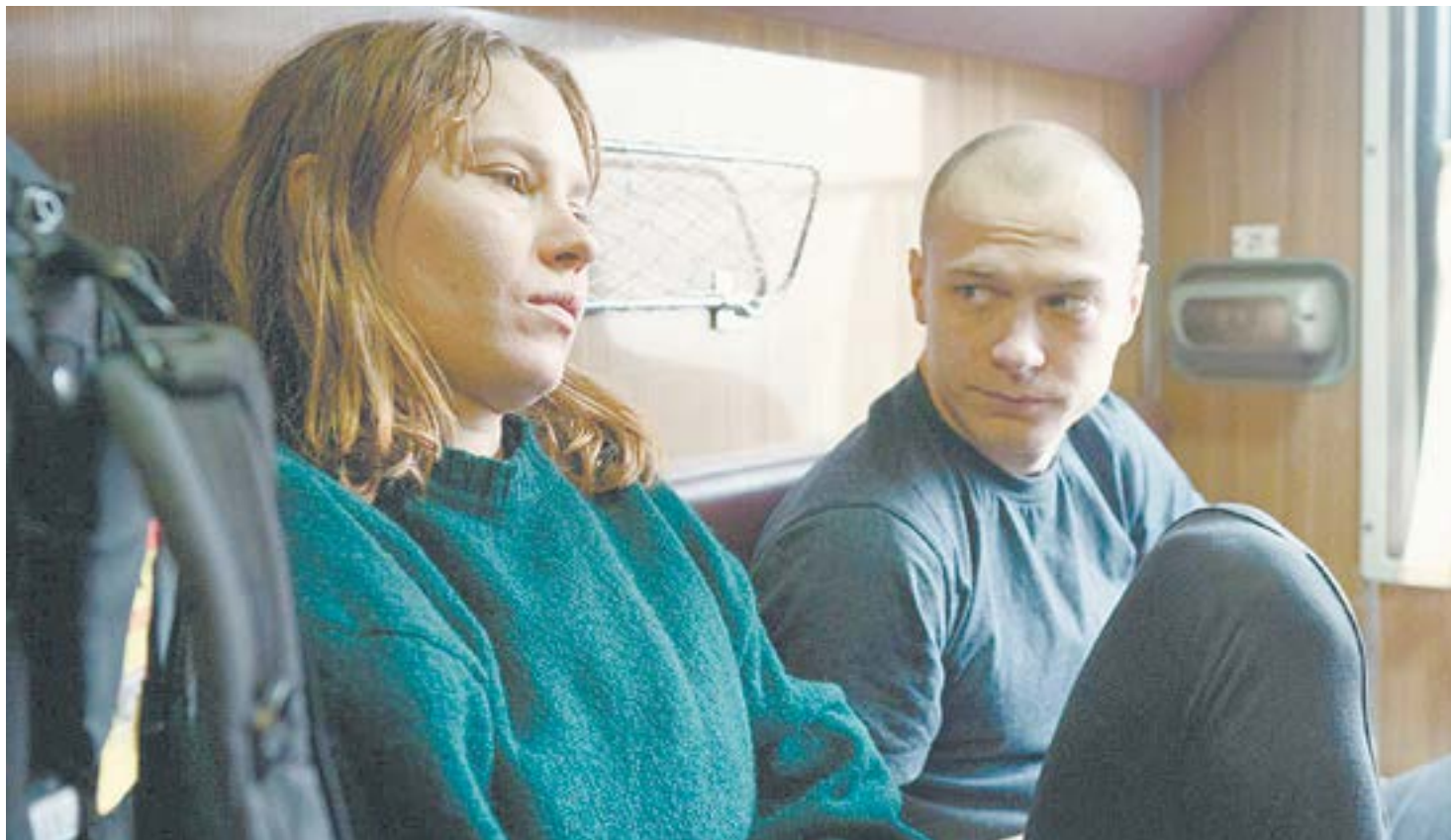
Пока за окном усиливается буря, случайные попутчики оттаивают.

А в купе поезда обнаружится неприятный попутчик – заранее пьяный и про-