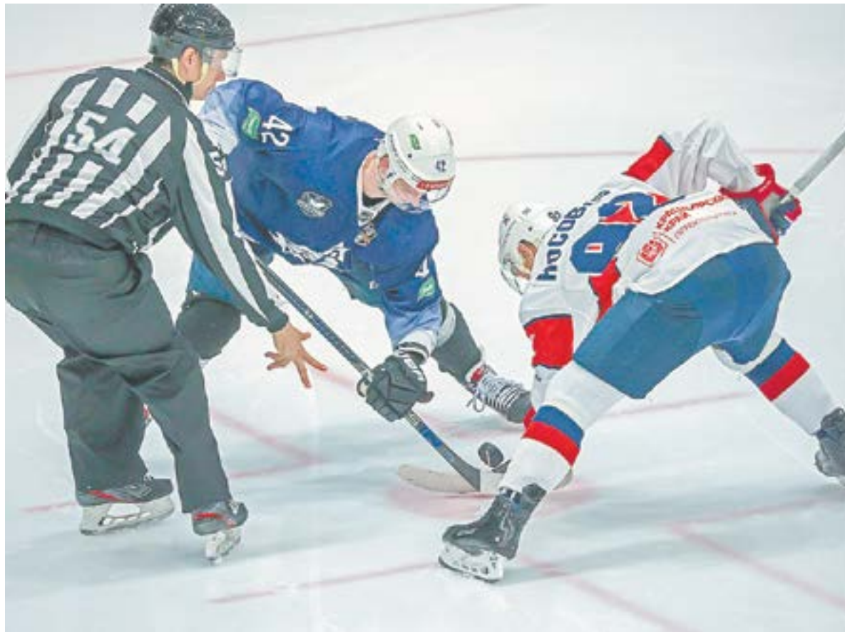
На точке вбрасывания – весь алтайский спорт.

– В финансировании краевой спортивной отрасли наблюдается положительная тенденция. Еще в 2017–2018 годах на спорт