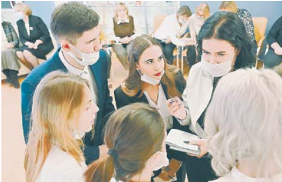
Занятие школы наставничества.

Активистки женского движения края считают, что в наступившем XXI веке в России главной национальной идеей обязательно выступает патриотизм, помогающий сохранить детей, семью, Родину-мать и мир на нашей Земле. И потому советы женщин принимают участие во всех патриотических акциях, объявленных в стране и крае и по линии Союза женщин России. Постоянно иницилируем и свои собственные. Так, в рамках Всероссийской акции «Женское лицо Победы», начавшейся в год 75-летия Великой Победы, мы в крае объявили краевую акцию «Святая память и боль в глазах твоих». Ее суть – адресная забота об оставшихся в живых вдовах, запись их воспоминаний, историй жизни. Ведется работа по созданию в столице края памятника вдов-