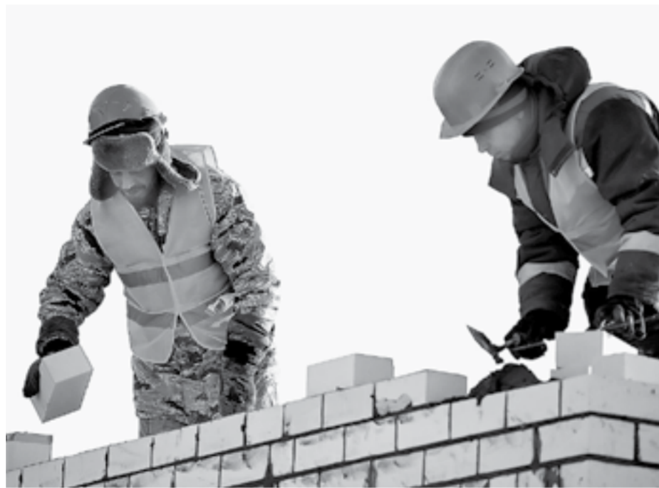
Работы планируют завершить в 2023 году.

В Барнауле реконструируют поликлинику горбольницы № 3. Это будет одноэтажное здание площадью почти 1,5 тысячи квадратных метров.