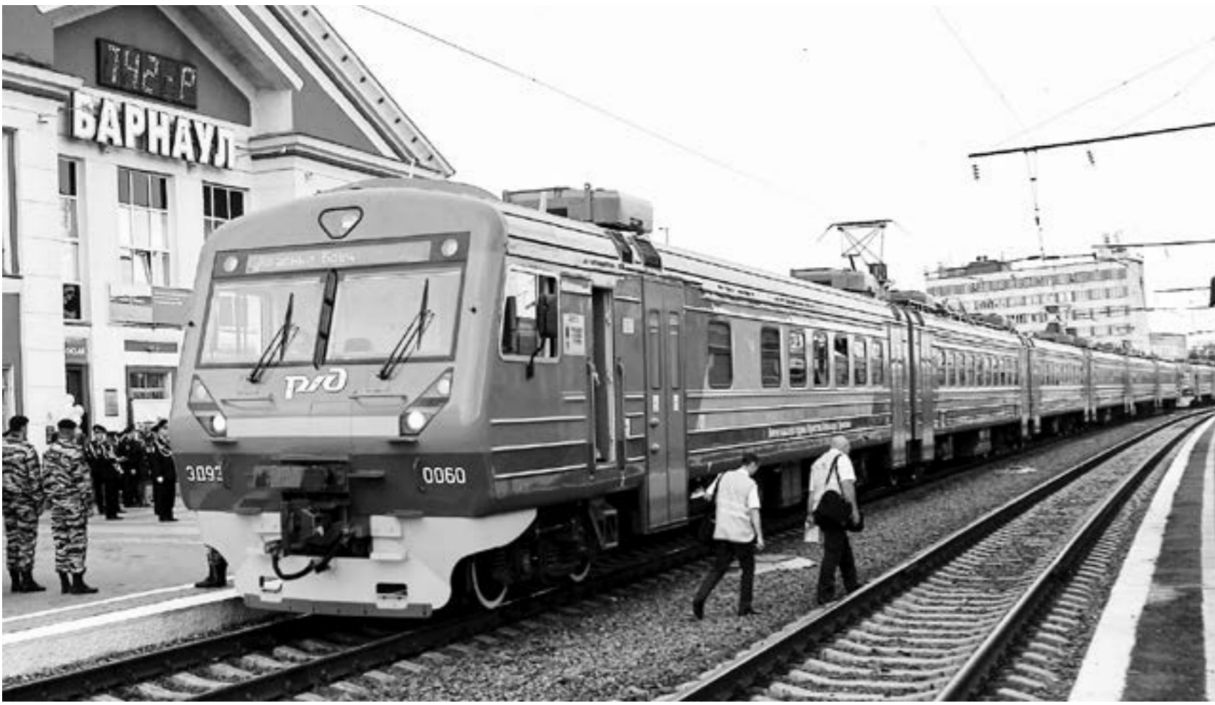
Железнодорожной ежегодно пользуются больше 8 млн жителей края.

Если первоначально соглашение по созданию интеллектуальной транспортной системы (ИТС) в Барнаульской агломерации предполагало выделение из федерального бюджета 360 млн рублей на три года, то согласно проекту нового соглашения сумма увеличена до 489 млн. Между тем проектная стоимость ИТС составляет порядка 900 млн рублей, так что еще придется искать 400 млн на ее полное внедрение.