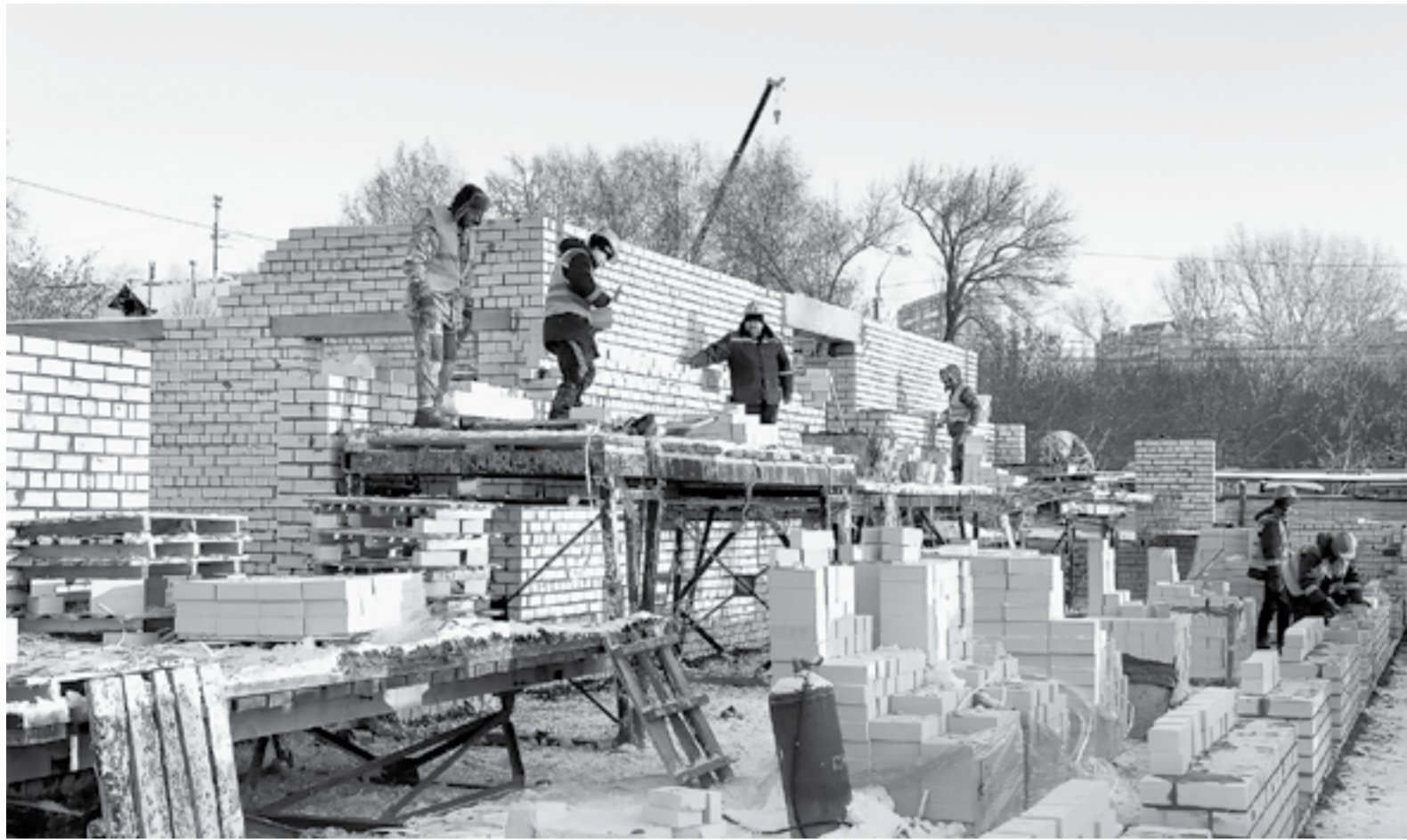
В новом здании будет несколько диагностических блоков.