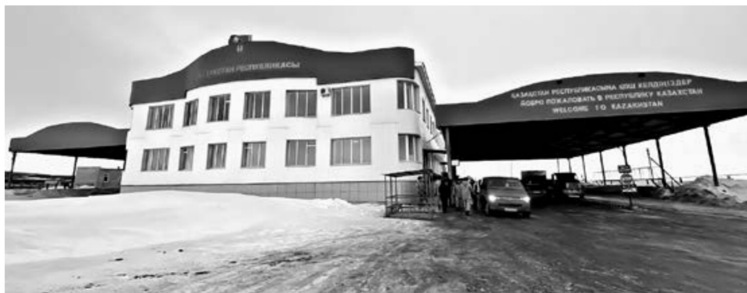
Автомобильный пункт пропуска, казахстанско-российская граница.