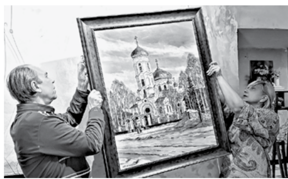
Все работы выполнены известными бийскими художниками.