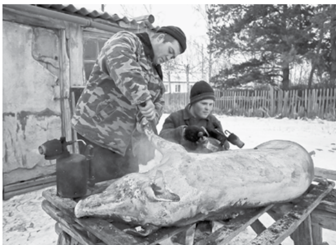
Убой скота на частных подворьях запрещен, если мясо идет на продажу.