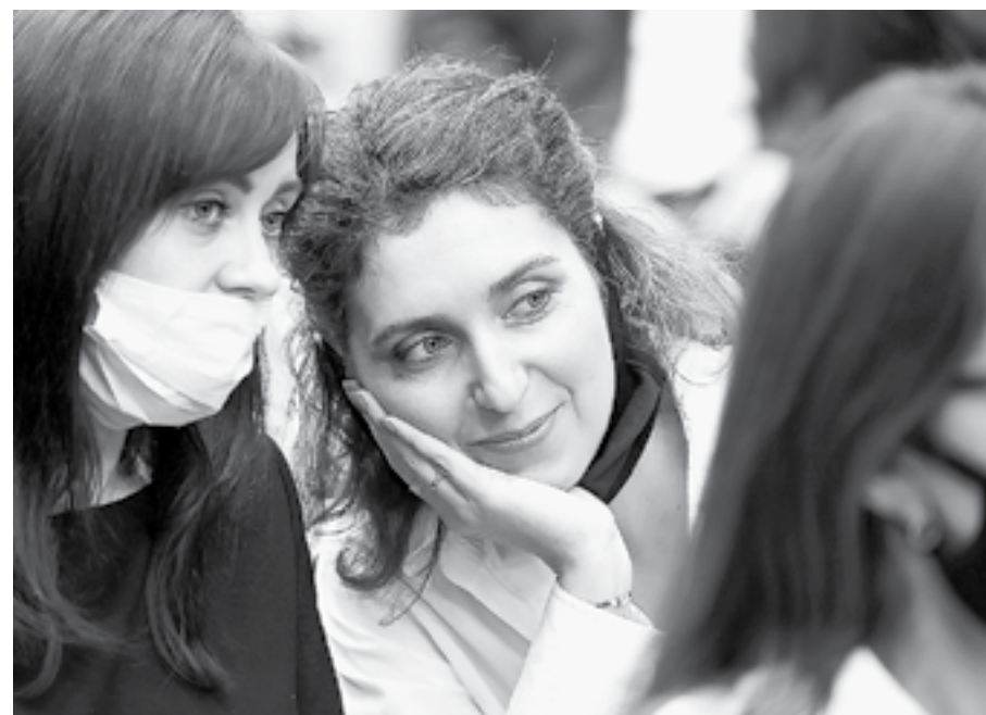
Обучение прошло на одном дыхании.