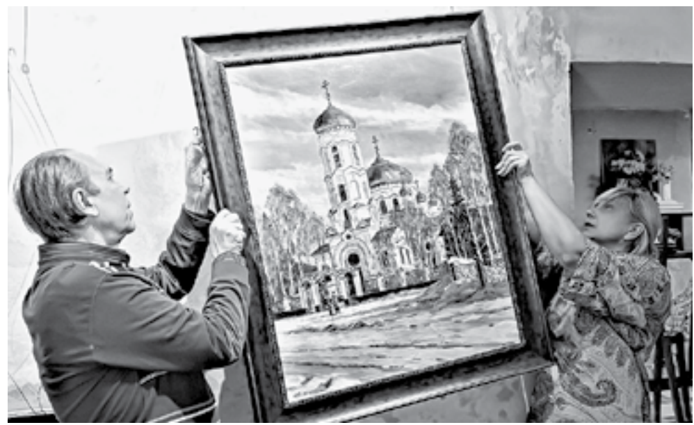
Все работы выполнены известными бийскими художниками.