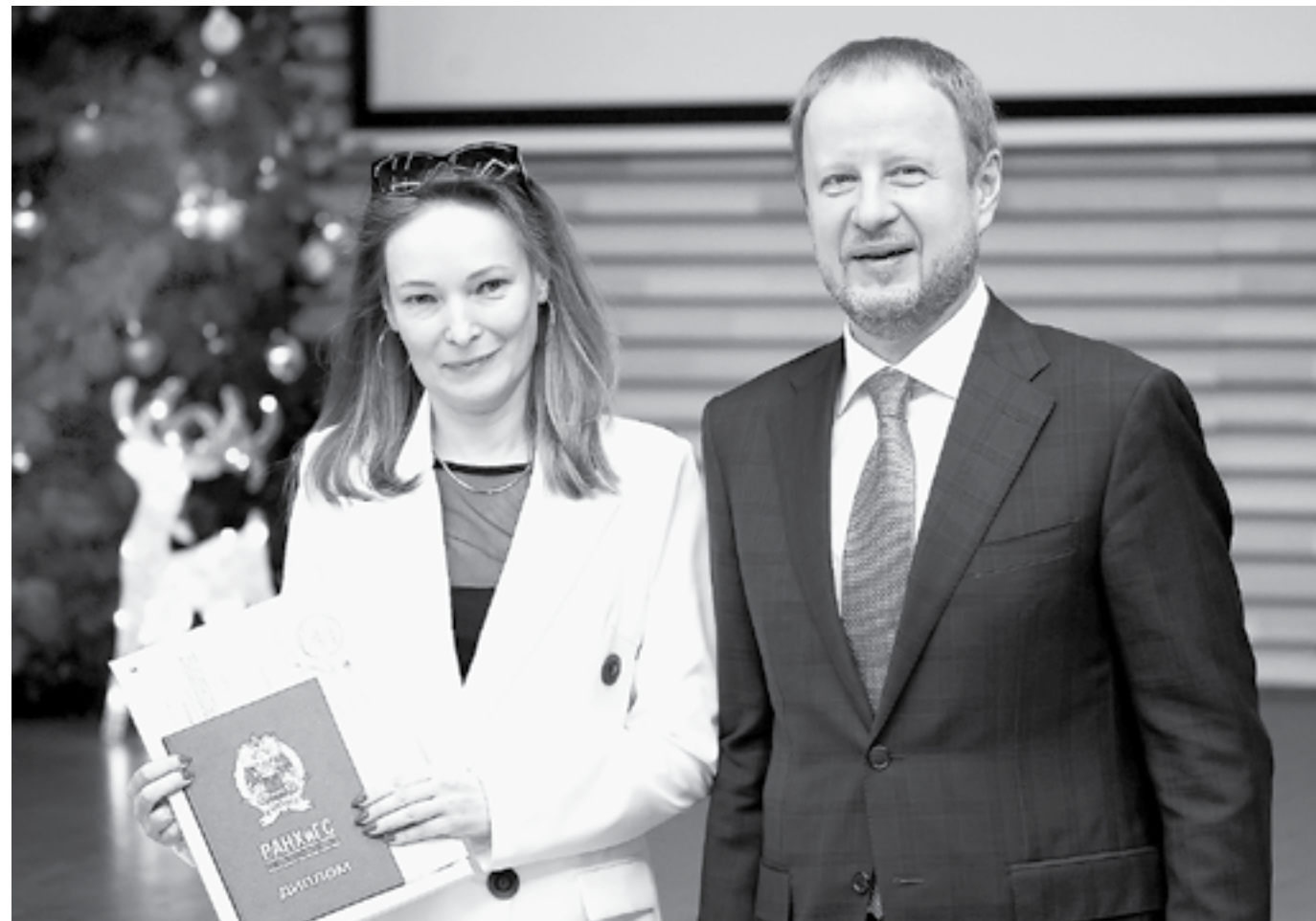
Курсы для предпринимателей проводятся более 10 лет.