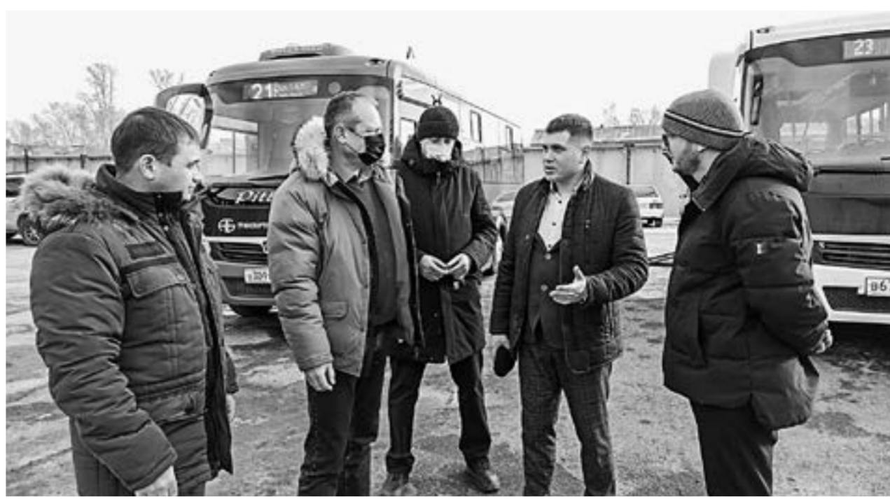
Комиссионная приемка автобусов.

Легкое движение руки, шипенье пневматической подвески – и пандус опускается на землю, предоставляя возможность инвалидам заехать в автобус на коляске.