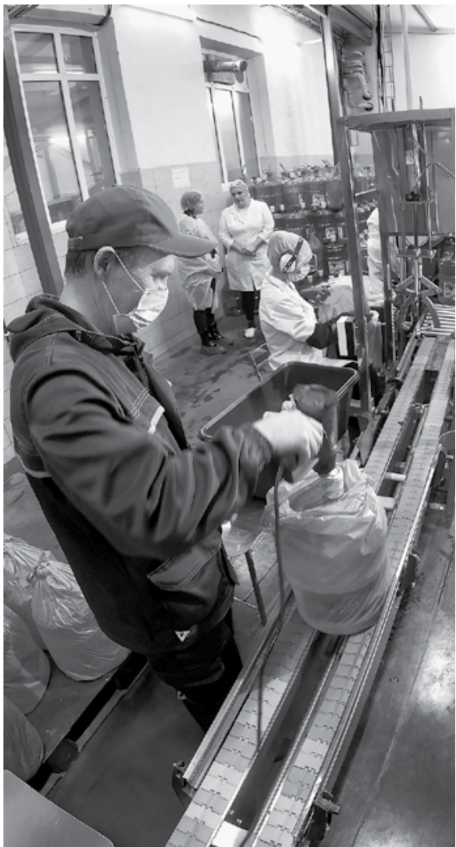
Артезианская вода добывается из скважин, расположенных на территории завода.

Пивобезалкогольный комбинат (ПБК) «Шульгинский» – одно из крупнейших предприятий Советского района. Недавно продукция комбината вошла в сотню лучших товаров России, став дипломантом одноименного конкурса в номинации «Продовольственные товары».