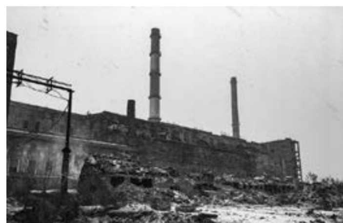
Начался демонтаж Рубцовской ТЭЦ.

На территории бывшего Алтайского тракторного завода практически не осталось следов от производственных корпусов промышленного гиганта советских времен.