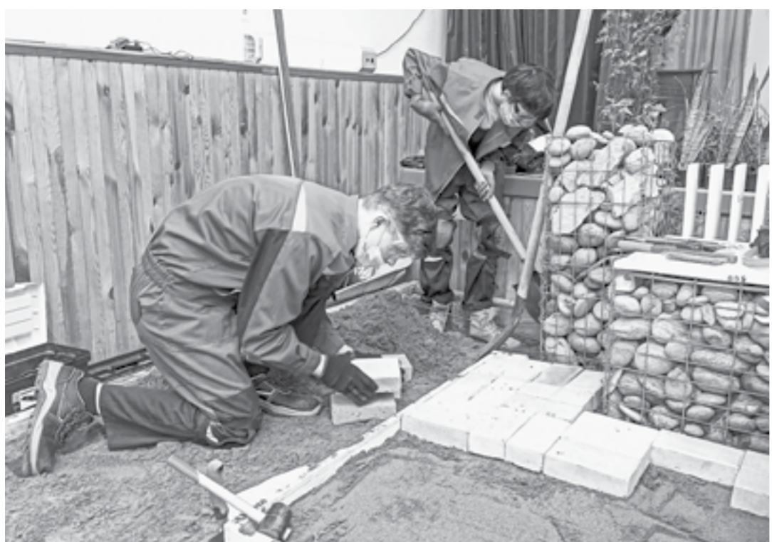
Кирпичик к кирпичику, лопатка к лопатке.