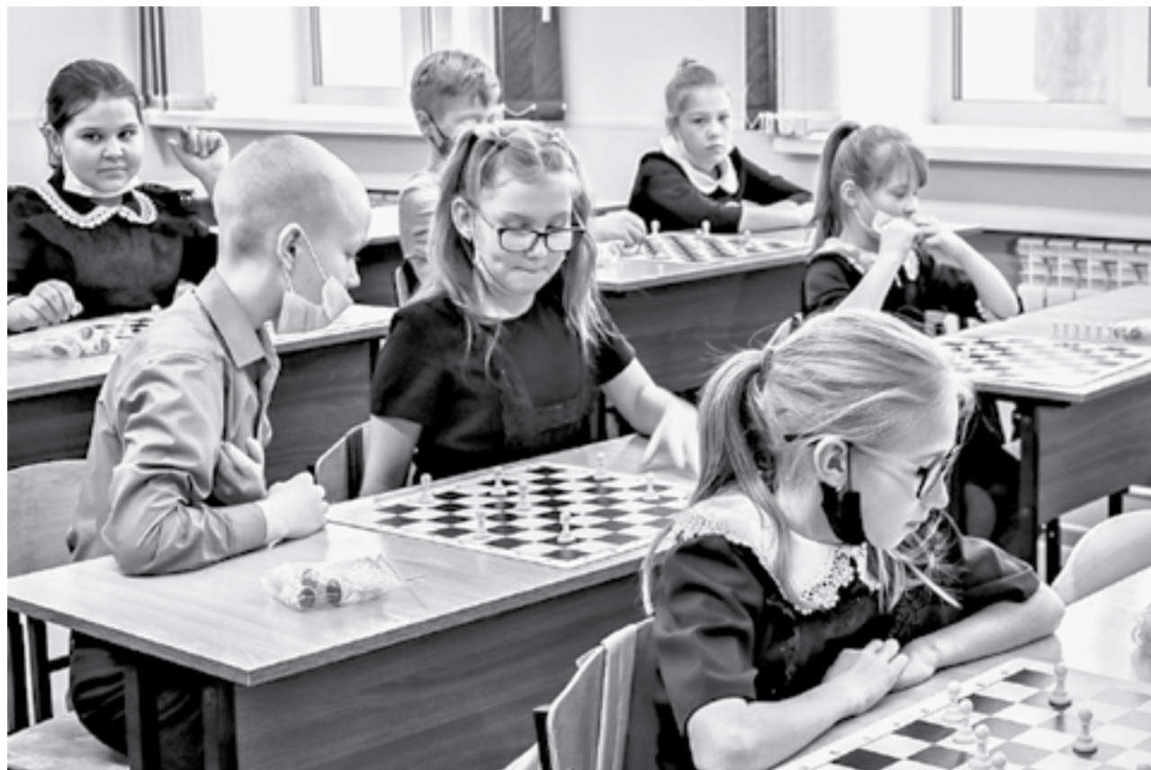
В Благовещенском районе создаются все условия для подрастающего поколения.

По словам главы Благовещенского района Андрея Гинца, в Леньках проживает более 3 тысяч человек, это треть по численности поселение в районе. В последние годы в развитие инфраструктуры села вложено немало собственных средств района и выделяемых краем. Починили по районной программе библиотеку,