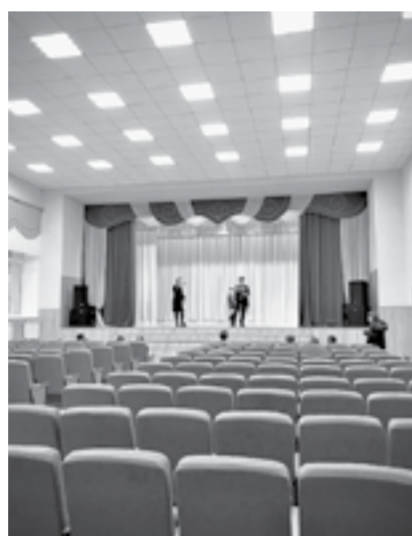
Обновленный зал ДК в с. Глядене.