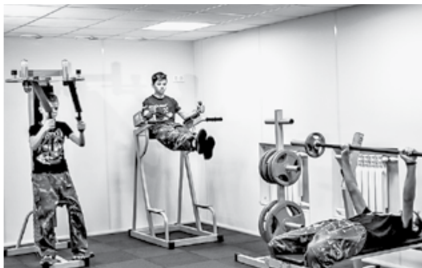
В тренажерном зале леньковской школы.

В ремонт школы вложили гораздо больше, чем положено по программе софинансирования. Сумма составила около 20 миллионов рублей. Это гораздо больше 5%, требуемых по краевой программе от района.