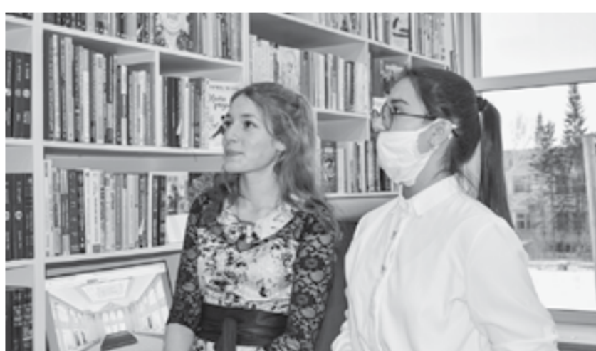
Читатели у книжных полок.