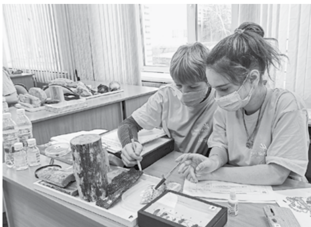
Точность – вежливость лесника.