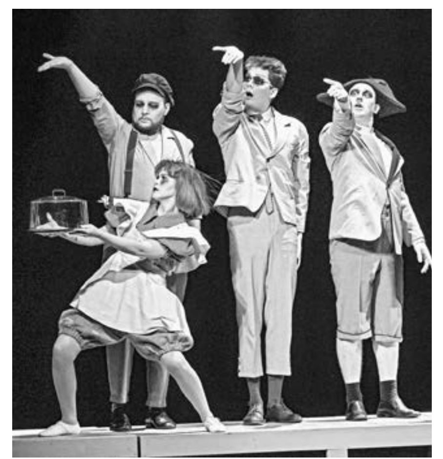
Фрагмент спектакля «Жар и холод, или Идея господина Дома».