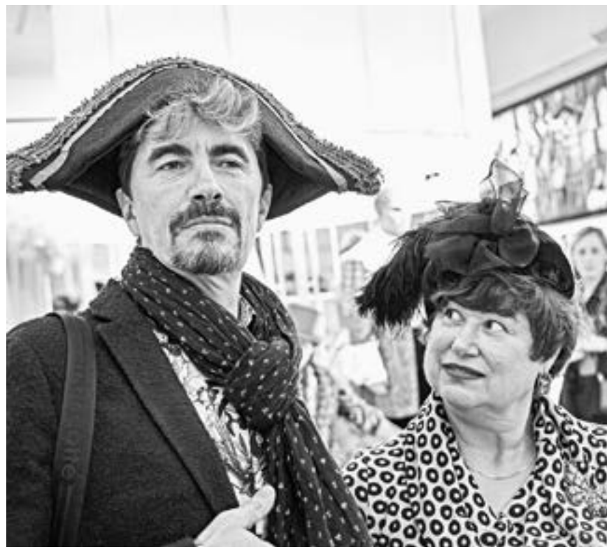
На выставке к 100-летию драмы.

Кстати, в день столетия театр получил поздравительную телеграмму от президента Владимира Путина. В ней, в частности, говорится: «Созданный в Барнауле