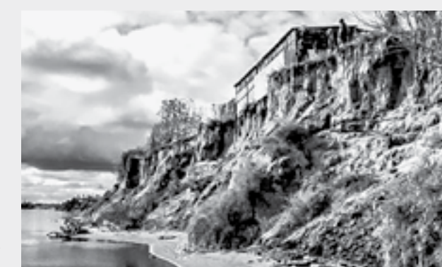
В зоне риска – более трех десятков строений.

В прибрежной зоне города вода захватывает полосу