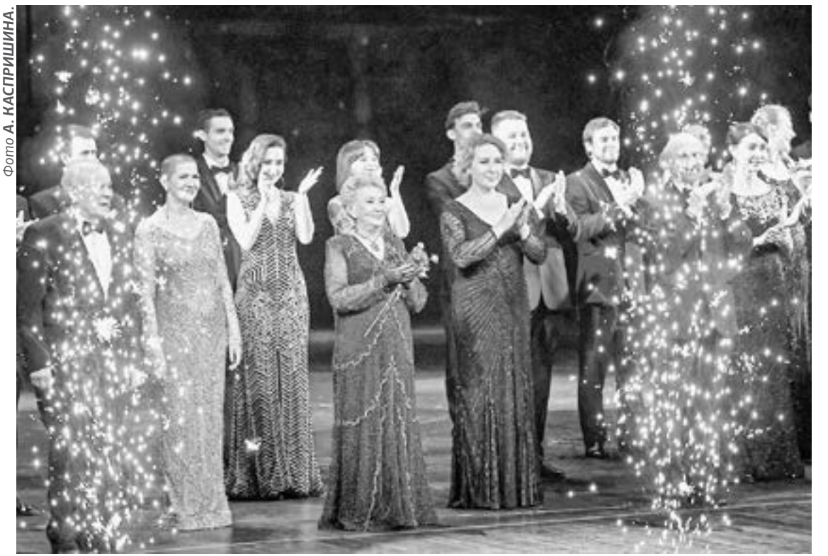
В этот день артисты театра принимали поздравления и награды и блистали в любимых ролях.

в 1921 году, ваш театр объединил на своей сценической площадке яркие творческие силы, стал крупным культурным, просветительским центром Сибири. Здесь всегда царит атмосфера