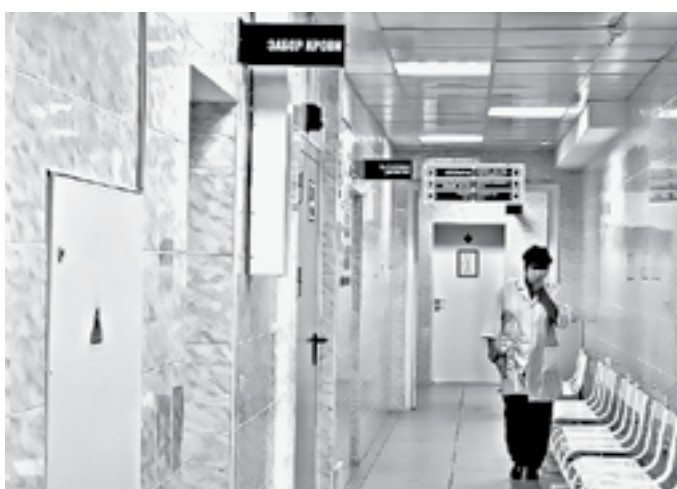
Коридоры стали светлыми.