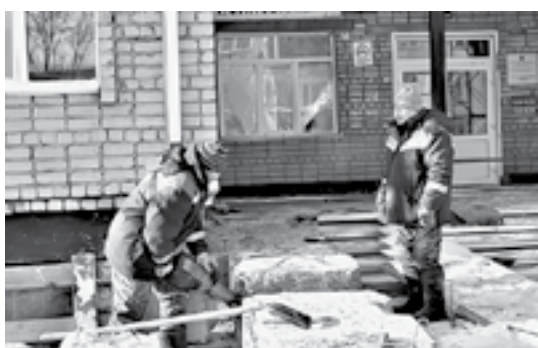
Идет обустройство центрального входа.

Первая половина здания должна быть отремонтирована до конца текущего года, вторую планируют сдать в марте-апреле следующего. Ре-