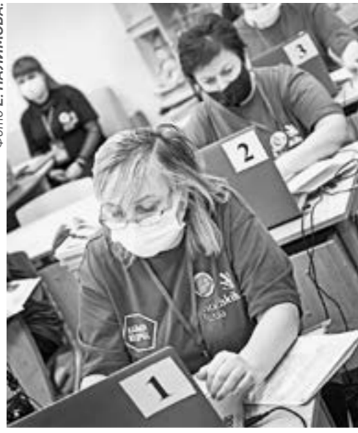
На WorldSkills трудно даже стажистам.

Важный нюанс: из-за пандемии участники были вынуждены демонстрировать свое