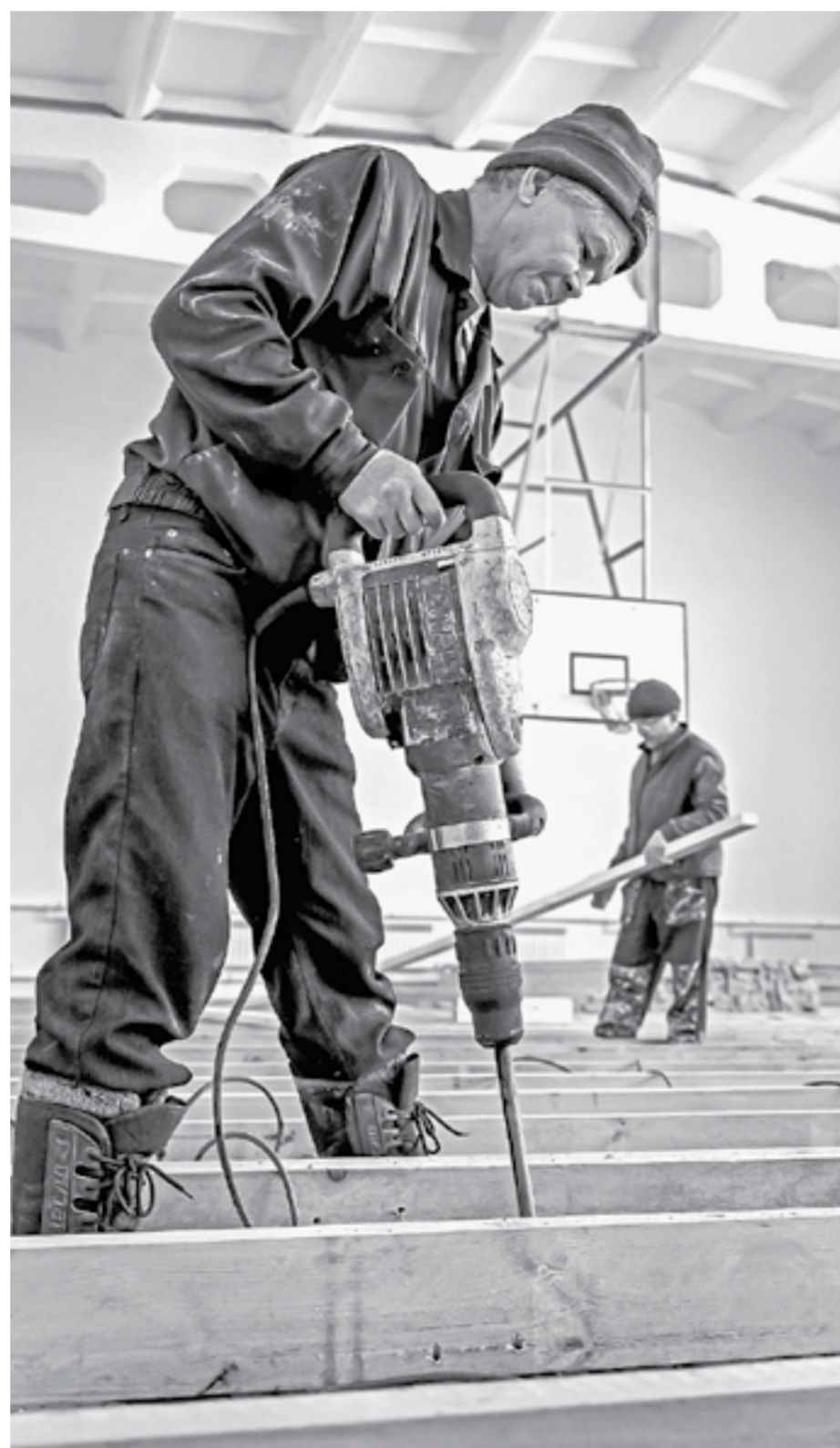
Строительная бригада заканчивает ремонт спортзала.