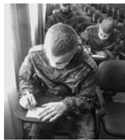
Письма мамам из Сибирского.

К новому молокопроводу купили и новые современные доильные аппараты. За счет того, что не нужно таскать бидоны с молоком, у доярок появилась возможность работать не двумя, а тремя аппаратами. Количе-