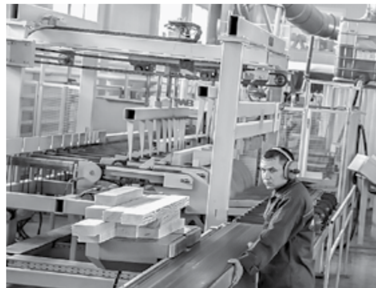
С учетом повышающих коэффициентов размер минимальной заработной платы составит более 19 тысяч рублей.