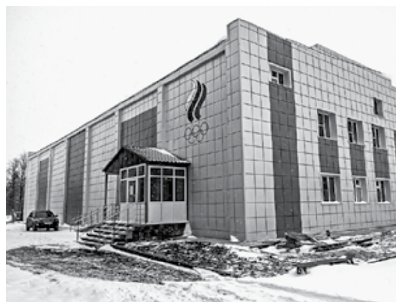
Обновленный районный спортивный комплекс.

В селе Топчиха в рамках краевой адресной инвестиционной программы заканчивается капитальный ремонт спортивного комплекса.