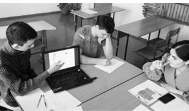
Ученики Рубцовского района предлагают переобустройство в школе.