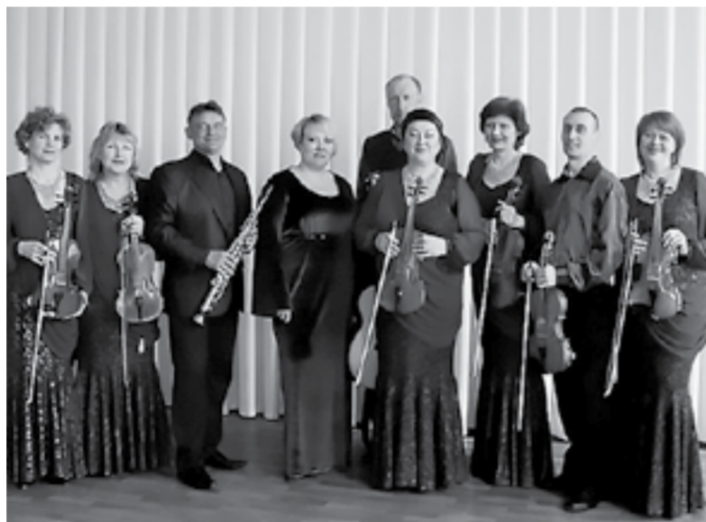
Ансамбль «Элегия» удостоен нескольких дипломов фестиваля.

Совет женщин Рубцовска провел первый в Алтайском крае фестиваль женского самодельного творчества. В нем приняли участие около 300 человек.