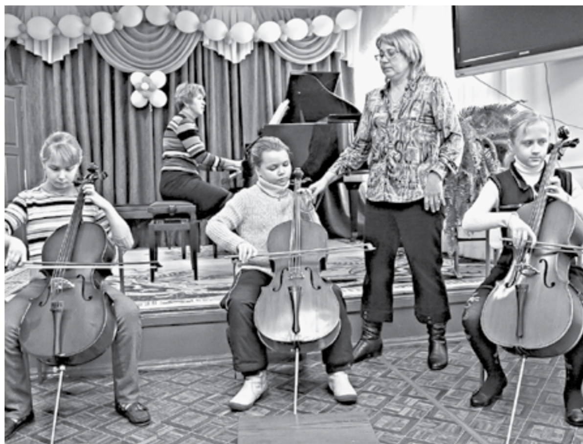
Почти миллиард рублей направят на повышение зарплат бюджетников в Алтайском крае.

ние было направлено около 130 поправок на общую сумму более 8 млрд рублей.