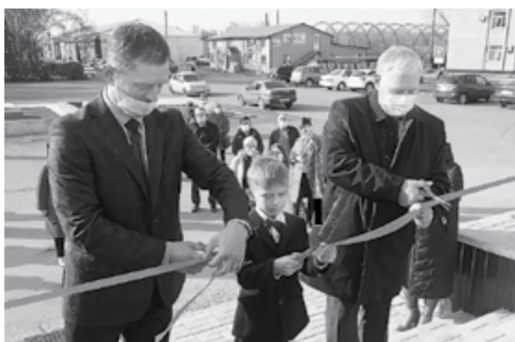
В этом году работы по строительству, реконструкции и напиремнту велись на 39 объектах.

Если выбирать из «не работать вообще» и «работать на 50 процентов заполняемости», то второе – это благо. Потому что деятели культуры имеют возможность встречаться со зрителем. Понимая, что в этом году тенденция ограничений продолжится, мы скорректировали госзадание с учетом этих обстоятельств. Возврата бюджета из-за невыполнения госзадания не прогнозируем: все деньги, которые выделяются