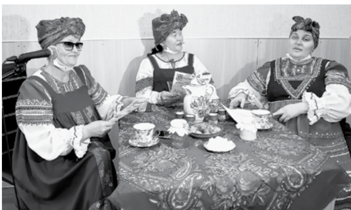
Народной культуре всегда уделялось внимание.

В следующем году предполагается выделить 900 млн рублей на объекты культуры, объем федерального финансирования не сокращен. Уже запланировано, на какие объекты будут потрачены федеральные средства – проведены конкурсы.