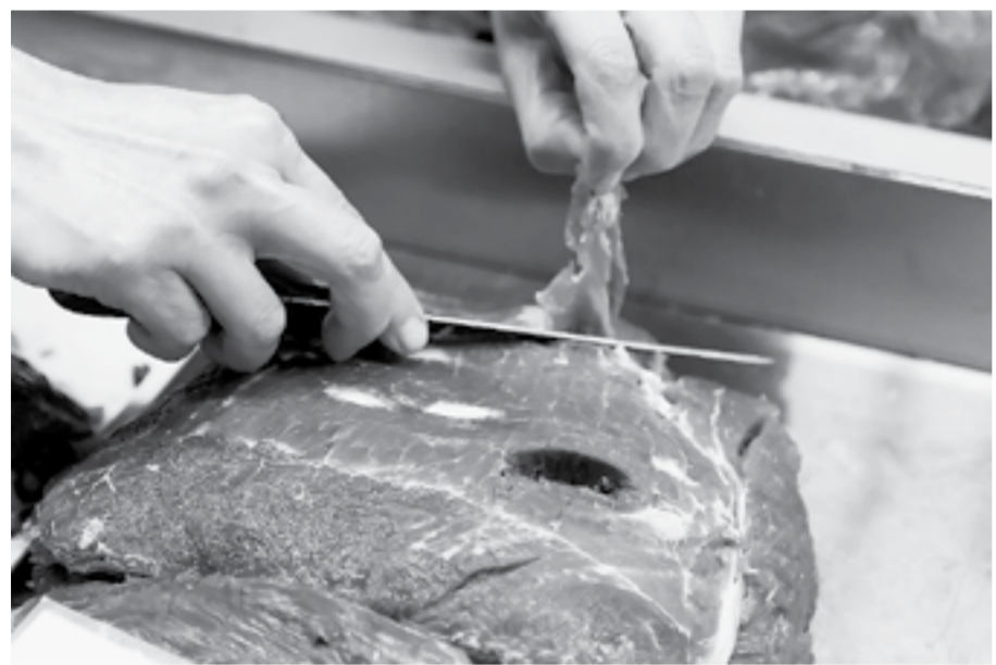
Лакомый кусочек «крестьянского» мяса.