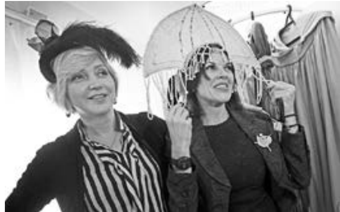
Выставка интерактивная, так что экспонаты можно открывать, листать, слушать и даже примерять.

Концепцию выставки «100 лет в настоящем» создали сотрудники Государственного музея истории литературы, искусства и культуры Алтайя, а дизайнеры архитектурного бюро MDVA придали ей неожиданную форму, преобразив зрительское фойе второго этажа. Историю алтайской драмы представили в виде девяти блоков, или комплексов, посвященных различным театральным профессиям.