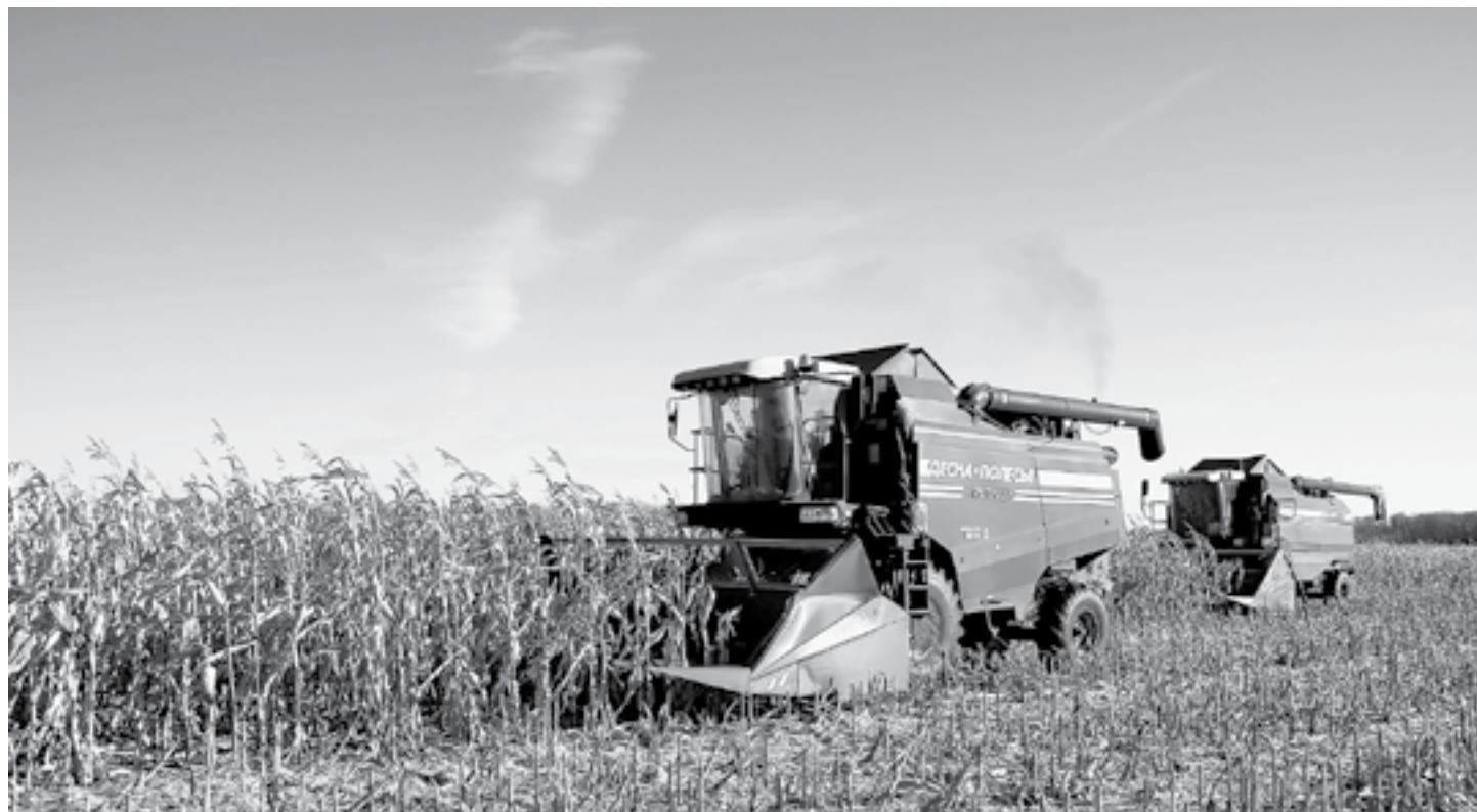
Кукуруза при наличии своих сушилок выгодная культура.

В этом году в Каменском районе собрали близкий к рекордному урожай. С каждого гектара взяли по 21,2 центнера зерновых и зернобобовых.