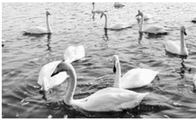
Красота и грация.