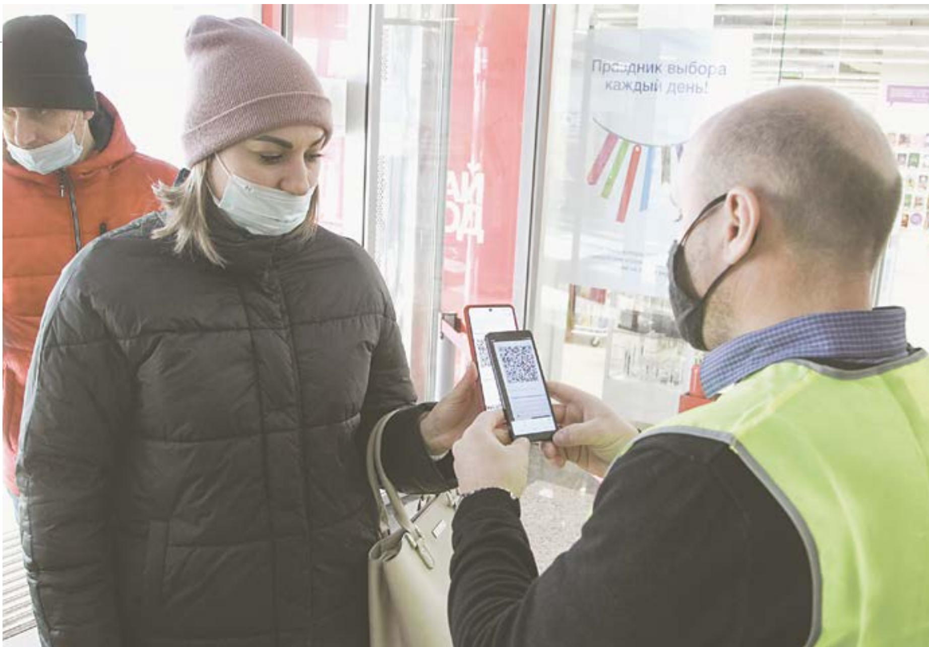
Любишь кататься – люби и QR-код с собой носить.