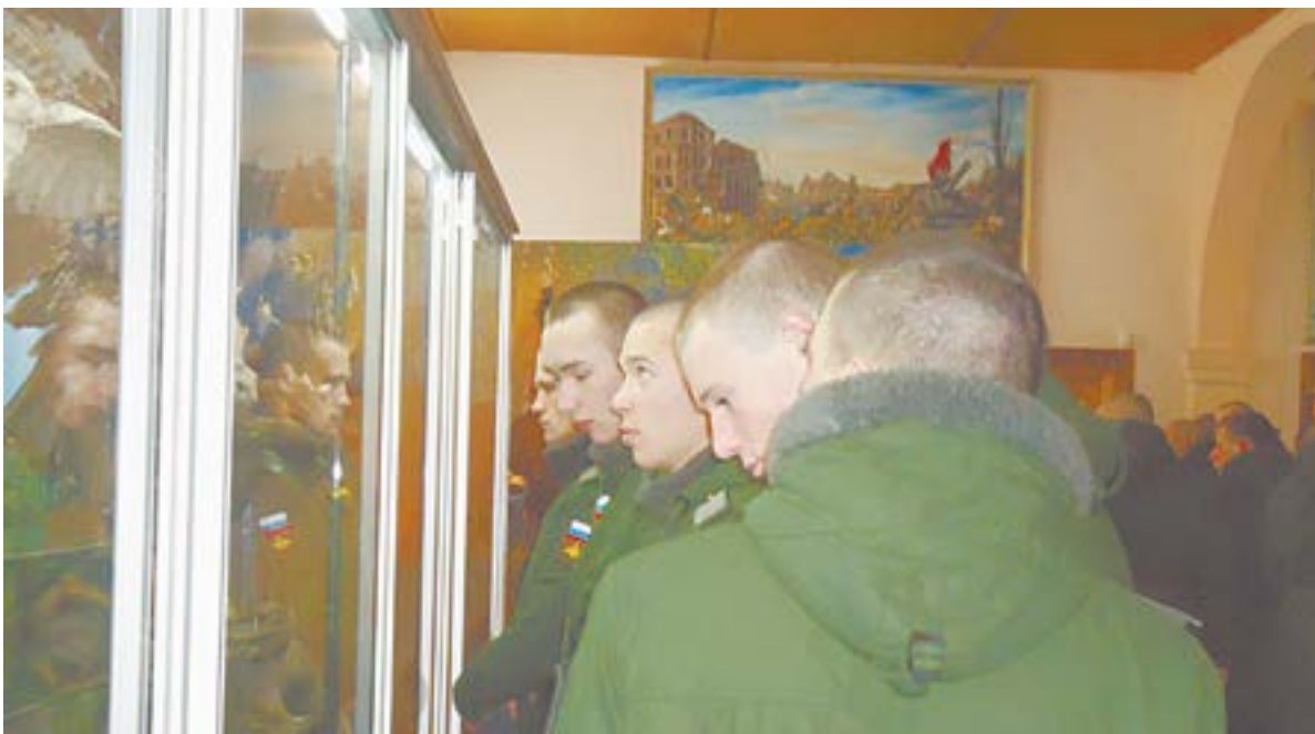
Воины мотострелковой бригады на экскурсии в музее.