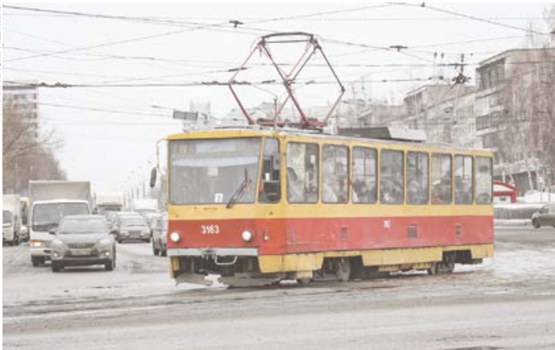
Новая маршрутная сеть Барнаула будет вынесена на общественное обсуждение.

вод на ул. Кулагина, с переходом через железную дорогу.