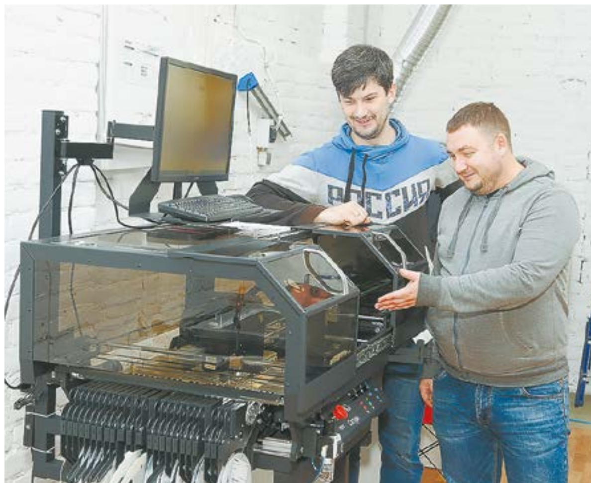
Некоторые изделия печатаются на 3D-принтере.

фары в зависимости от поставленных задач. Главное – соответствовать международным правилам. А дальше – фантазия и потребности заказчика, – объясняет главный конструктор. – Некоторые клиенты обращаются с одной лишь целью – сделать максимально дешевую светодиодную фару. Она должна в разы превосходить ламповое освещение, но при этом укладываться в относительно небольшой бюджет.