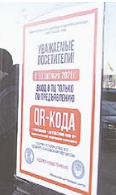
Привыкаем к новым реалиям.

– Никаких требований от арендодателя нам не поступало. Обслуживаем всех, кто приходит, ведь их