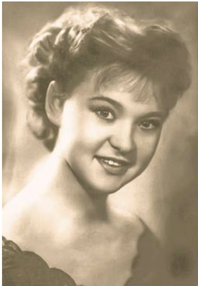
После «Карнавальной ночи» она прослушалась знаменитой.