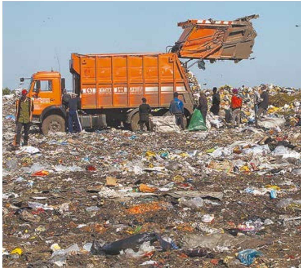
Барнаульский полигон поработает еще несколько лет.

Мусоросортировочный комплекс будет расположен на расстоянии 3 км от поселка Нового Берёзовского сельсовета Первомайского района. По словам инвестора, этот участок полностью соответствует всем требованиям действующего законодательства. Расстояние от полигона до населенного пункта составляет 2636 метров при норме полкилометра. Объект не затрагивает ничьих прав.