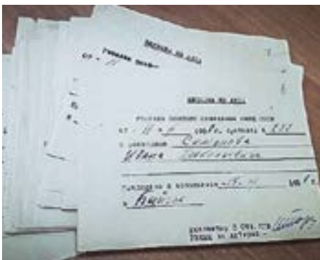
54 страшных документа.

3-д «Парижская коммуна», Зав. радиоузлом. Арестован 23 февраля 1933 г. Приговорен: ОС при Кол. ОГПУ 28 мая 1933 г., обв.: 58-10, 58-11. Приговор: ссылка в Зап. Сиб. На 3 г. Реабилитирован 26 апреля 1989 г. Указ от 16.01.1989. Источник: Книга памяти Ярославской обл.