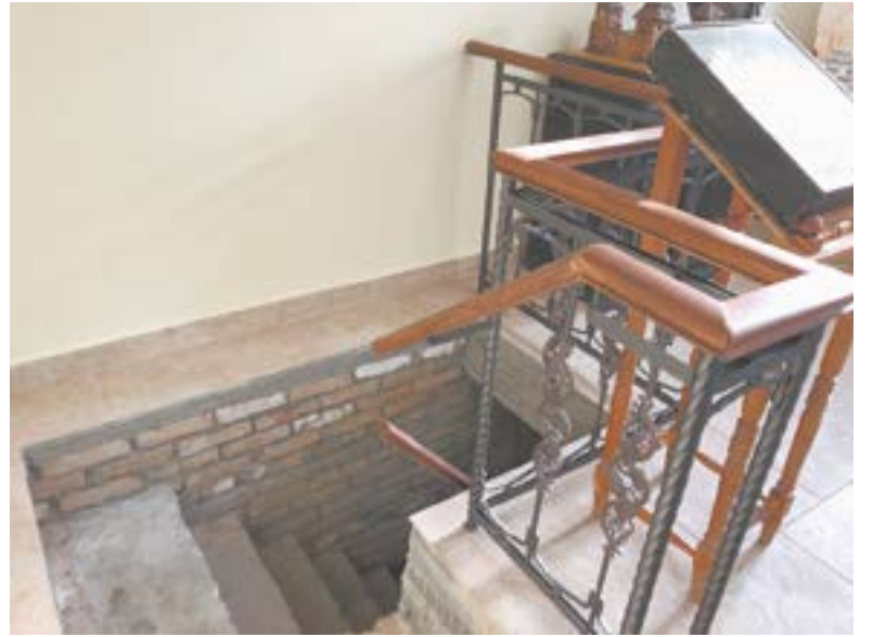
Вход в полуподвальное помещение.