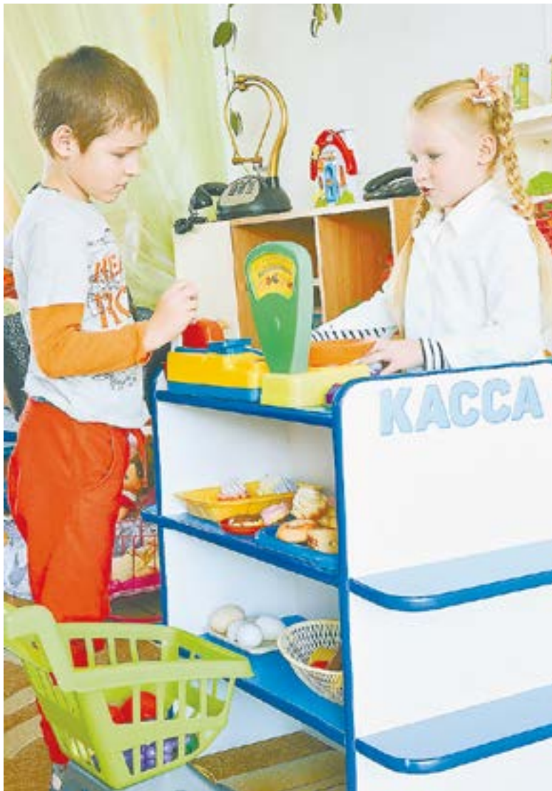
Первые житейские навыки приобретаются через игру.

тишки с более серьезными диагнозами. А дети подражают тем, кто находится рядом с ними. Здесь же перед глазами пример обыкновенных детей. Это очень большой плюс. За три года улучшилась речь ребенка, – отмечает мама.