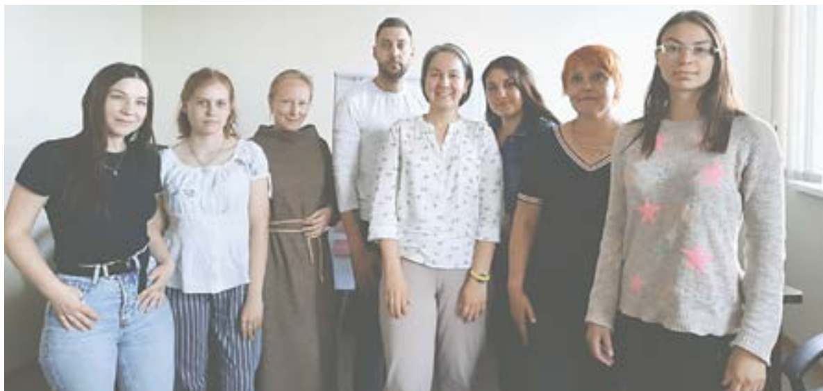
Волонтеры проекта «Наставничество».