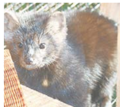
Соболь – зверь любопытный.