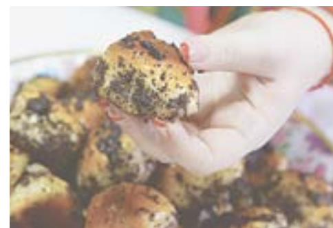
Пампушка с маном.