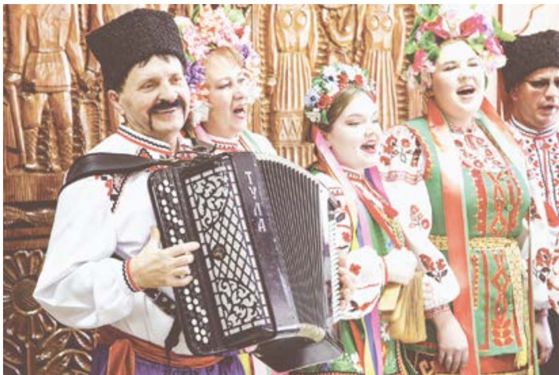
Алтай поет на разных языках.