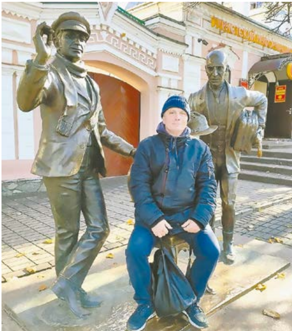
Памятник Остапу Бендеру и Кисе Воробьянинову.

Приятные впечатления можно запить знаменитым чебоксарским пивом, закусив круглыми шартанчиками – национальным блюдом, запеченной бараниной и кусочками желудка.