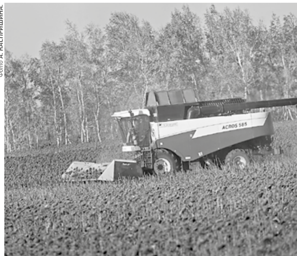
Идет обмолот подсолнечника.