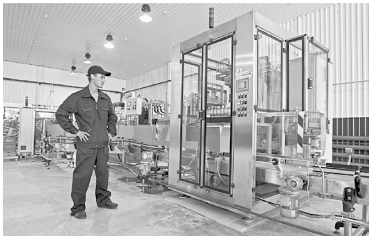
Объемы экспорта подсолнечного масла несколько уменьшились, зато выросли поставки масла рапсового.