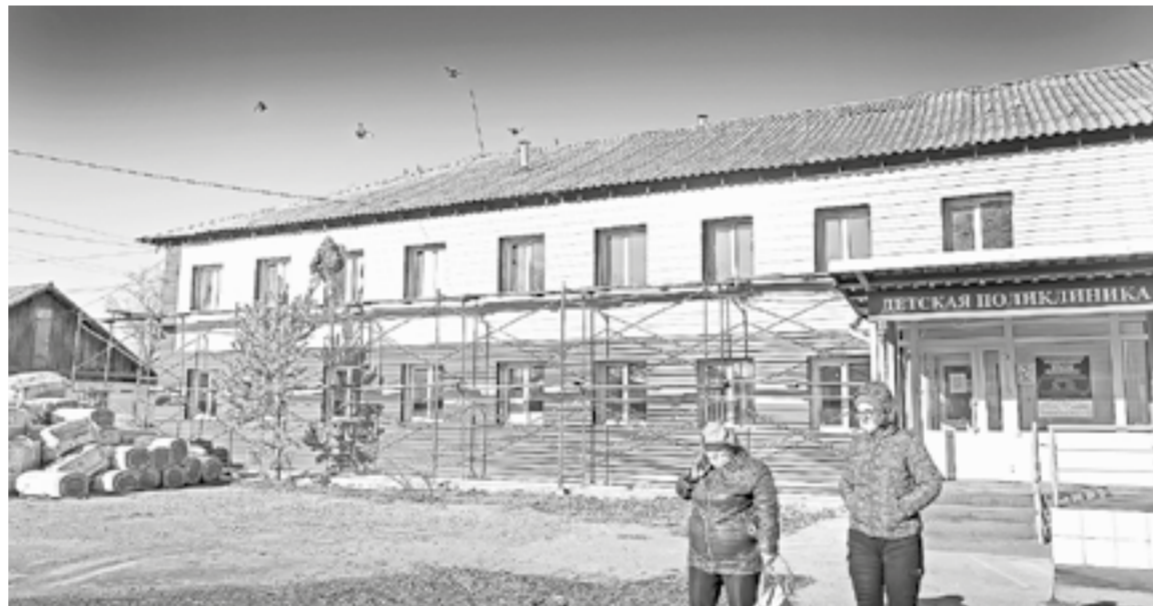
Детская поликлиника преобразуется внутри и снаружи.