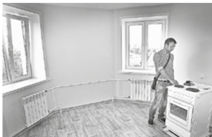
В 2022 году на обеспечение сирот жильем только из краевого бюджета планируется направить 325 млн рублей.

В феврале текущего года в качестве альтернативы Алтайский край одним из первых в Сибири федеральном округе ввел жилищные сертификаты для сирот. На выплату могли рассчитывать молодые люди при достижении возраста 23 лет, имеющие на руках решение суда о предоставлении жилья, вступившее в силу