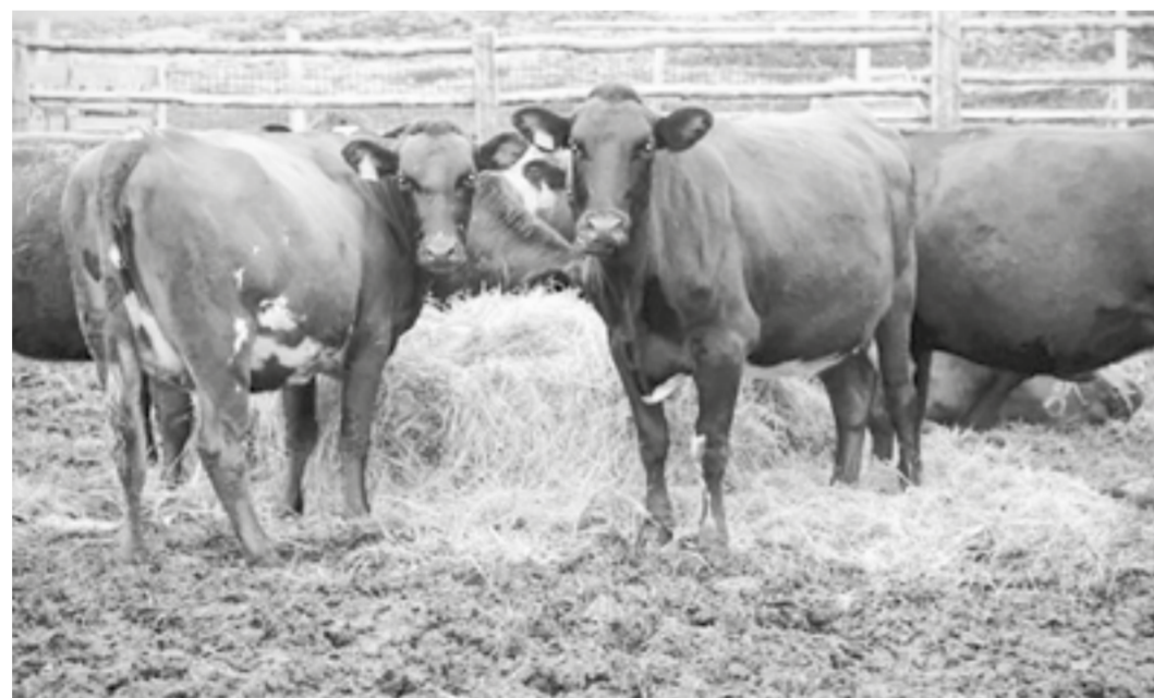
Каждая корова – на учете.