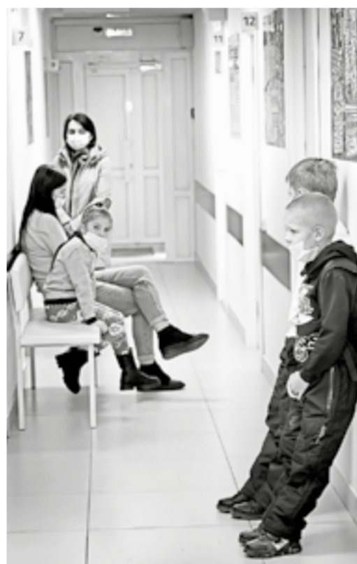
Маленькие пациенты пришли в врачу.