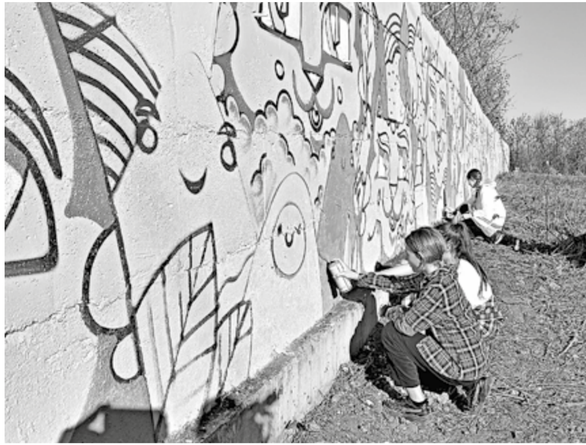
В городе появилось несколько сотен котов.