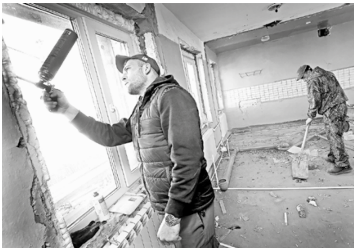
На ремонт закончат в декабре.