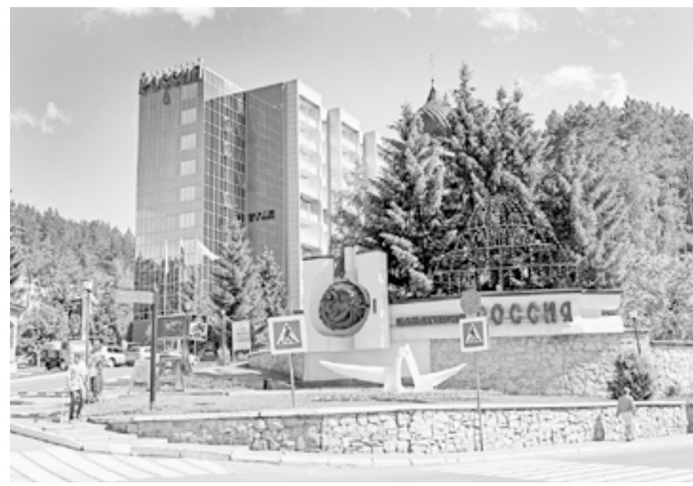
Средства от курортного сбора идут на благоустройство инфраструктуры.

С начала текущего года в бюджет Алтайского края поступило около 22 миллионов рублей курортного сбора. Всего с начала его введения было собрано 106,7 миллиона. Полученные в 2021 году средства направлены на текущее содержание инфраструктуры Белокурихи.