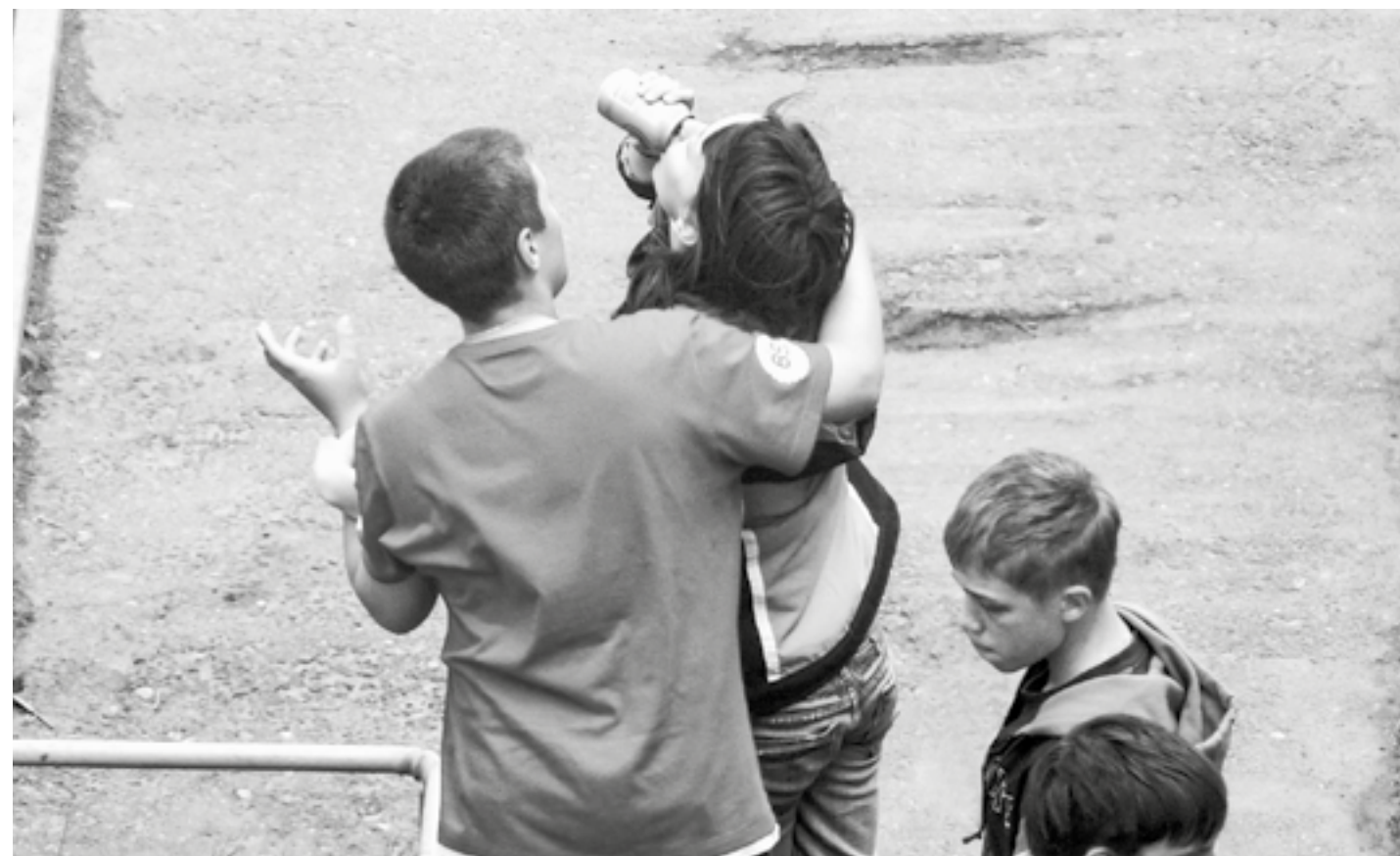
Чрезмерное употребление энергетиков подрывает детское здоровье.

Инициаторы законопроекта пояснили, что содержание кофеина в энергетиках обычно составляет верхний допустимый суточный уро-