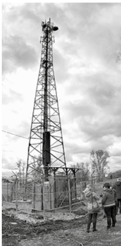
Вышки сотовой связи – показатель нового качества жизни.

– У меня дети живут в городе. Осенью и весной с ними иногда удавалось созваниваться: в некоторых уголках села хоть и слабо, но ловит один из сотовых операторов. А летом, когда деревья распускаются, из-за листьев сигнал переставал до нас доходить. Зимой здесь все