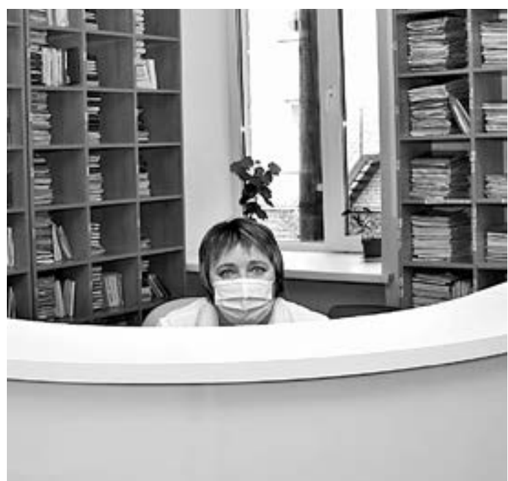
ЦРБ обслуживает 2560 детей.