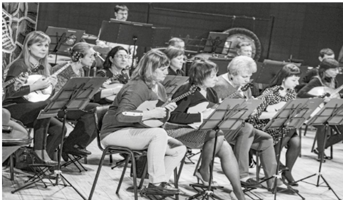
Музыку алтайских композиторов исполняют «Сибирь» (на фото), симфонический оркестр, Барнаульский академический хор им. А. Б. Тарнецкого и солисты.