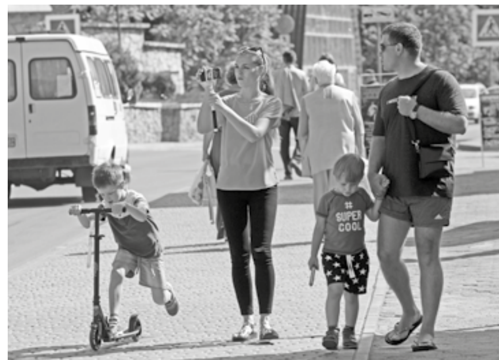
Желающих отдохнуть в Белокурихе заметно прибавилось.

В курортной зоне провели ремонт уличного освещения, благоустроили санитарные зоны терренкуров имени Николая Бреславского («Белокуриха горная») и «Старая мельница».