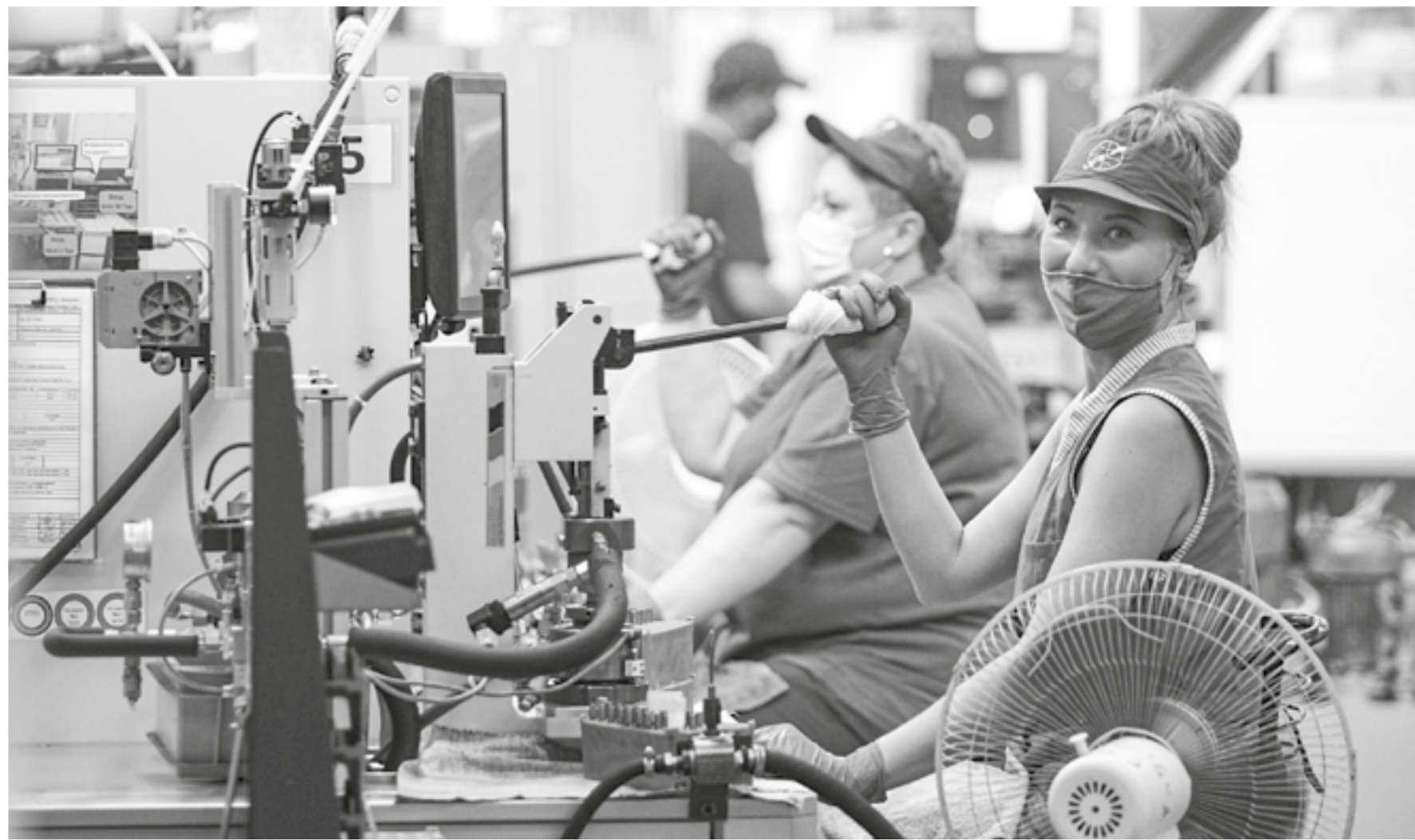
Везде требуется молодежь.

Исходя из опыта главы предприятия, чтобы получить толкового