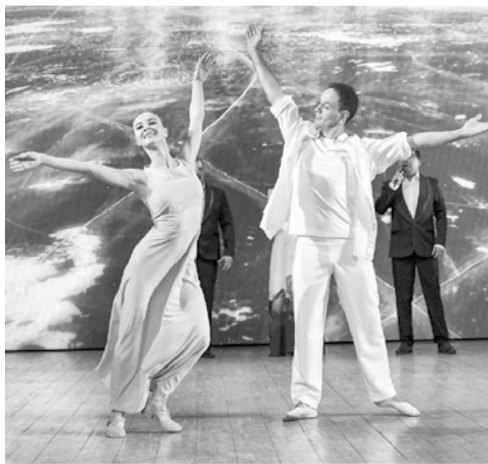
«Алтай» танцует в честь победителей.

за добросовестный труд, любовь к профессии и за то, что делится своим бесценным опытом», – говорится в приветственном слове губернатора Алтайского края Виктора Томенко.