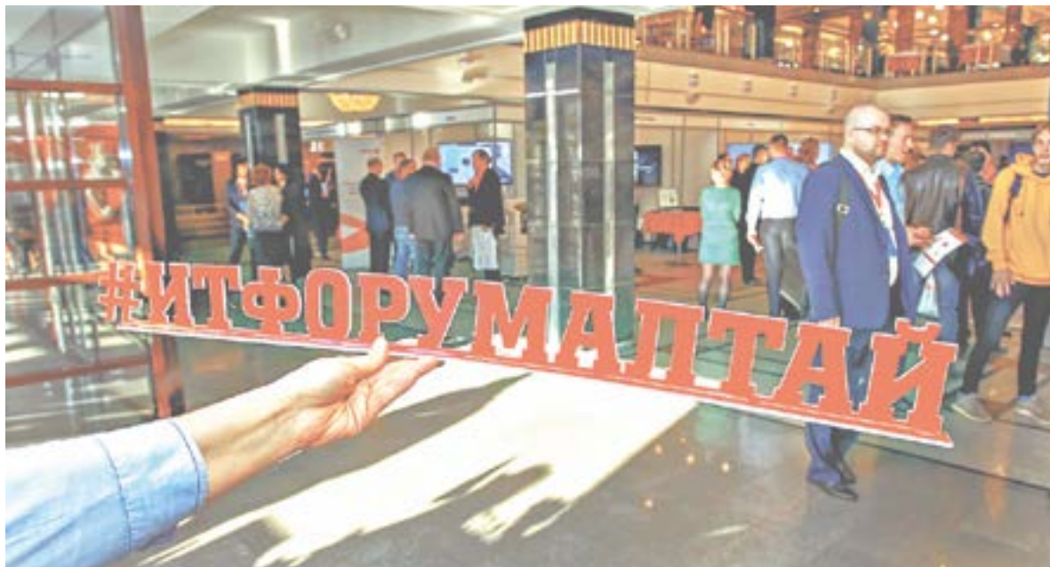
Алтайский IT-форум – авторитетная площадка для обсуждения проблем отрасли.

– Государственным услугам необходимо окончательно перейти в электронный вид. Также должны появиться механизмы многократного использования информации. Все паспортные данные, декларации и отчеты нужно вносить в базу один раз, хранить их в реестре и