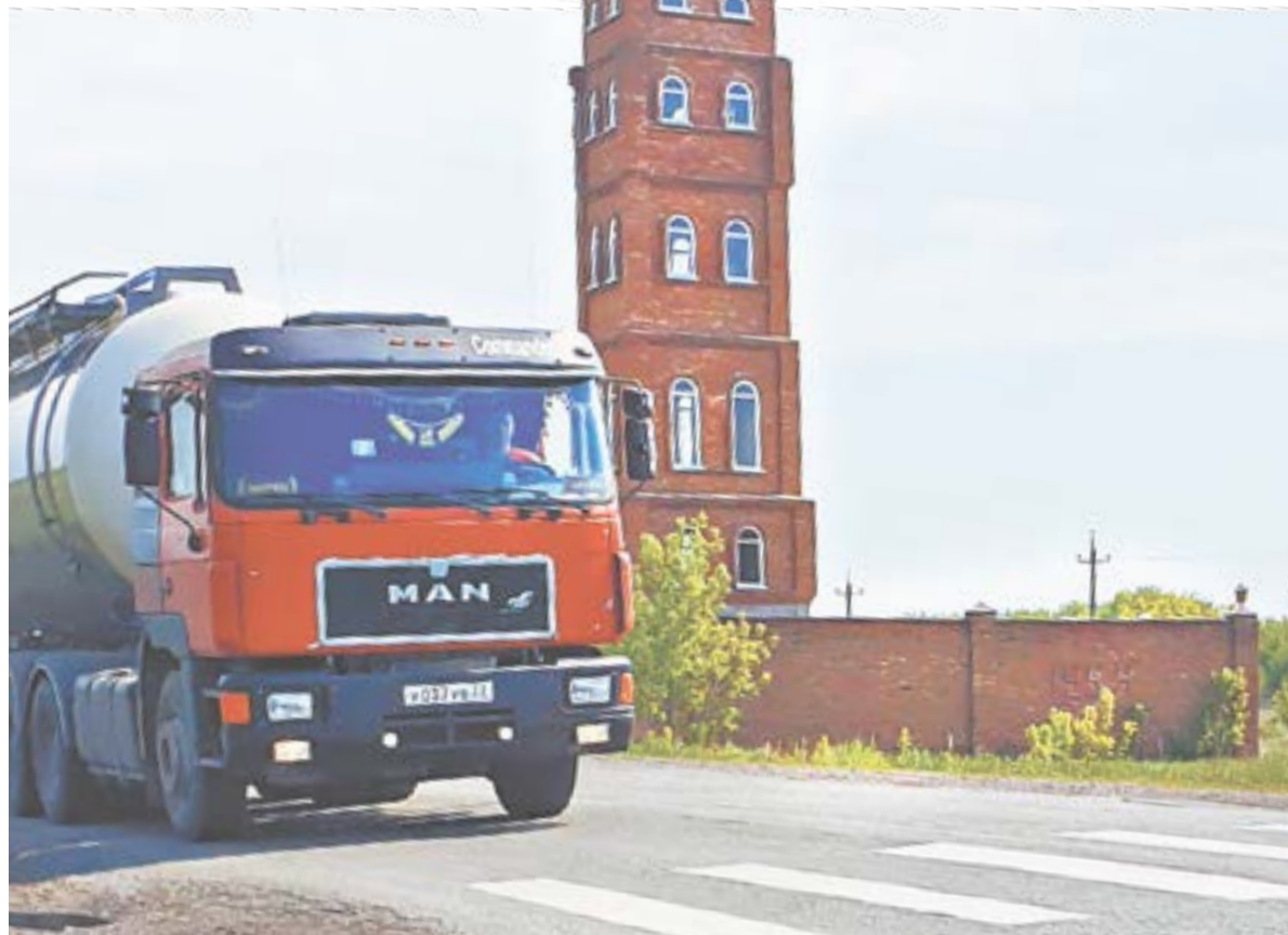
Сельская архитектура Павловского района.