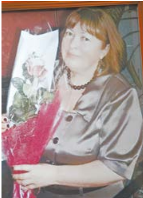
Человек, которого не забудут.