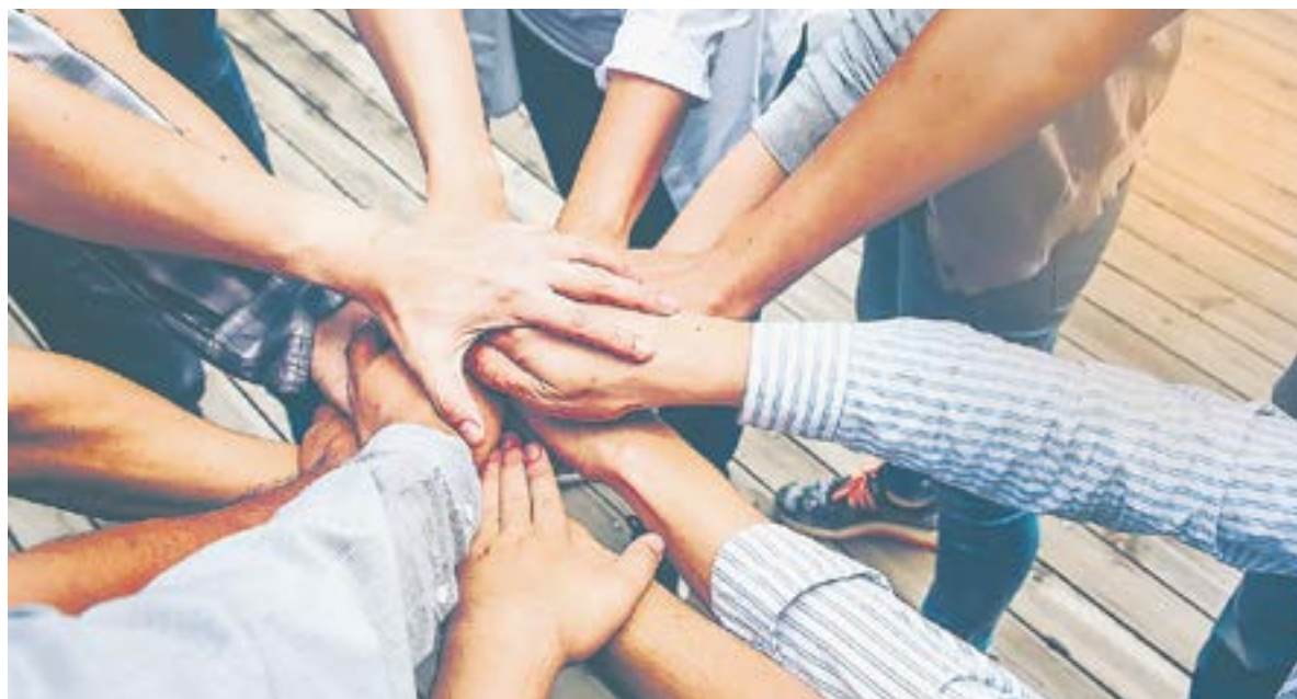
Главное – искреннее желание изменить свою жизнь.

– Нет, этот путь непрост. Я пришел сюда, когда уже фактически погибал. В АА наставники помогают людям, решившим порвать с алкоголем. Здесь у каждого своя группа, своя зона ответственности. Пока проходишь программу «Двенадцать шагов», словно перерождаешься. Я не пью второй год и спокойно прохожу в магазинах мимо полок с алкоголем. То, что пожирало меня 18 лет, теперь просто не интересует. Мне доверили работу с новичками. Вообще-то, мы говорим – служение. Для нас это благодарность наставникам за спасение. Мы стараемся возместить то зло, что причинили своим близким. Вернуть долги. Попросить прощения у тех, кого обидели.