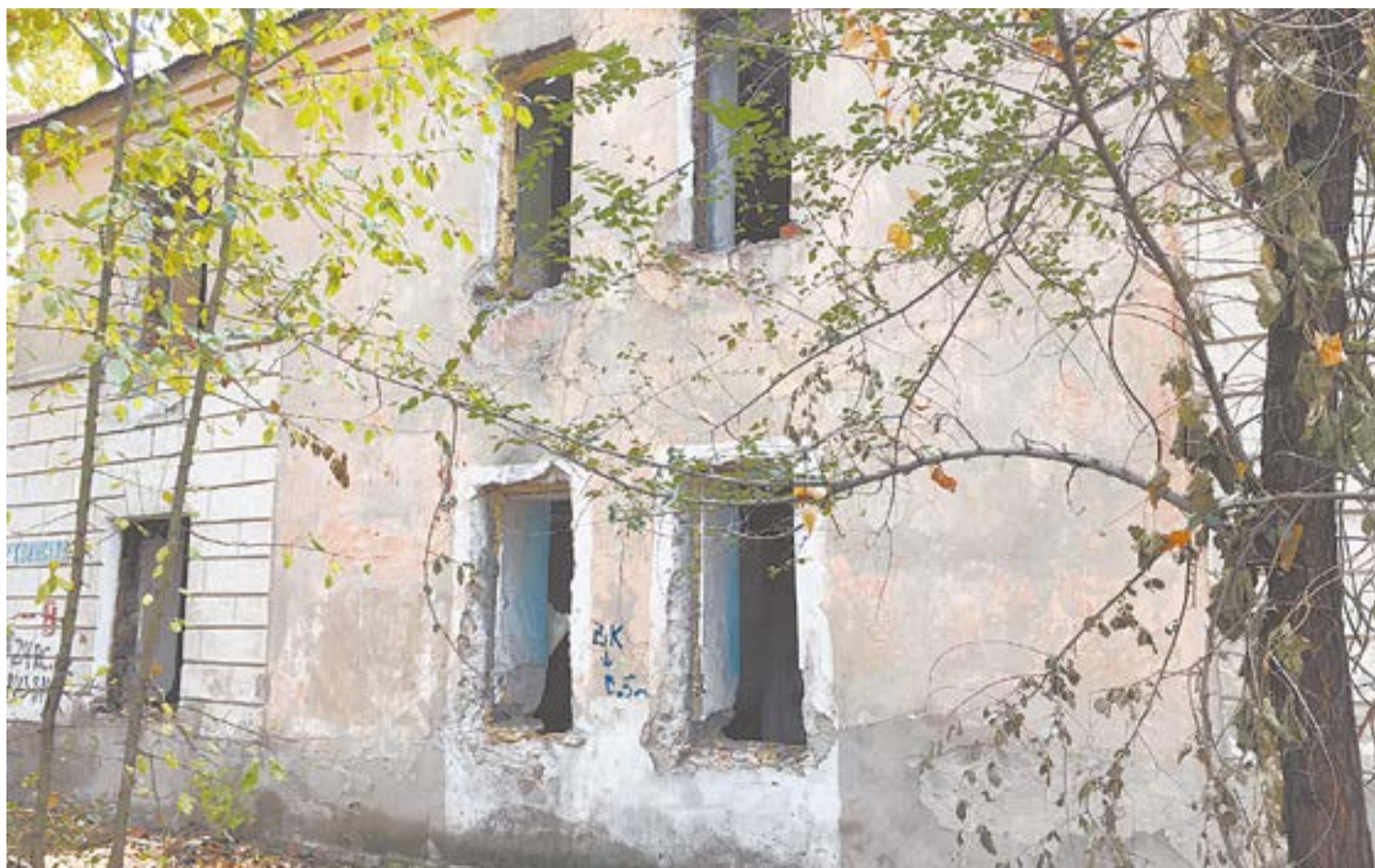
Дом снесут, а участок зарастет бурьяном.

Площадок под строительство МКД хватает. Ветхие строения потихоньку сносятся. Там остаются коммуникации: водопровод,