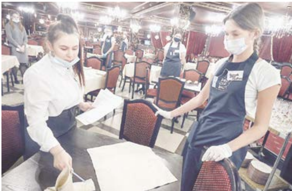
Жюри оценивает подачу салфеток.

В Барнауле проходит традиционный конкурс профессионального мастерства среди студенческих отрядов Алтайского края. В состязании принимают участие представители строительных, педагогических, сервисных, а также бойцы отрядов проводников.