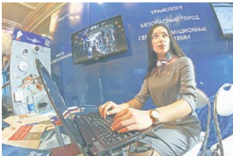
Сформировать клиентскую базу поможет компьютерная программа.

при необходимости пользоваться. Для решения вышеперечисленных задач разрабатывается экосистема «Единое цифровое окно», которая позволит уменьшить бюрократическую составляющую в ведении бизнеса, – добавил Зрюмов.