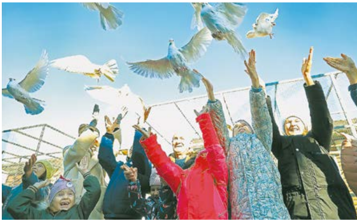
Салют, от которого ни дыма, ни шума, – голубиный.

Но самые ценные из них – алтайские. У них сформировавшийся хохол, который переходит в гриву.