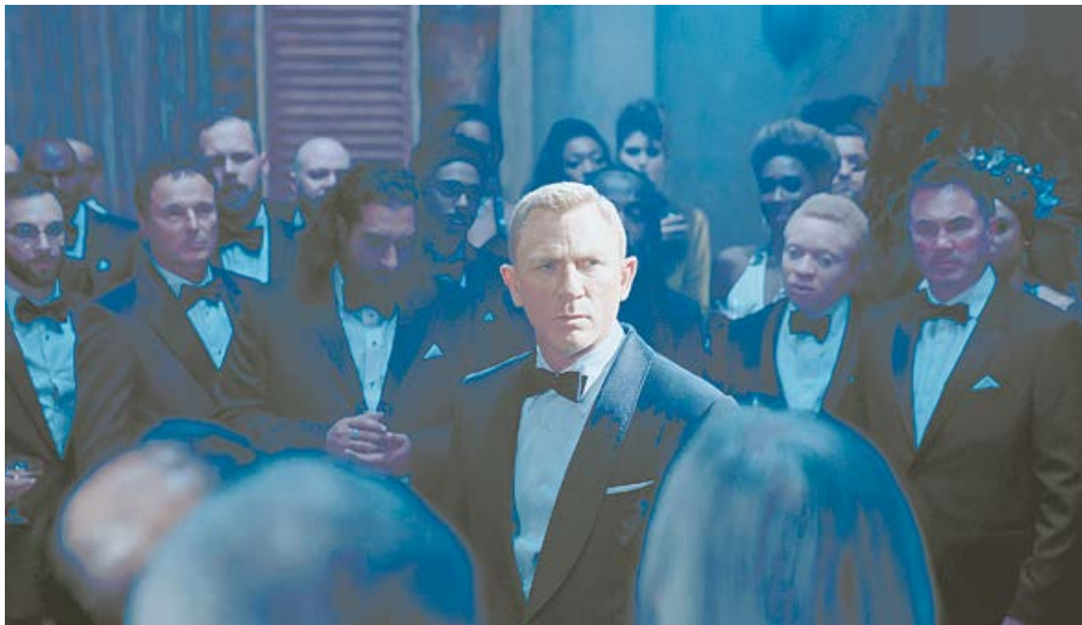
Фильм «Не время умирать» подводит итог 15-летней эпохе Дэниела Крейга в роли Бонда.

Бывшее начальство подсылает к командеру эффектную темнокожую девушку Номи (Лашана Линч) с шокирующим известием, что она и есть теперь новый агент 007, и настоятельной просьбой не лезть в это дело, но он, конечно, не слушает. Однако короткая вылазка на Кубу приносит странные результаты: ученый Обручев и правда будет похищен, только не ЦРУ и не MI-6, а таинственным преступником с экзотическим именем Люцифер Сафин и соответствующими манерами (Рами Малек). И чтобы в очередной раз предотвратить рукотворный апокалипсис, Бонду