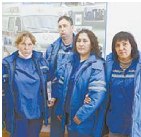
Медикам подстанции очень не хватает коллеги, друга и помощницы.