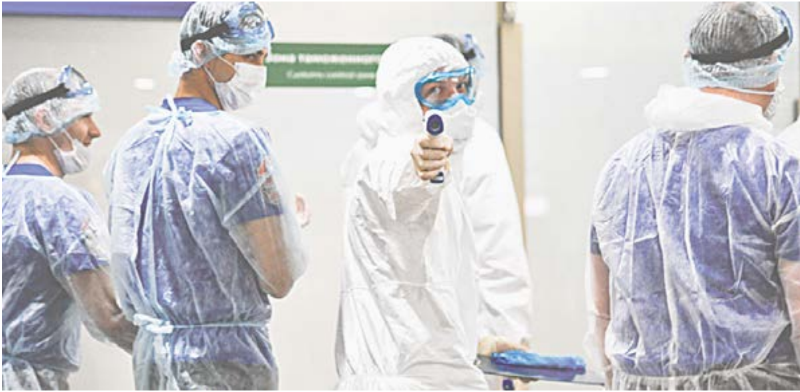
А ты привился от ковида?

Пресловутая четвертая волна коронавируса – как пир во время чумы. Люди ездят в переполненных и грязных автобусах, в выходные ходят в гости, маски забросили – надоело! Да и число вакцинированных в регионе остается обидно низким – 40%, притом что в сложившейся ситуации только 80% смогут остановить эпидемию. На вопросы жителей Алтайского края в соцсетях министр здравоохранения Дмитрий Попов отвечал честно и без прикрас.