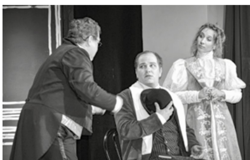
Сцена из спектакля «Дамский портной».

– В водевиле нужно существовать легко, а это как раз самое сложное,