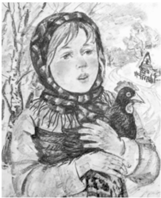
«Барин, купите курицу» (набросок).