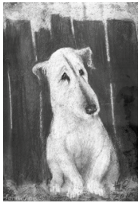
«Грустный пёс» (2010).