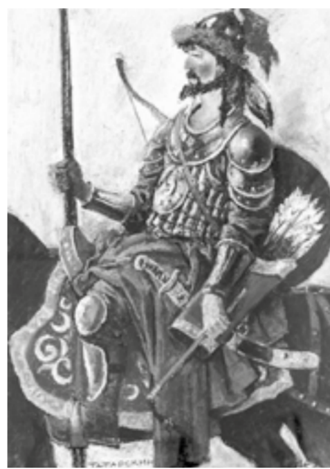
«Татарский воин» (2021).