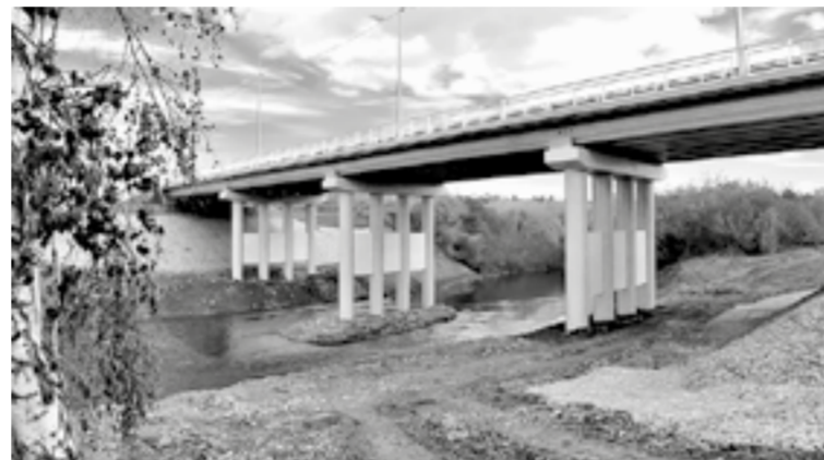
Мост через реку Уксунай.

В Тогульском районе только что введен в эксплуатацию мост через реку Уксунай и началось сооружение переправы через реку Тогул. После завершения ее строительства привлечательность трассы Мартыново – Тогул – Залесово – Ельцовка вырастет у водителей, курсирующих между Алтайским краем и Кемеровской областью. Во всяком случае, на это надеются в «Алтайавтодоре».