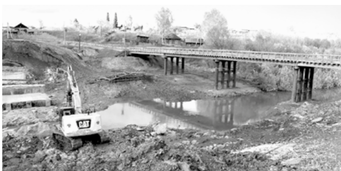
Пока через реку Тогул соорудили временный мост.