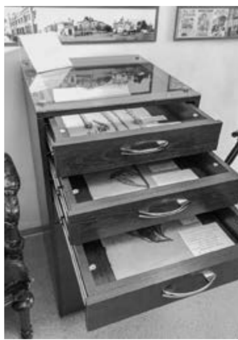
Ценные экспонаты на бережном хранении.