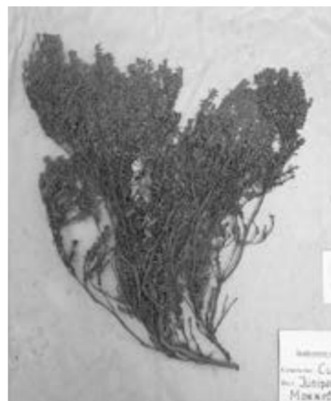
Из этикетки можно все узнать о растении.

ПОМНИТЕ, В ШКОЛЕ МЫ СОБИРАЛИ ГЕРБАРИЙ, ЧЕСТНО ГОВОРЯ, НЕ ОСОБО ПОНИМАЯ, ЗАЧЕМ ЗАСУШИВАЕМ ЛИСТЬЯ, ТРАВКУ? НА САМОМ ДЕЛЕ ГЕРБАРИЙ ВЫПОЛНЯЕТ ДОСТАТОЧНО ВАЖНУЮ РОЛЬ В ИЗУЧЕНИИ ВИДОВ РАСТЕНИЙ И ТАКЖЕ СОХРАНЯЕТ РАСТИТЕЛЬНЫЕ ОБРАЗЦЫ.