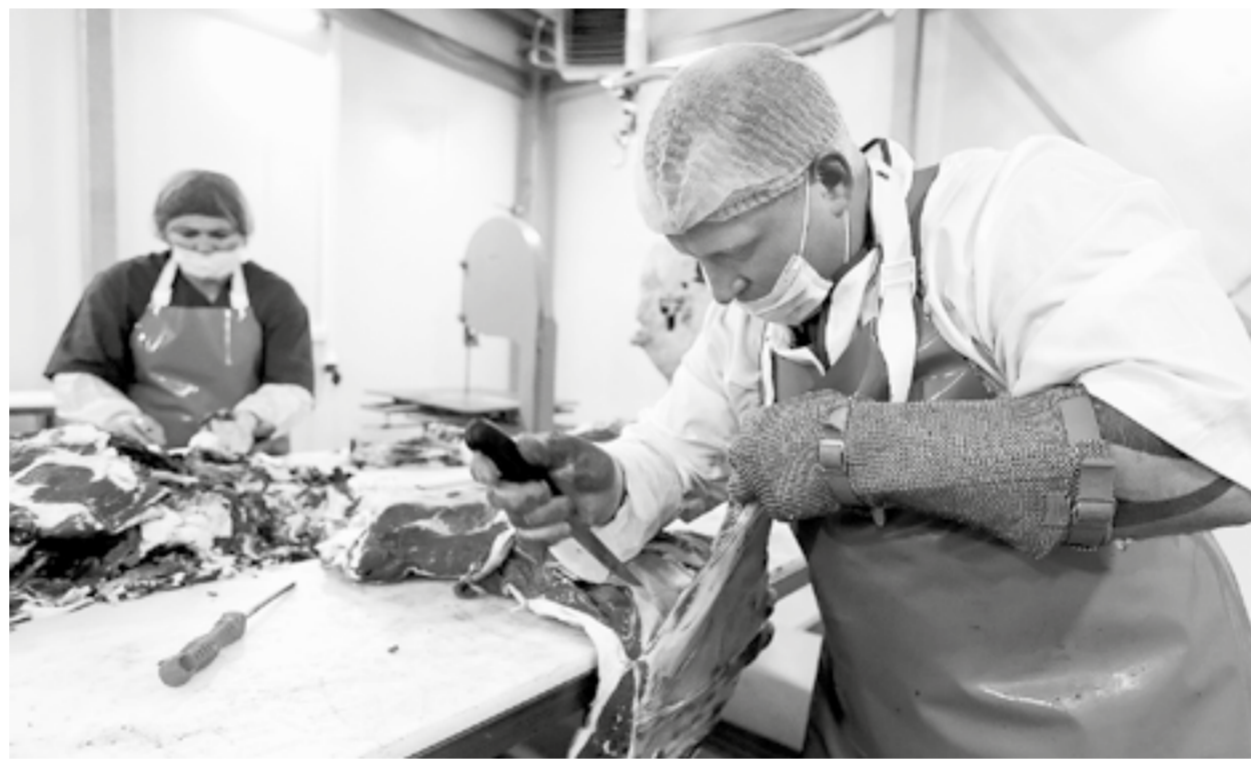
Процессы убоя и разделки туш должны быть цивилизованными, а продукция – безопасной.