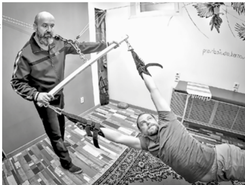
«Чувствуешь мышцы, о которых раньше даже не знал».

Принцип работы тренажера несложный: человека поднимают в воздух при помощи ледки, на руках у него эргономичные захваты, благодаря которым с запястья снимается нагрузка и веревка становится продолжением руки. Клиент может висеть в воздухе с небольшими перерывами до 40 минут, не чувствуя при этом дискомфорта. Упражне-