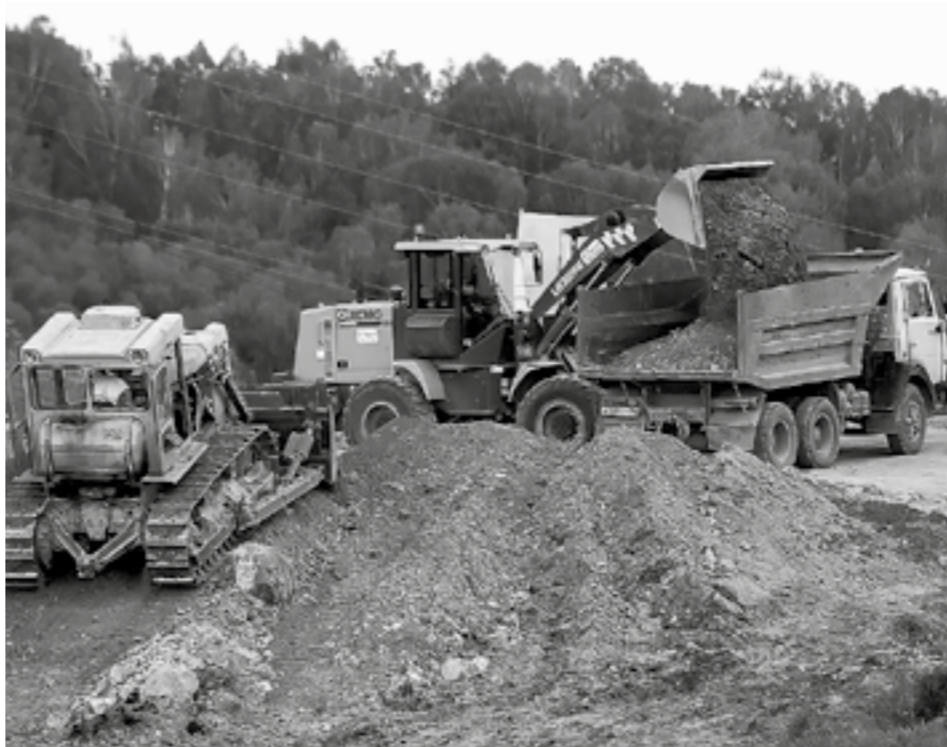
Строительство туристической инфраструктуры требует больших вложений.

Будут построены либо капитально отремонтированы автомобильные дороги, мосты, путепроводы через железнодорожные пути в Алтайском, Заринском, Солтонском районах, городе-курорте Белокурихе, моногороде Заринске и Барнауле. На инфраструктурные кредиты планируется реконструировать сети