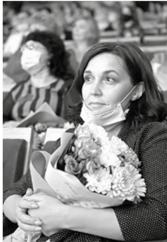
В этот день чествовали лучших из лучших.