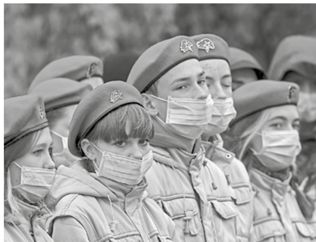
Память о войне в наших сердцах.

Увы, личности немногих из найденных бойцов удается идентифицировать. Статистика неумолима: на каждые 100 обнаруженных