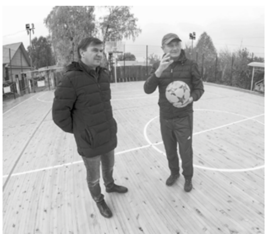
В канун открытия площадки.

– Все наши сельсоветы работают с базовыми предприятиями на