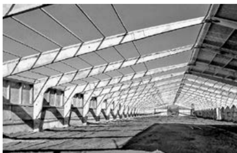
Строящийся склад под новый урожай.