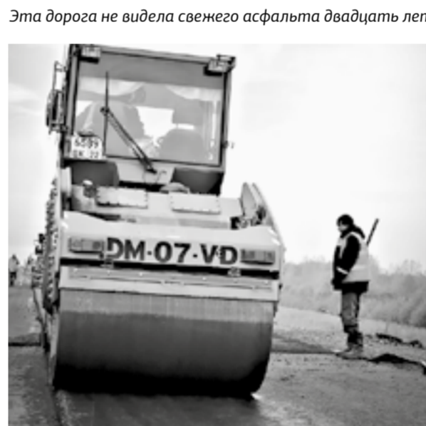
Эта дорога не видела свежего асфальта двадцать лет.