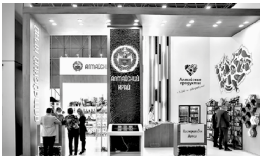
Презентация алтайской продукции.

Министр сельского хозяйства РФ Дмитрий Патрушев вместе с заместителем председателя Правительства РФ Викторией Абрамченко посетила выставку Алтайского края. По словам Дмитрия Патрушева, уровень технологического развития отрасли в России – один из самых высоких в мире, что, в частности, демонстрирует выставка «Золотая осень». Это помо-