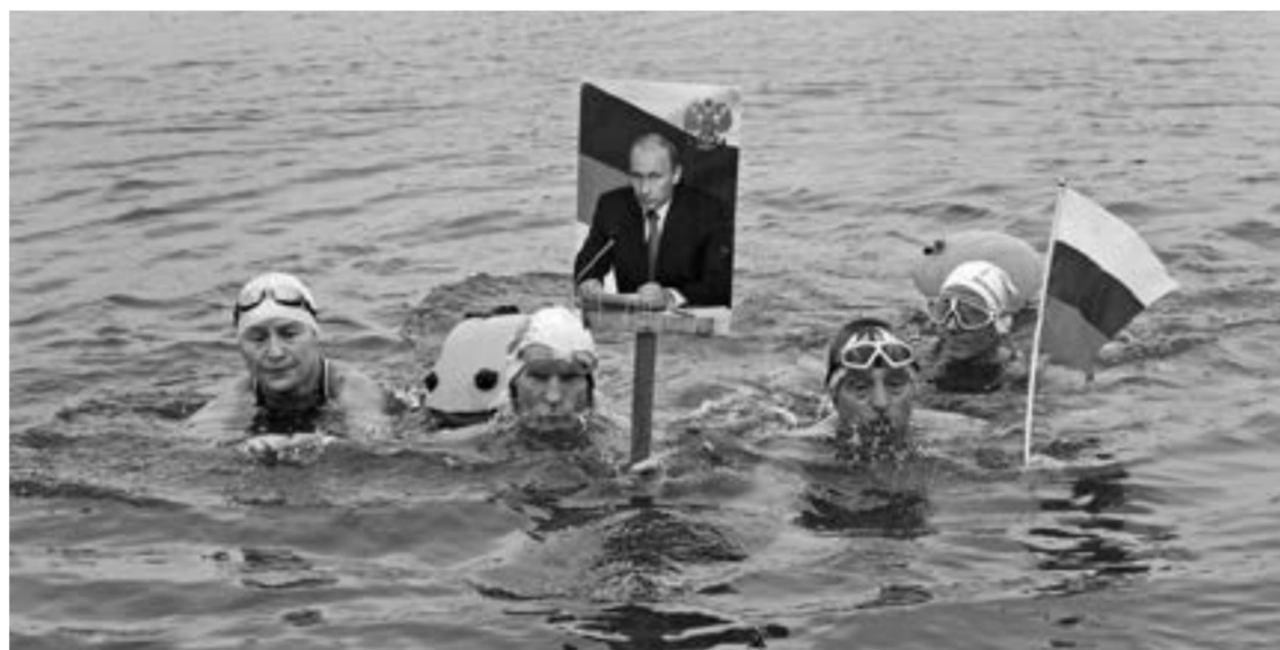
Фото и текст А. НАСПРИШИНА

7 октября они переплыли реку Обь с портретом Владимира Путина и российским триколором в руках. Возглавил эпатажный заплыв президент «Белых медведей» Александр Зеленецкий. Кстати, температура воды в этот октябрьский день была +4 градуса.