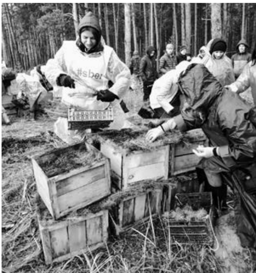
Высадка леса в Егорьевском районе.

В здании круглосуточного стационара Ельцовской ЦРБ завершился капитальный ремонт, длившийся с мая текущего года. Сейчас здесь ожидают поставку мебели и оборудования на общую сумму 2,5 млн руб.