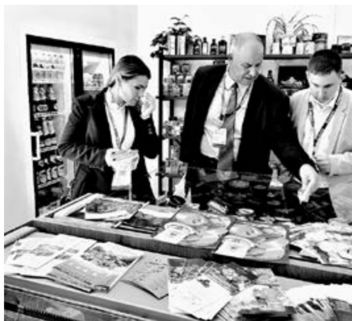
Знакомство с брендами пищевой отрасли региона.