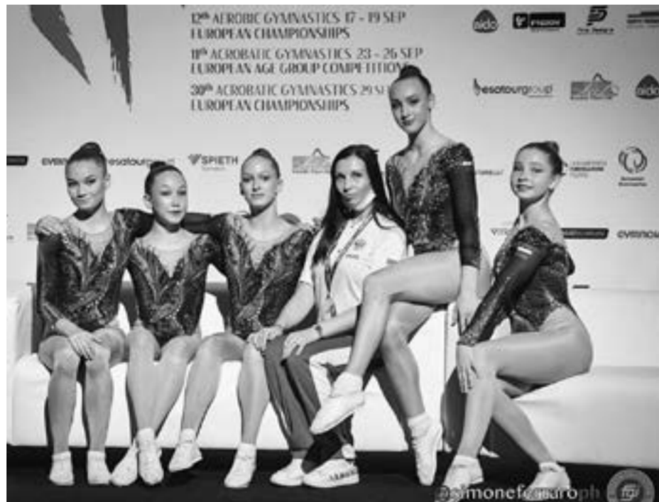
Наши гимнастки заняли 1-е место в командном зачете и в номинации «Группа» среди юниоров.

В этом году ЦДТ приглашает детей попробовать себя в новых видах творчества.