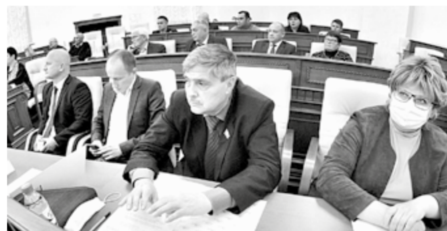
Первое заседание избранных депутатов.

30 сентября в Парламентском центре прошло собрание избранных депутатов АКЗС восьмого созыва. На нем присутствовал 61 человек.