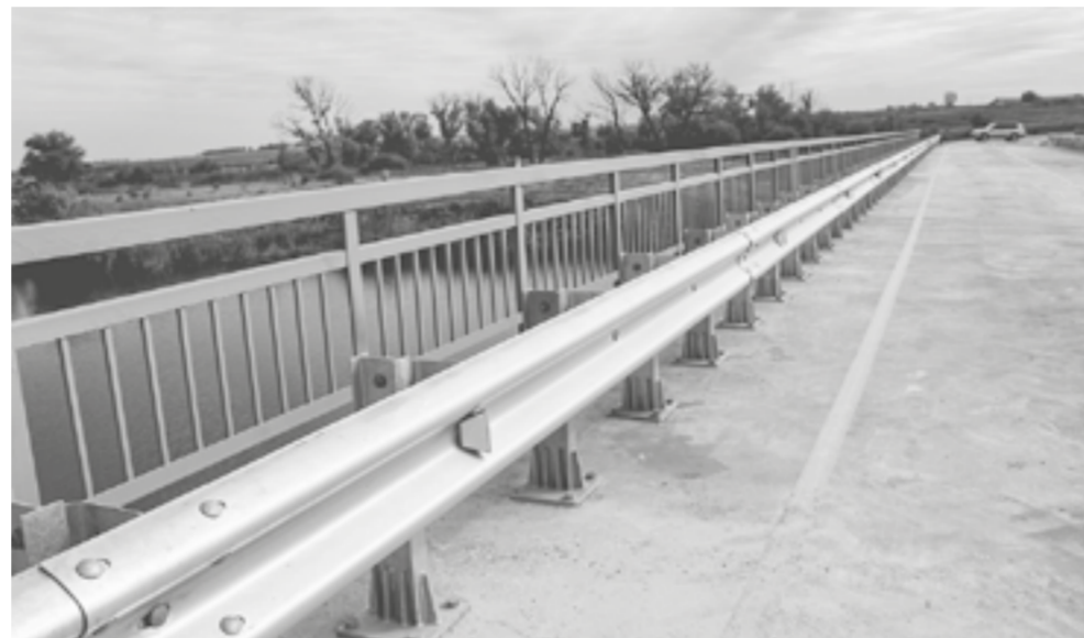
Новый мост решит транспортную проблему Самарского сельсовета.

в зиму. Захватили и снег, и лед – условия суровые. Дорожникам пришлось столкнуться и с другими сложностями. Первая из них – нестандартные пролеты моста, которые поступили из Санкт-Петербурга в Рубцовск, их нужно было каким-то образом доставить на объект.