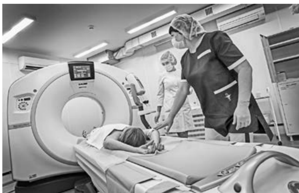
Ежегодно в центре проходят обследование более 700 детей.