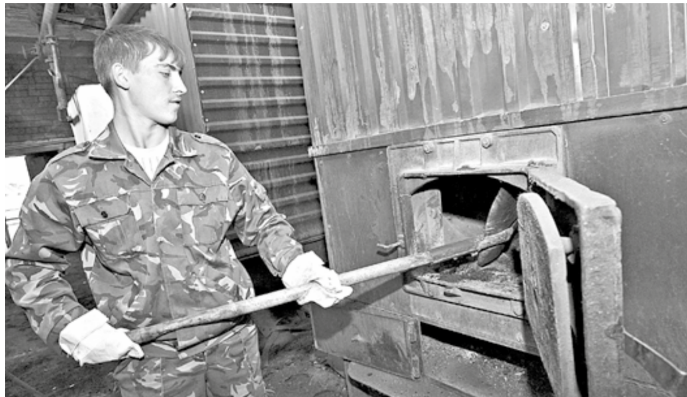
Подвляющее большинство муниципальных котельных готово к работе.