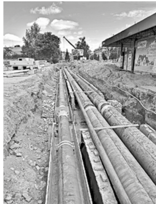
В этом году в крае отремонтировали 130 км теплотрасс.

В крае стартовал отопительный сезон. В большинстве благоустроенных домов батареи наполнились приятным теплом. Но чтобы добиться такого результата, коммунальщикам и властям пришлось постараться.