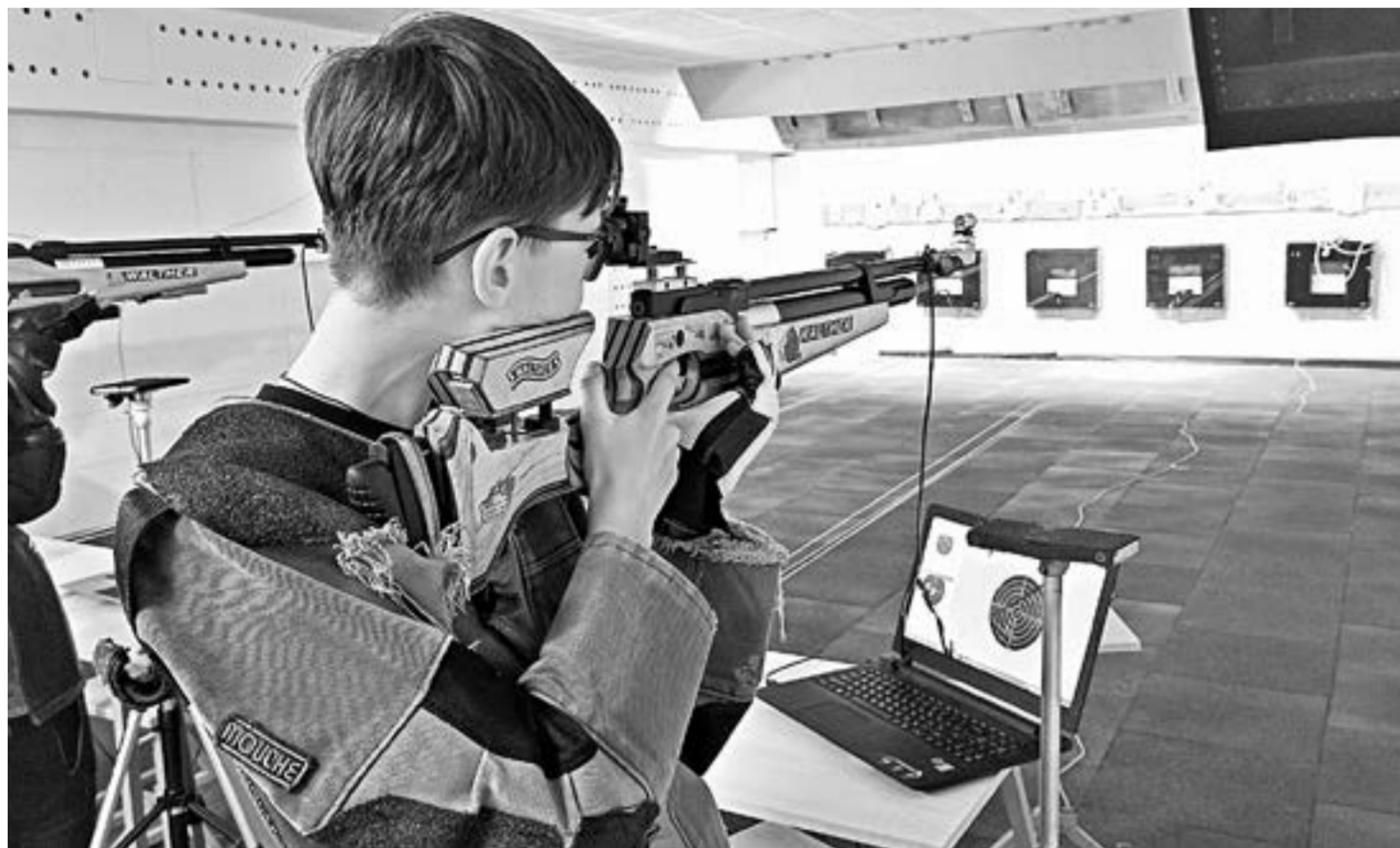
Главное, чтобы рука не дрогнула.