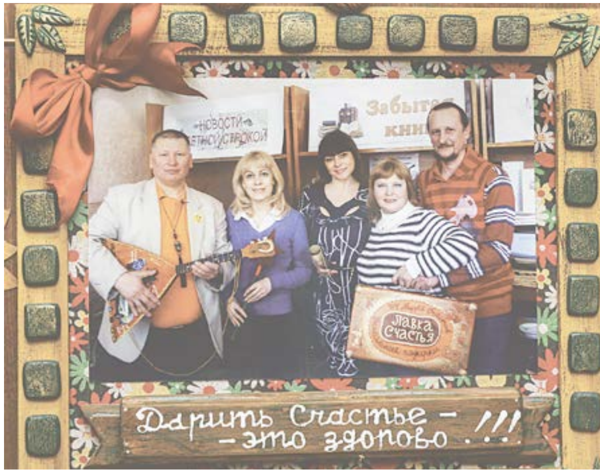
Фото с единомышленниками из Новосибирска.