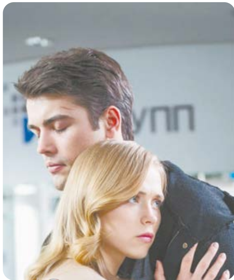
19.00 Х.ф. «ХОРОШИЙ ПАРЕНЬ» (16+)

04.45 Т.с. «Глаза в глаза» (16+) 06.30 Утро. Самое лучшее (16+) 08.00 Сегодня 08.25 Т.с. «Морские дьяволы. Смерч» (16+) 10.00 Сегодня 10.25 Т.с. «Морские дьяволы. Смерч» (16+) 13.00 Сегодня 13.25 Чрезвычайное происшествие 14.00 Место встречи (16+) 16.00 Сегодня 16.25 За гранью (16+) 17.30 ДНК (16+) 18.35 Т.с. «Балабол» (16+) 19.00 Сегодня 19.40 Т.с. «Балабол» (16+) 21.20 Т.с. «Метод Михайлова» (16+) 23.30 Сегодня 23.50 Поздняков (16+)