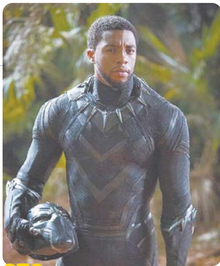
СТС 14.20 X.ф. «Чёрная Пантера» (16+)

04.40 Т.с. «Глаза в глаза» (16+) 06.30 Утро. Самое лучшее (16+) 08.00 Сегодня 08.25 Т.с. «Морские дьяволы. Смерч» (16+) 10.00 Сегодня 10.25 Т.с. «Морские дьяволы. Смерч» (16+) 13.00 Сегодня 13.25 Чрезвычайное происшествие 14.00 Место встречи (16+) 16.00 Сегодня 16.25 За гранью (16+) 17.30 ДНК (16+) 18.35 Т.с. «Балабол» (16+) 19.00 Сегодня 19.40 Т.с. «Балабол» (16+) 21.20 Т.с. «Метод Михайлова» (16+) 23.30 Сегодня 23.50 Т.с. «Консультант» (16+) 03.30 Т.с. «Агентство скрытых камер» (16+)