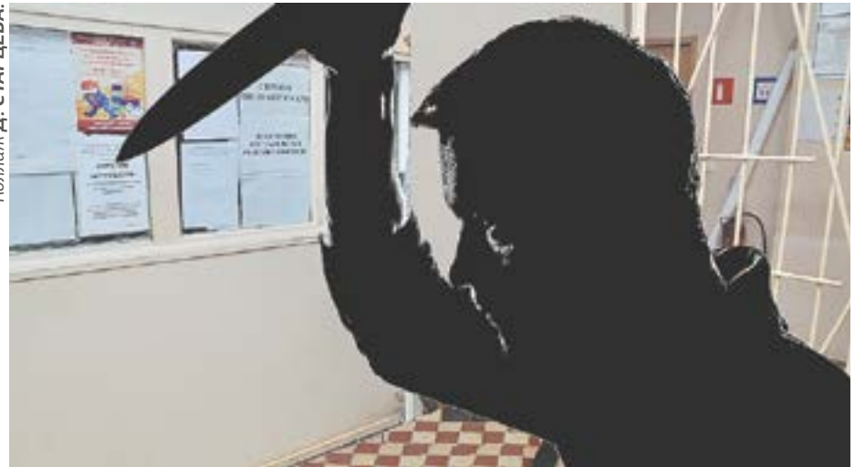
Коллонж Д. СТАРЦЕВА.

Под подозрение тогда сразу же попал тот самый студент Алексей О., которого заметили другие обучающиеся. И очень многие улики указывали на то, что с Людмилой расправился именно он: на его одежде, например, эксперты нашли следы