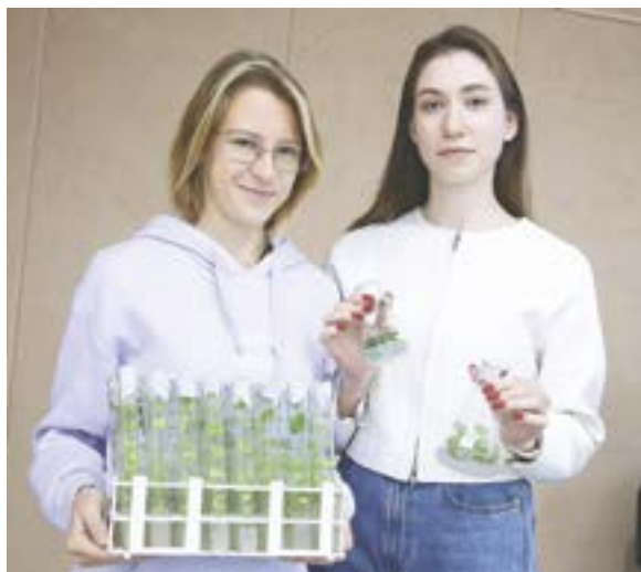
В колбах – оздоровленный посадочный материал.