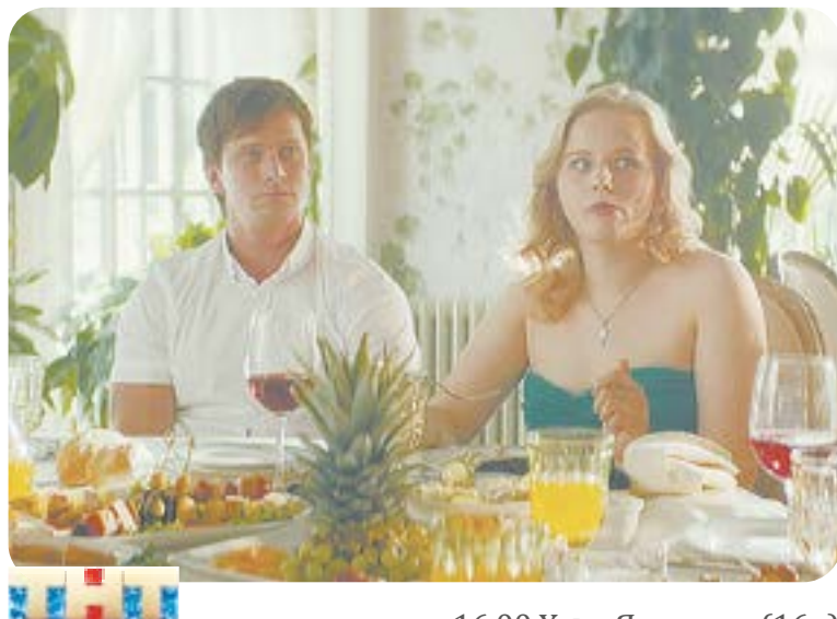
16.00 Х.ф. «Я худею» (16+)

05.00 «Тайны Чапман» (16+) 07.30 Х.ф. «Коммандо» (16+) 09.20 Х.ф. «Каратель» (16+) 11.30 Х.ф. «Король Артур» (12+) 14.00 Х.ф. «Великая стена» (12+) 15.55 Х.ф. «Хроники хищных городов» (16+) 18.20 Х.ф. «Принц Персии. Пески времени» (12+) 20.30 Х.ф. «Боги Египта» (16+) 23.00 «Добров в эфире» (16+) 00.05 «Военная тайна» с Игорем Прокопенко (16+) 02.00 «Самые шокирующие гипотезы» (16+) 04.25 «Территория заблуждений» с Игорем Прокопенко (16+)