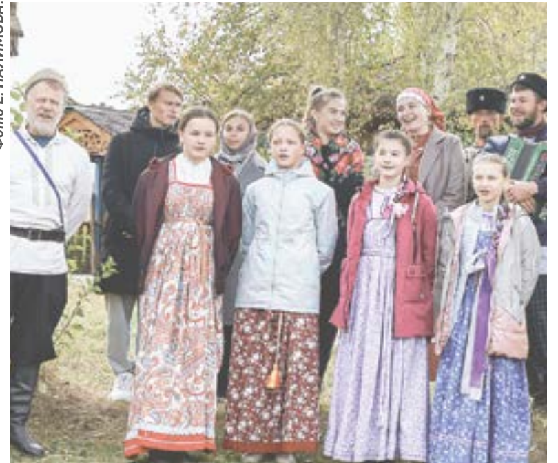
Песней дорогих гостей встречал фольклорно-этнографического ансамбля «Конаречка».