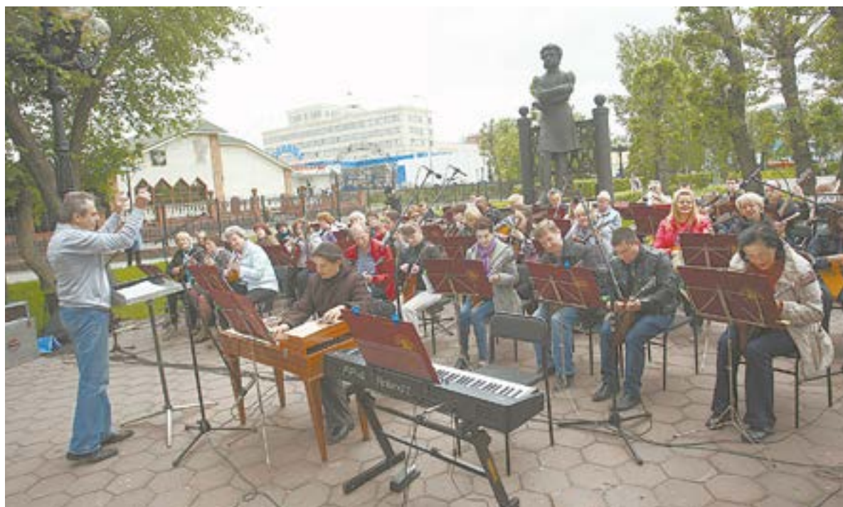
Достойно платить служителям муз должен не Пушкин, а работодатель.