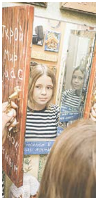
Вот так можно заглянуть в свое счастье.