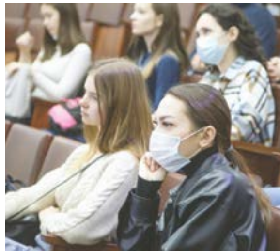
В рамках симпозиума прошли школы молодых ученых.

работки, чтобы повысить функциональность продуктов – меда, мармелада, грибов.