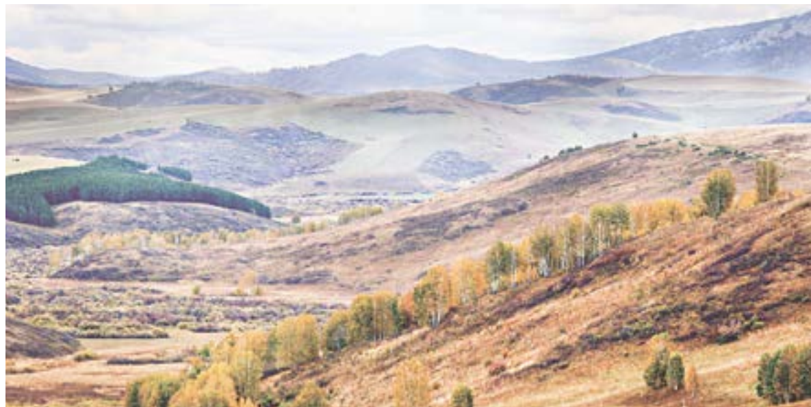
Красота Чарышского района.