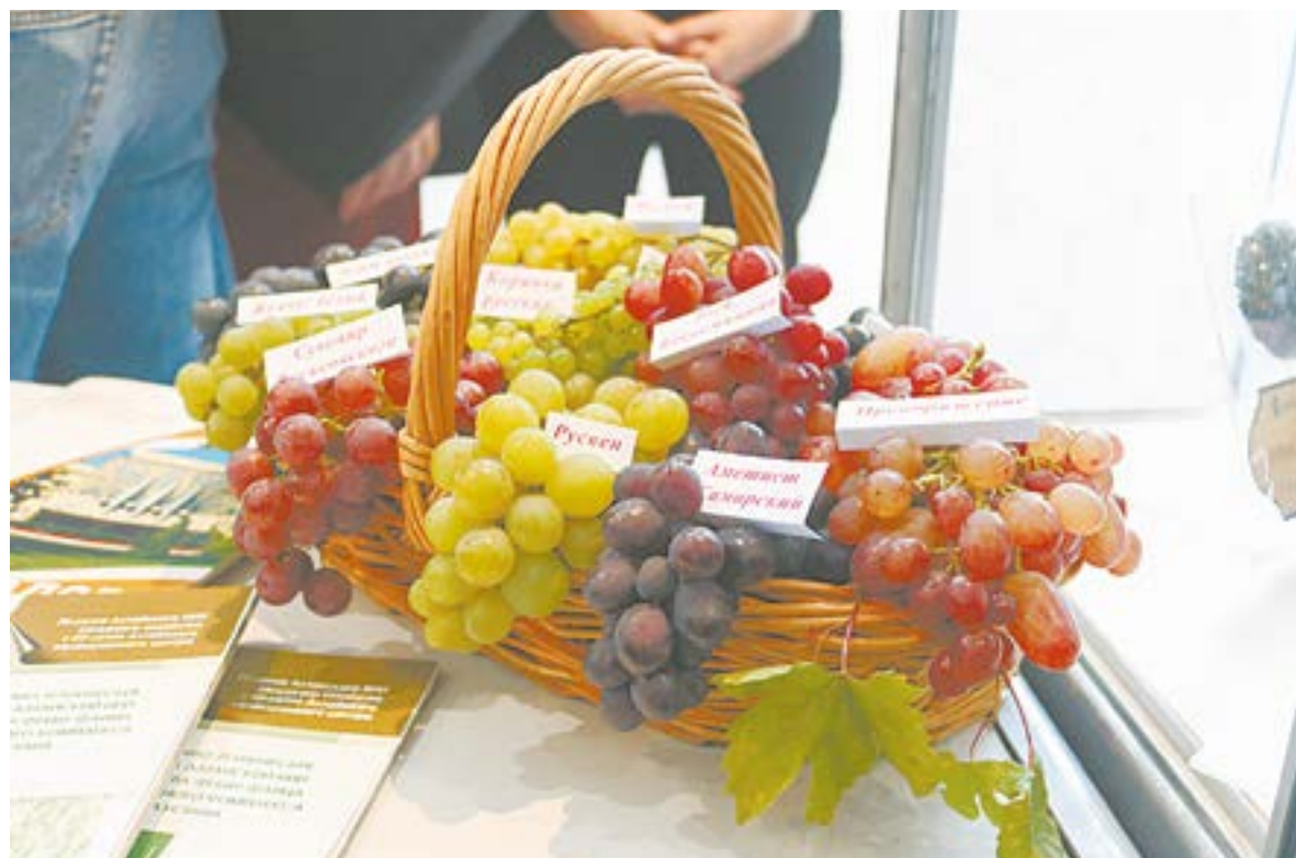
Продукция селекционеров ФАНЦА радовала глаз посетителей выставки.

Ученый рассказал о важности мутаций. Уже ясно, что многие полезные признаки животных и растений появились в результате случайного повреждения определенных генов. Если раньше селекционер работал почти вслепую, базируясь на своем опыте, то сегодня он применяет маркеры, понимая, какой ген влияет на проявление определенного признака. Соответственно, можно отбирать лучшее, анализируя не внешность живого, а его генотип. Такой отбор более быстрый и дешевый. В пример Алек-