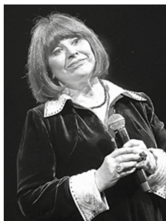
Выступает Наталья Варлей.