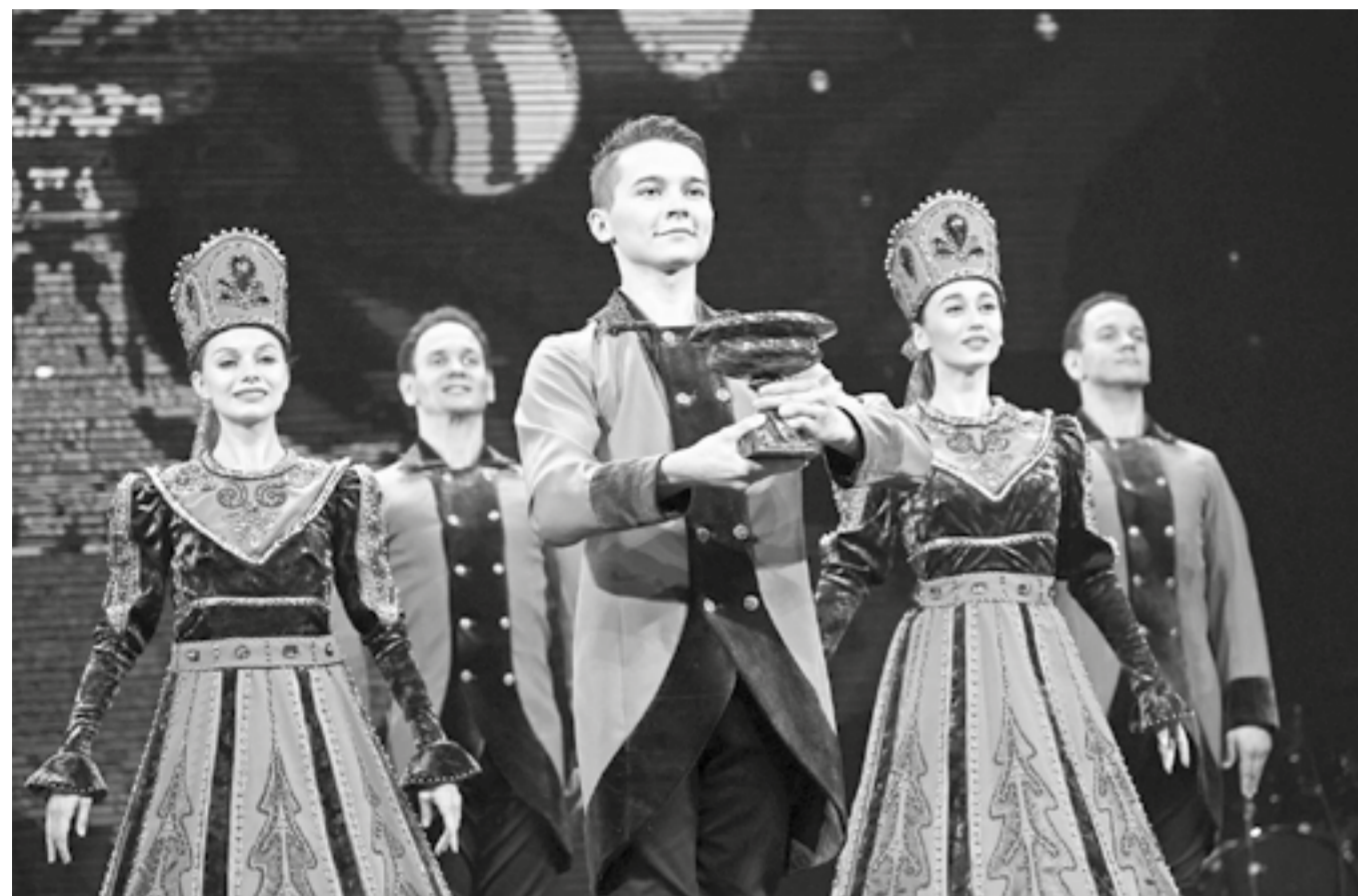
Главный приз кинофестиваля – ваза из ревневской яшмы.