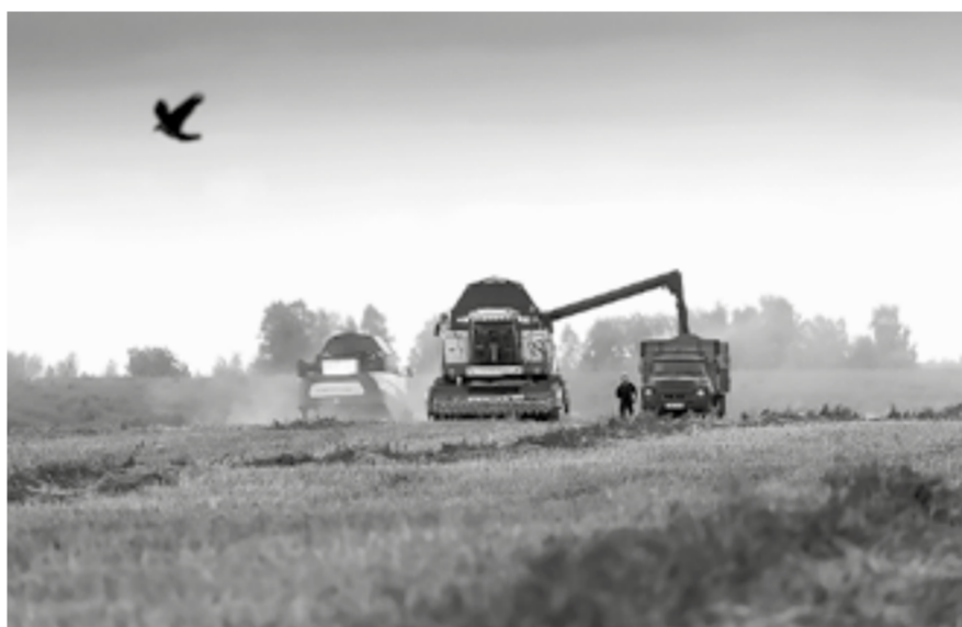
Последние поля с гречихой.