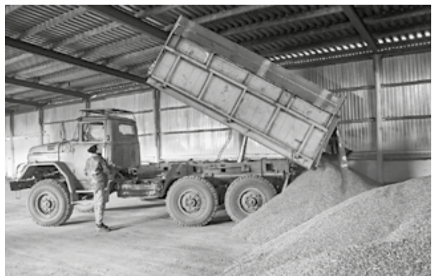
Идет подработка зерна.