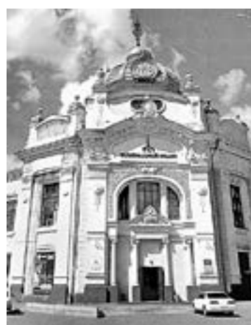
Пренный вид здания.