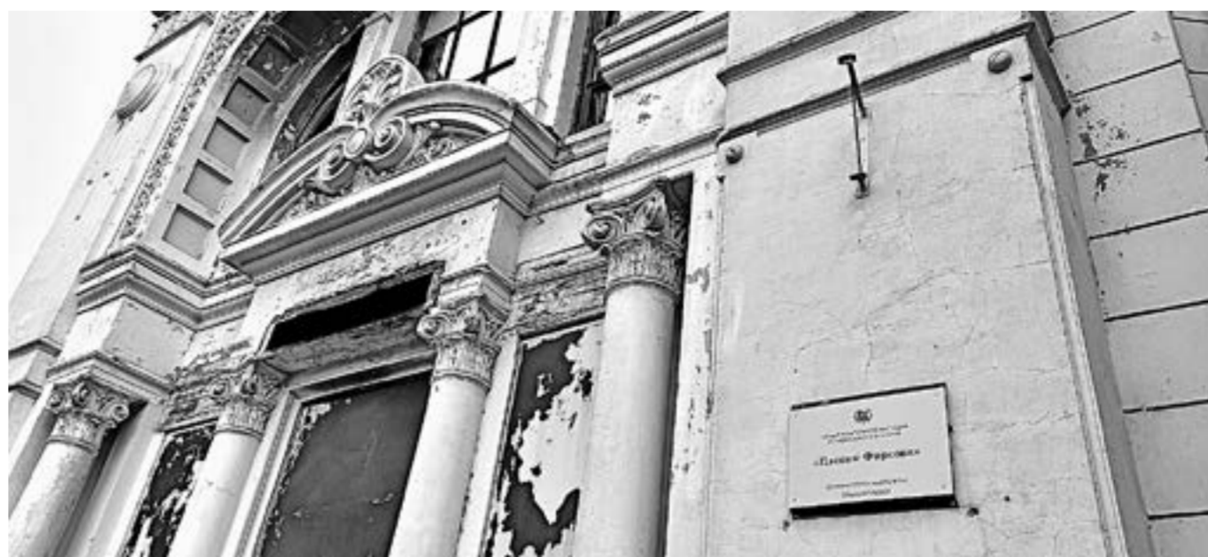
Состояние пассажа Фирсова оставляет желать лучшего.