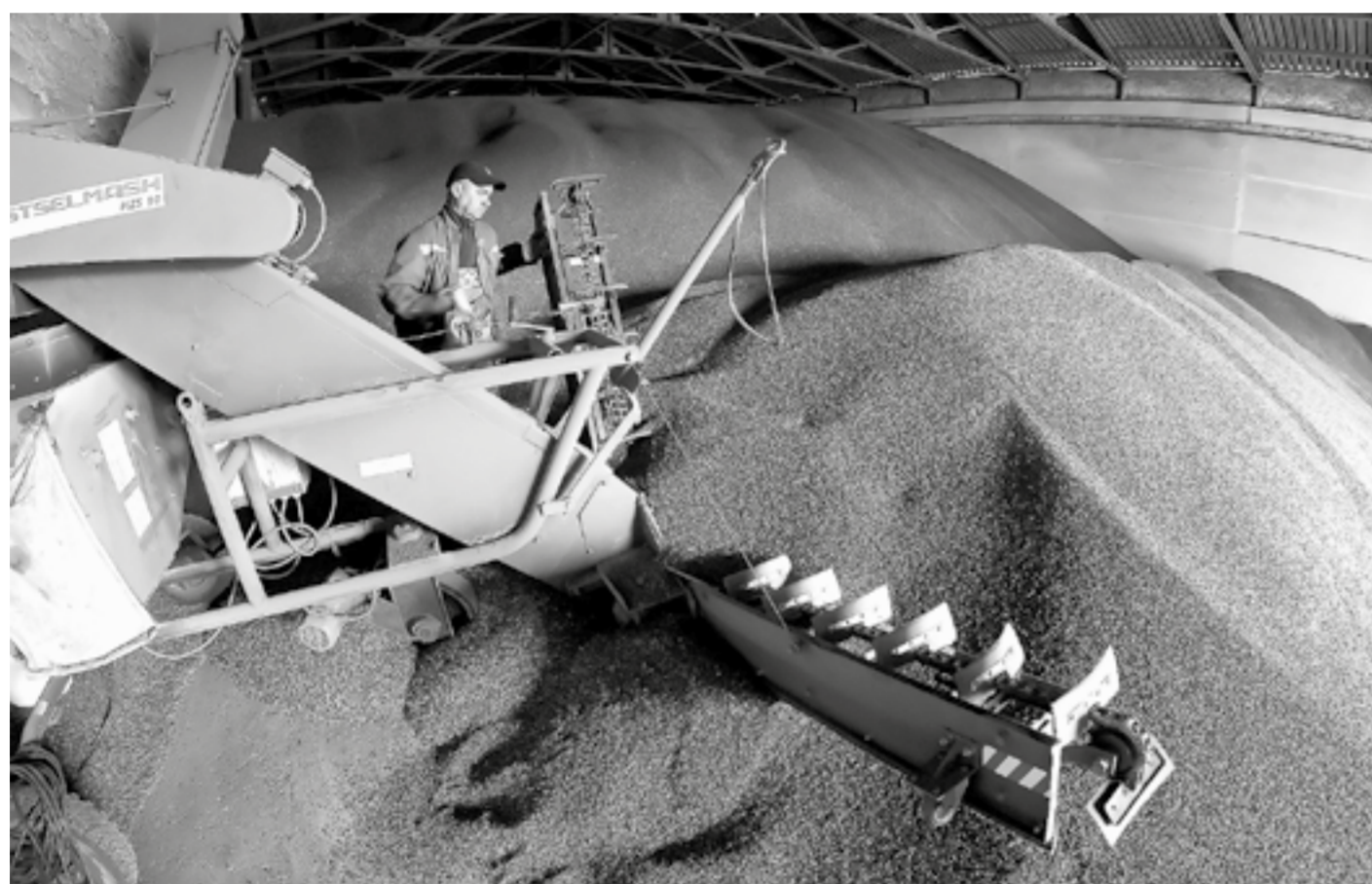
По транспортеру – в занрома.