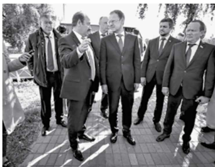
Глава города Дмитрий Фельдман рассказал губернатору, как осваиваются средства.