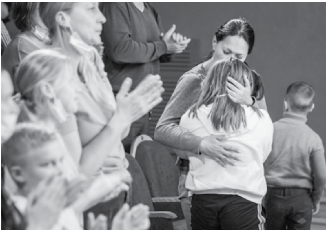
В финале спектакля некоторые зрители планали.