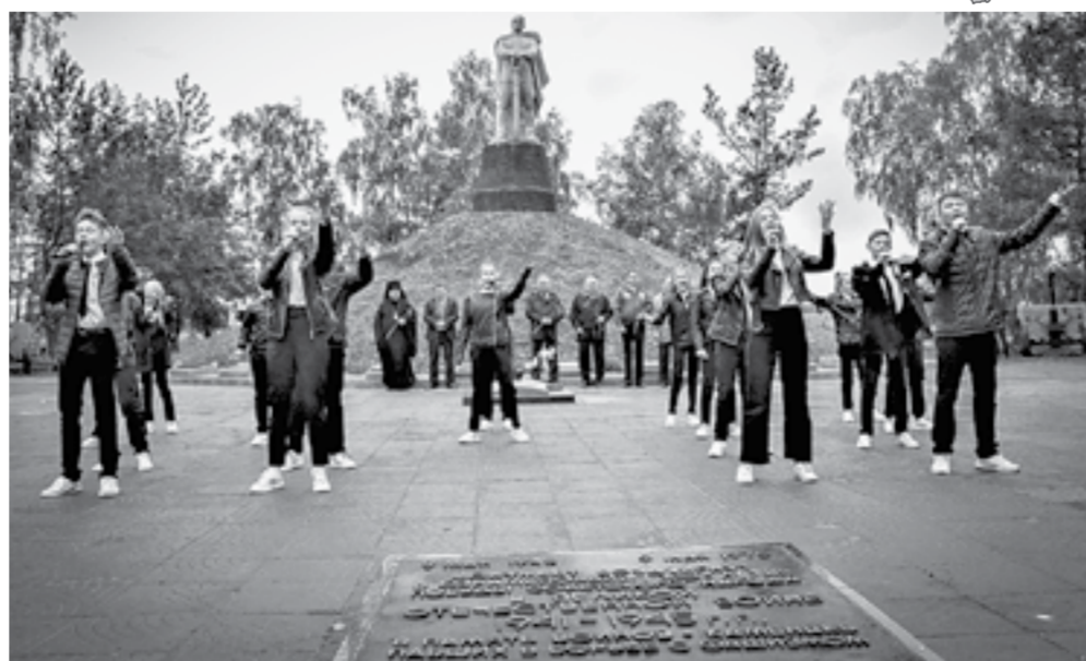
Первый этап реставрации Мемориального комплекса завершен.

Жители считают это место святыней. Из Камня и Каменского района на фронт ушло 12 395 человек, около