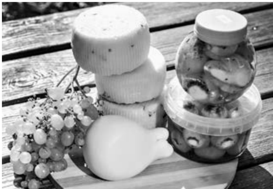
Такой товар не залеживается.