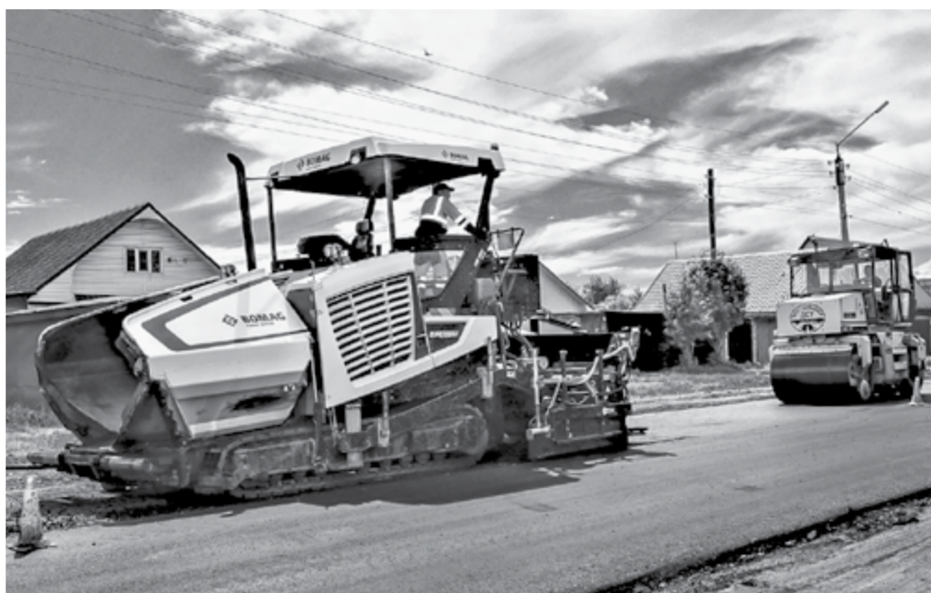
В этом году на ремонт дорог в Рубцовске направлено 275 млн рублей.