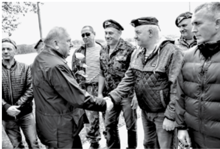
Бывший командующий ВДВ Владимир Шаманов рад встрече.