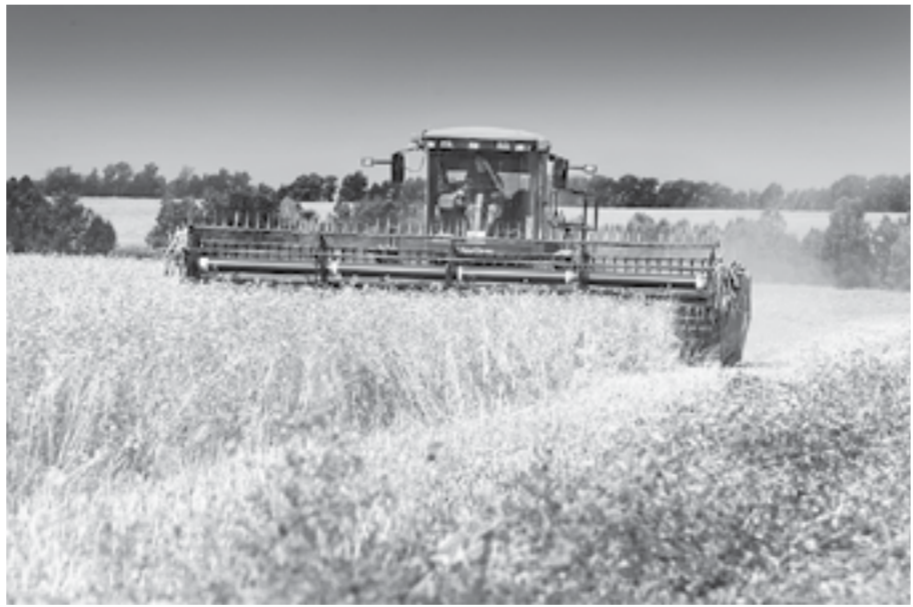
Доля ежегодного экспорта из края в последнее время составляла 18% от урожая.

С 5 июня по 31 августа 2021 года правительство ограничило вывоз гречихи из России. Если точнее, то запретили экспорт гречихи, крупы грубого помола из нее и гречневое зерно обрушенное. Эта мера должна была удержать необходимый объем продукта внутри страны и стабилизировать цены на крупу.