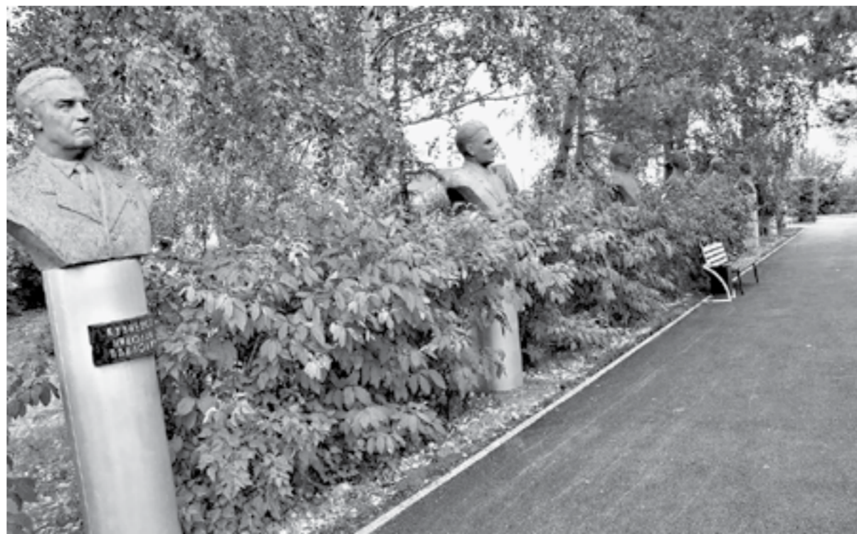
На аллее героев Советского Союза пока только 15 бюстов.