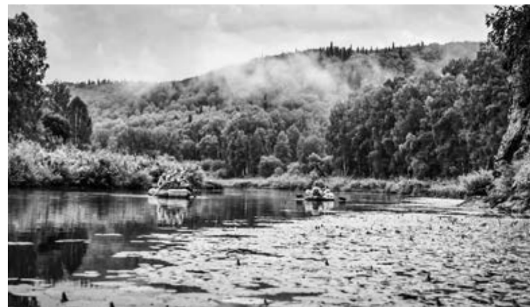
Один из новых туристических маршрутов – водный.

ми культуры, общественниками. Обсуждали вопросы совместных действий, а также создания объединений единомышленников, проведения летних экспедиций и полевых практик для учащихся. На данный момент действует два клуба друзей национального парка – на базе Ельцовской и Тогульской школ.