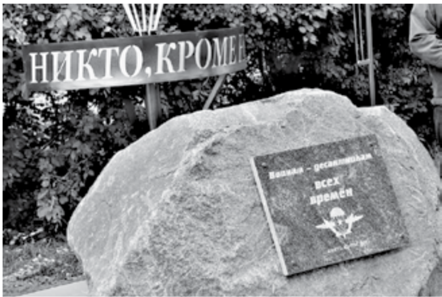
Монумент в честь воинов-десантников.