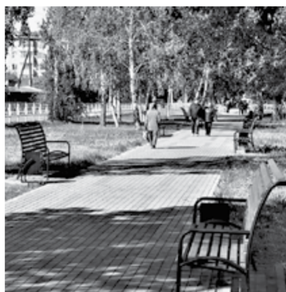
Проспект Рубцовский преобразился.