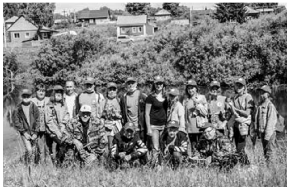
Участники летней школы.