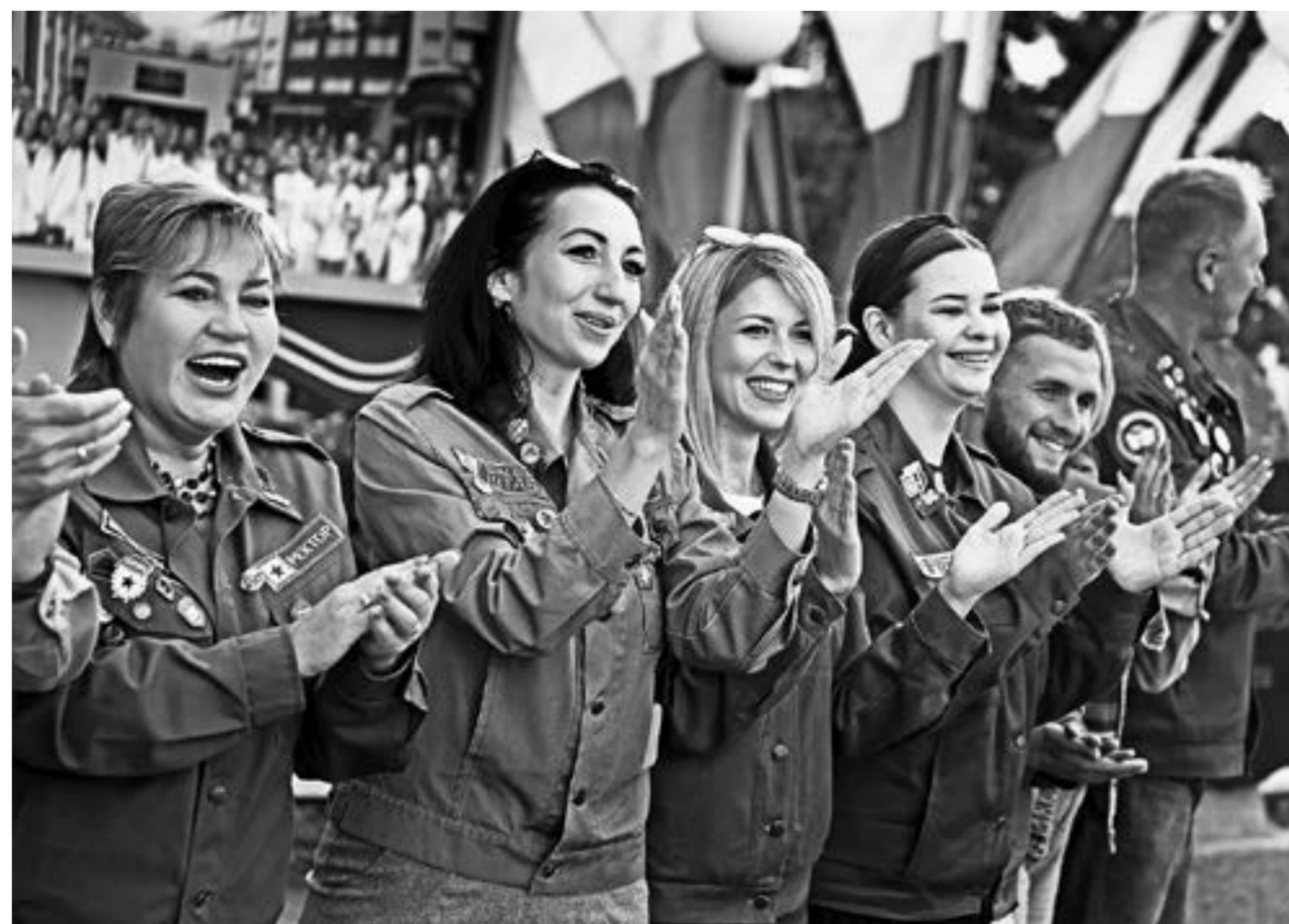
Ребята встречают руководителей АГМУ и представители краевого штаба.

результаты. Впервые выиграли звание лучших отрядов, – добавляет комиссар.