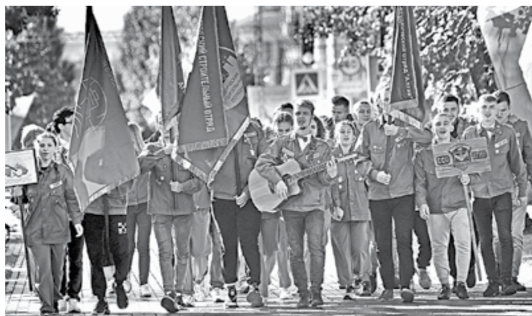
Бойцы отрядов шагают в новый день с песней.

Будущие медики из Барнаула стали лучшими в конкурсах на всероссийских студенческих стройках. В АГМУ прошла торжественная встреча строительного отряда «Товарищ» и сервисного отряда «Ватерпас». Они привезли на Алтай знамена лучших.