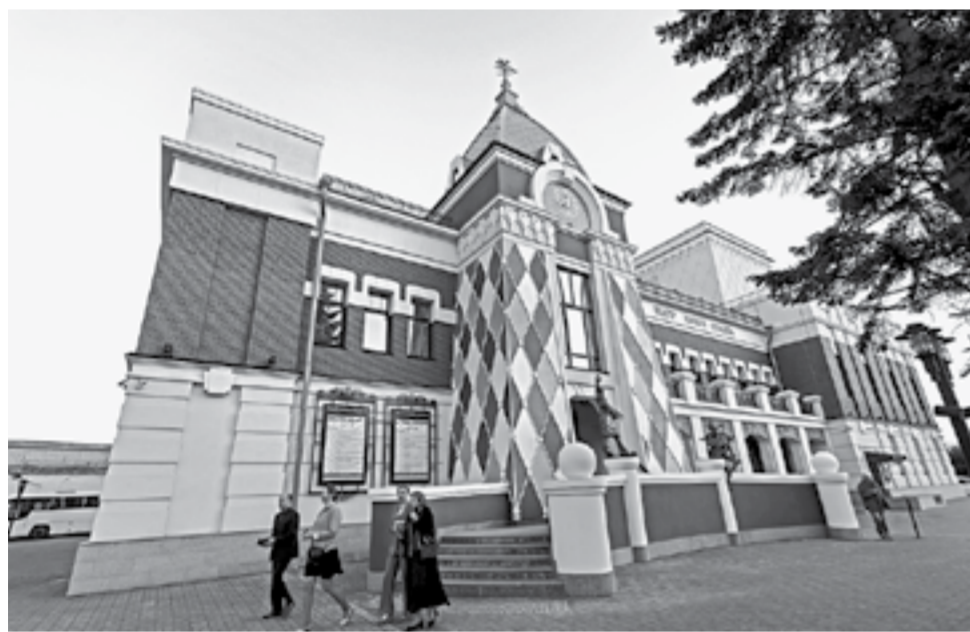
Здание вписалось в исторический центр Барнаула.