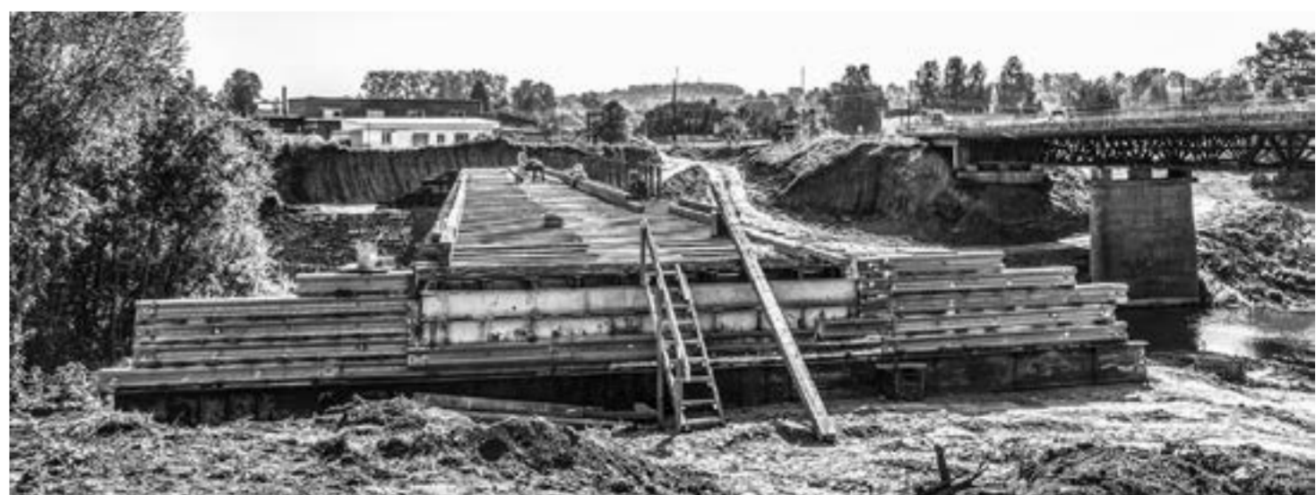
На строительстве временного моста через Тогул.

Решение о реконструкции большого моста через Тогул было принято еще два года назад, поскольку он не