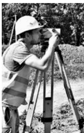
«Чтобы было точно».

В Тогульском районе Алтайского края продолжается ремонт двух мостов через реки Уксунай и Тогул на автодороге «Мартьяново – Тогул – Залесово».