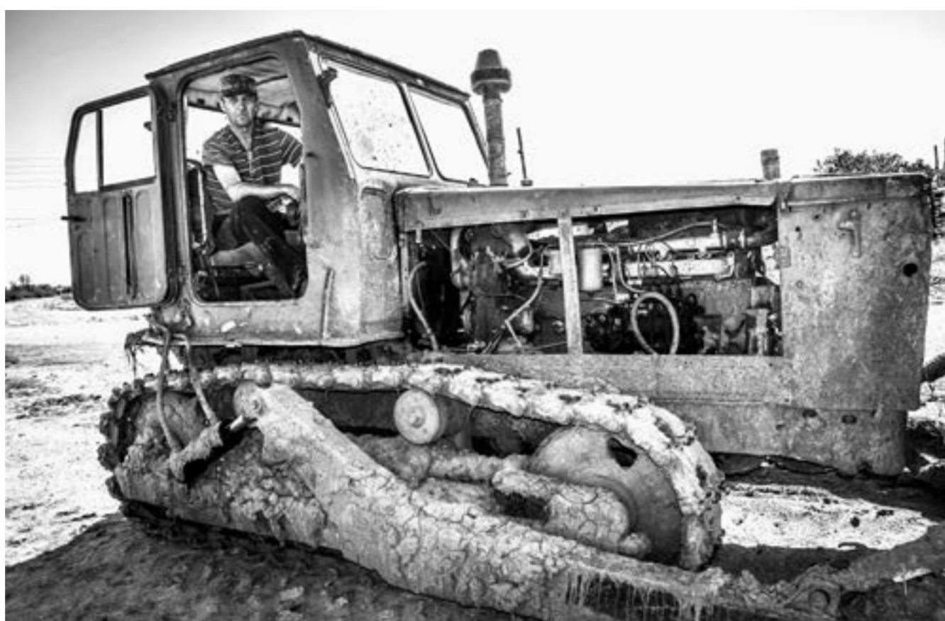
Трактор Т-4А задействован в качестве бульдозера.

Тем не менее, и сегодня в отдельных хозяйствах он еще состоит на службе. Например, в СПК имени Кирова в Рубцовском районе его не списали со счетов. Конечно, в поле этот трактор уже не выходит, зато в животноводстве очень даже