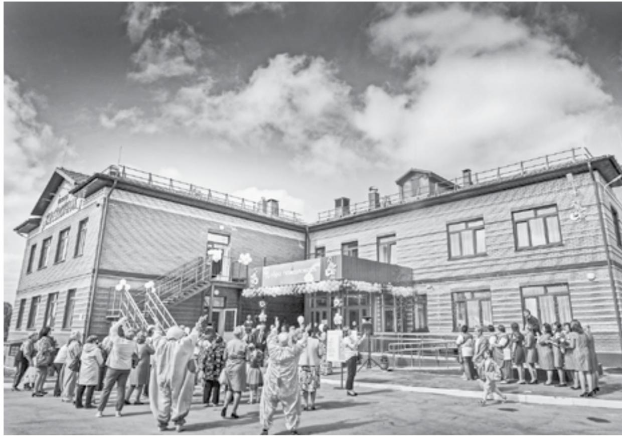
В середине сентября дети смогут заехать в новые ясли-сад.