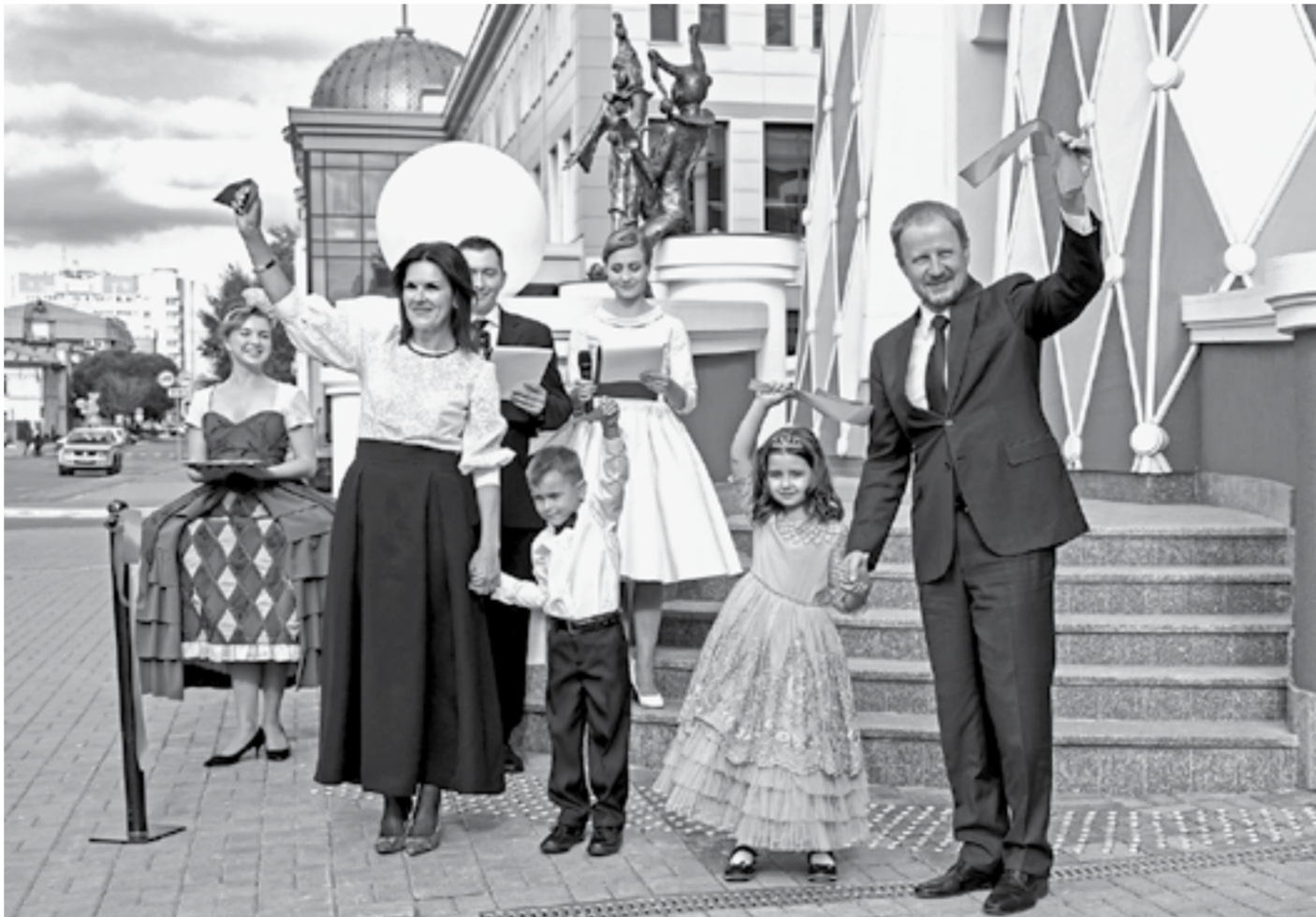
Этого момента театр «Сказка» ждал долгие 7 лет.