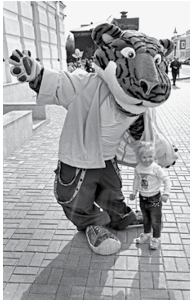
Скоро начнутся спектакли.