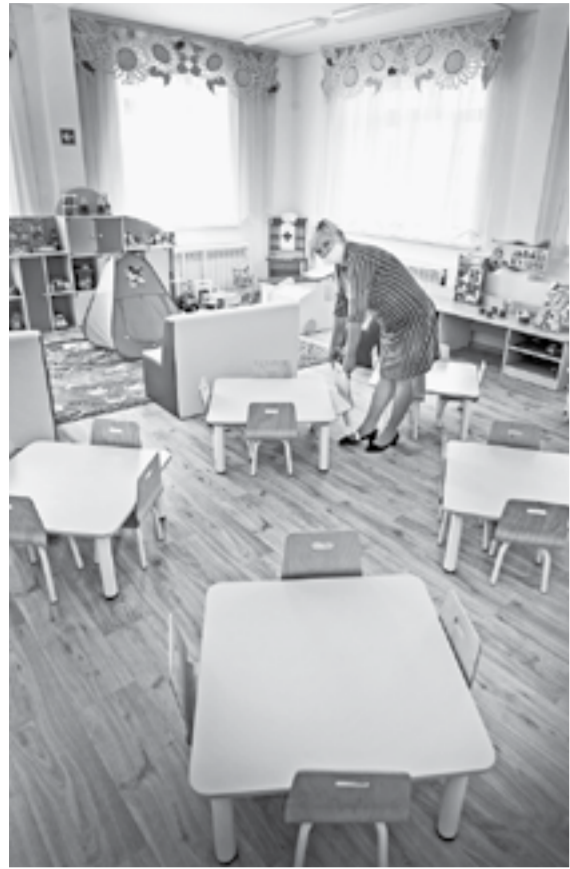
Для детей созданы комфортные условия.