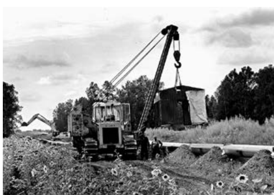
Необходимо продолжить газификацию края.

Отметим, эксперты активно сотрудничали с органами исполни-