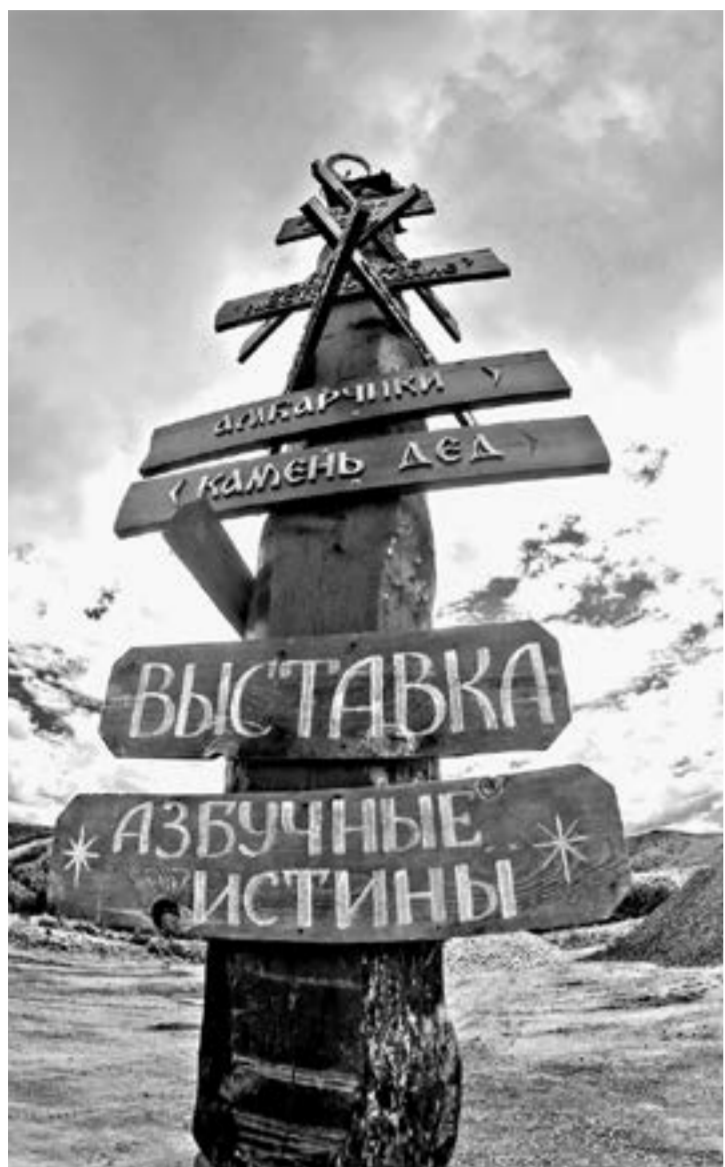
Обустройство турмаршрутов – важное направление отрасли.