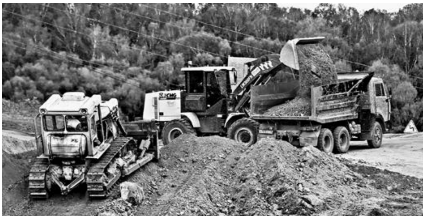
Строительство дорог на перспективном алтайском курорте «Белокуриха Горная» продолжается.