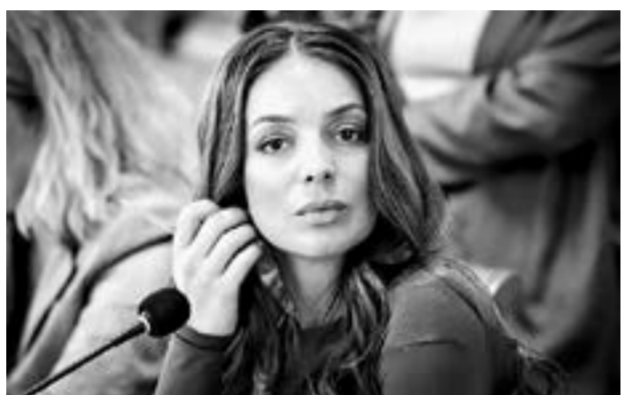
Зарина Догузова: «За счет нацпроекта по туризму мы готовы поддержать инвесторов дешевыми кредитами».