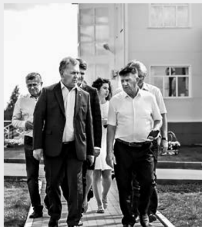
Производственные и социальные объекты Немецкого национального района – в центре внимания председателя АКЗС Александра Романенко.

Заключительным пунктом визита председателя АКЗС стало посещение молочно-товарной фермы сельхозартели «Степной», где идет капитальная реконструкция одного из животноводческих помещений на 150 коров, в котором планируется установить роботов-дойаров. В истории АПК Немецкого национального района это, без преувеличения, революционный проект.