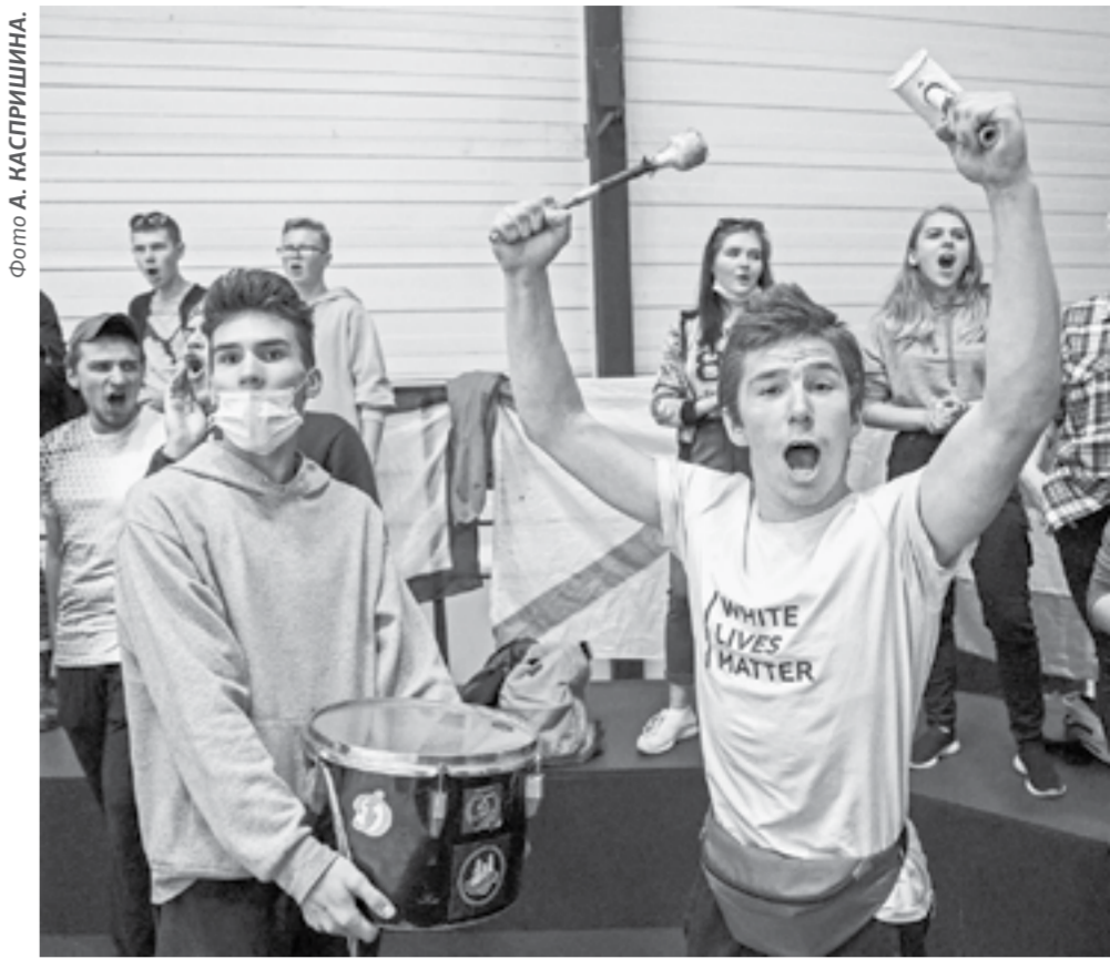
ХК «Динамо-Алтай» за две игры настрелял в ворота «Рысей» семь шайб.