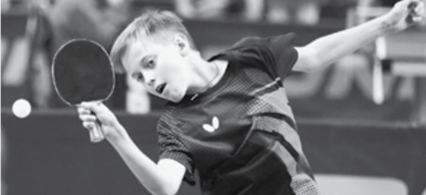
На покрытии новых столов удобнее контролировать скорость мяча.

С 19 по 22 августа в барнаульском спорткомплексе «Победа» впервые за 15 лет прошли Всероссийские соревнования на призы краевой Федерации настольного тенниса среди юниоров и юниорок до 19 лет.