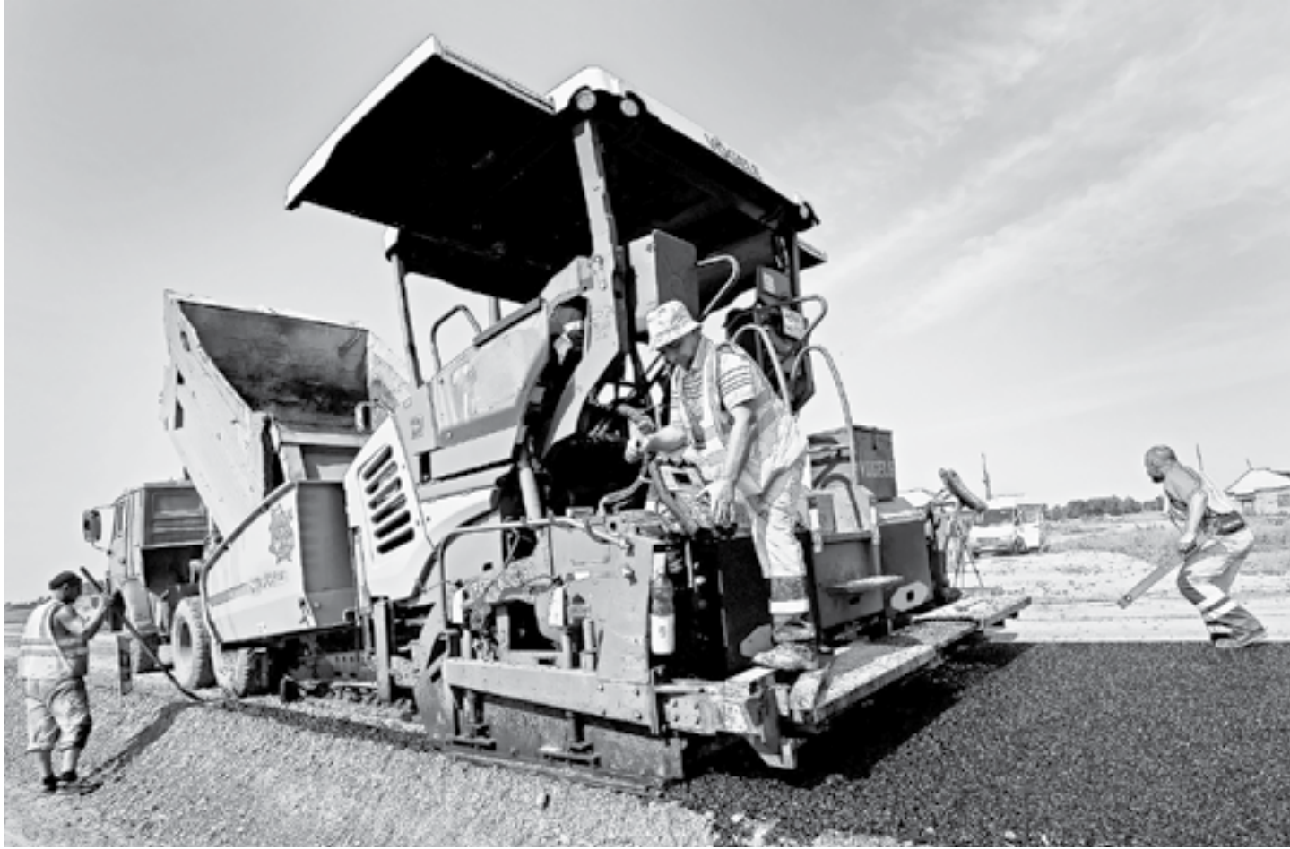
Обновление трассы проходит в несколько этапов.