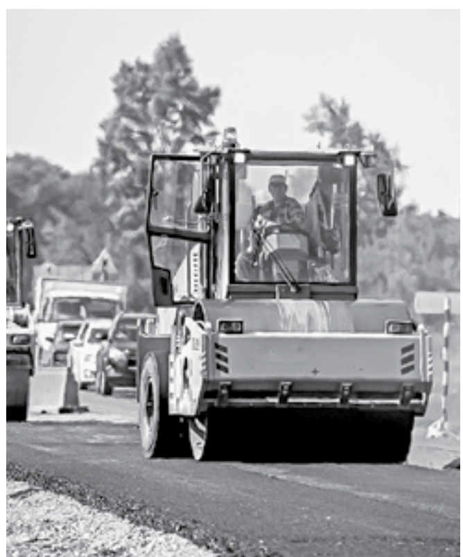
В распоряжении дорожников новая техника.