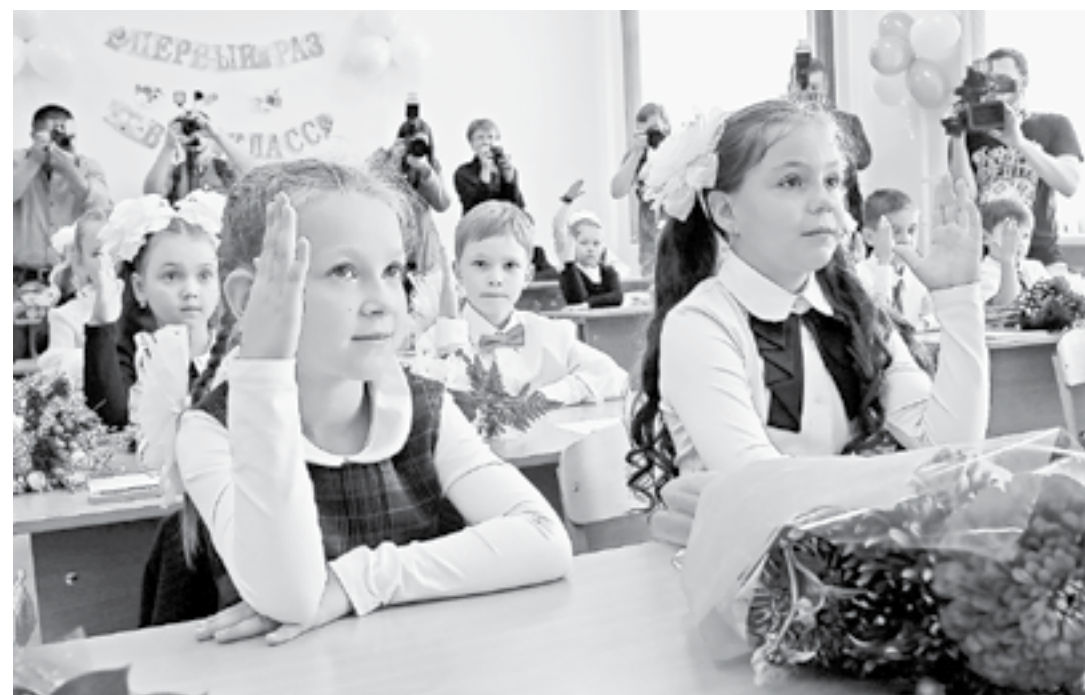
Дети должны учиться в достойных условиях.