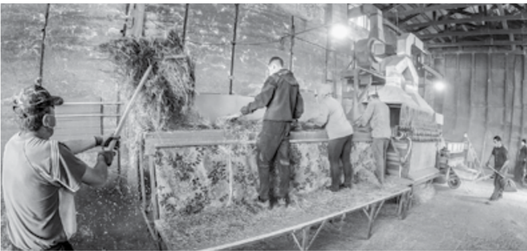
Работает мяльно-трепальный станок.

В цеху пыльно, поэтому рабочие вынуждены работать в респираторах и несколько раз пропускать солому через