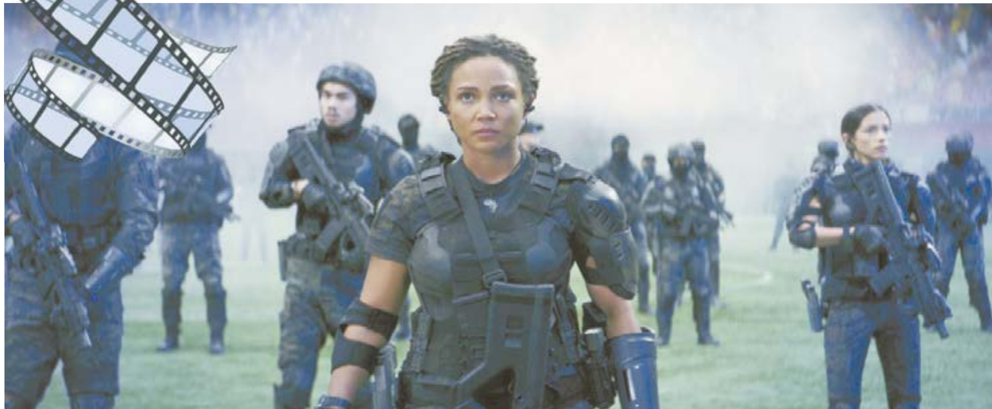
Все персонажи фильма в решающий момент сыграют ключевые роли.