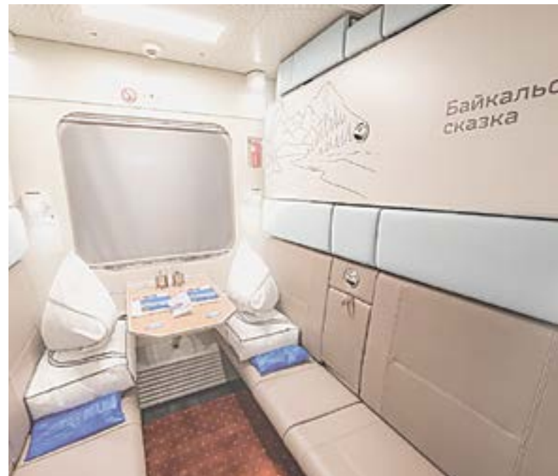
Современное комфортабельное купе.