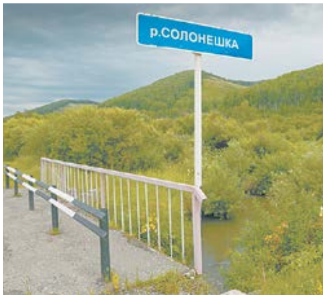
Природоохранные территории несовместимы с разработками.