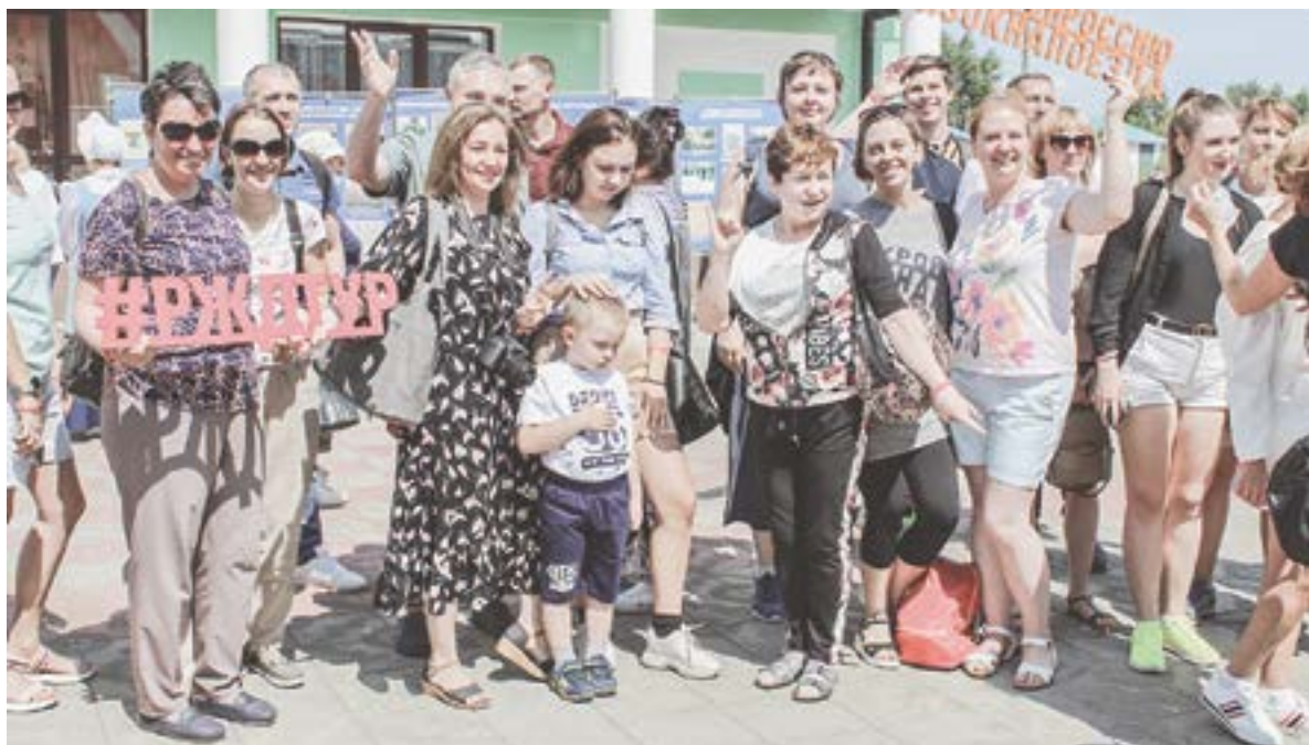
Пассажиры поезда на Славгородской земле.