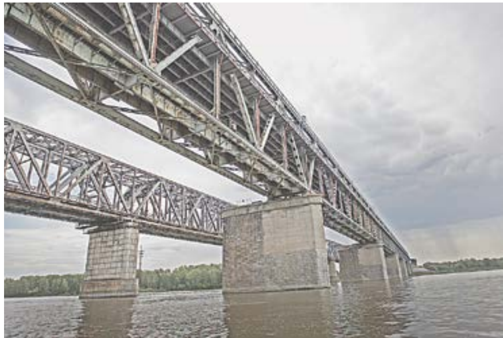
Старый мост должен быть готов в ноябре.

– В основном работа развивает физические качества – силу, выносливость. В ком-то развиваются лидерские качества, кто-то перестает быть замкнутым в себе, раскры-