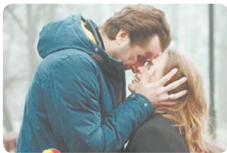
10.35 Х.ф. «МАМА МОЕЙ ДОЧЕРИ» (16+)