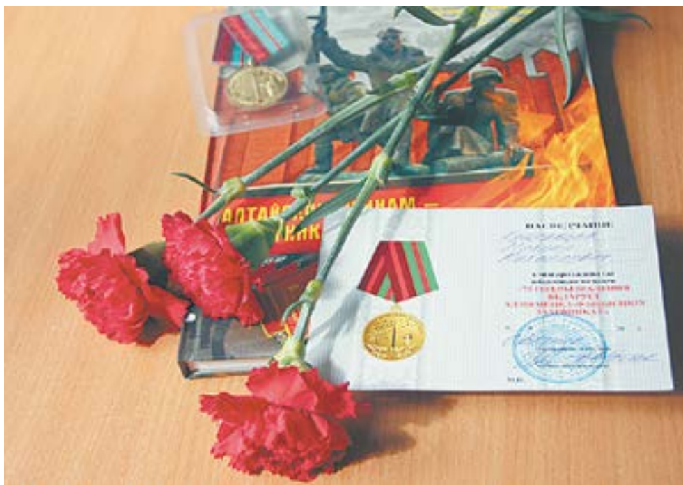
Память и доблесть – священные.

дивизии командиром стрелкового отделения воевал на Смоленщине. Первое ранение – в ногу. Госпиталь, и опять на передовую. Принял станковый пулемет, вступил в партию, и вместе со своим отделением выполнил стратегически важное задание – организовал круговую оборону наших воинов в заданном секторе, обеспечил защиту флангов и тыла. В награду – орден Красной Звезды.