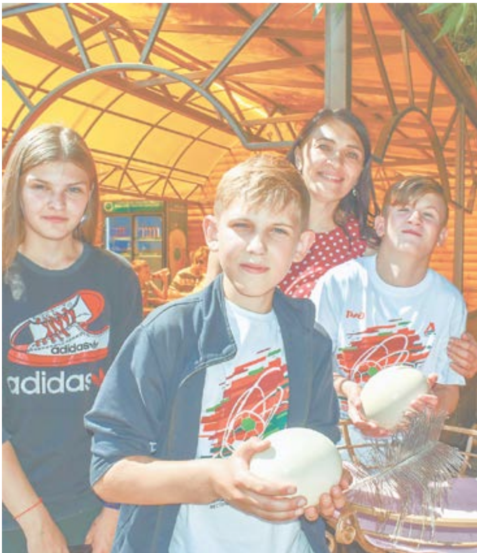
Участники проекта «Большая семья Алтай» на страусиной ферме.

– В марте этого года в перинатальном центре «Дар» родилась девочка с тяжелой формой буллезного эпидермолиза, таких детей из-за тонкой кожи называют «бабочки». У малышки отсутствовала кожа на ножке, были выявлены проблемы и на других участках тела. Родители от ребенка отказались. В экстренном порядке бригада врачей-реаниматологов вылетела с младенцем в Москву для оказания необходимой помощи. Средства на перелет были выде-