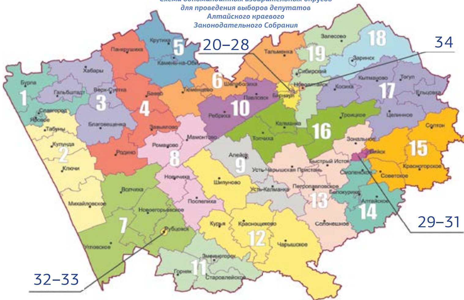
Схема одномандатных избирательных округов для проведения выборов депутатов Алтайского краевого Законодательного Собрания

75 ТЕРРИТОРИАЛЬ- НЫХ ИЗБИРАТЕЛЬНЫХ КОМИССИЙ