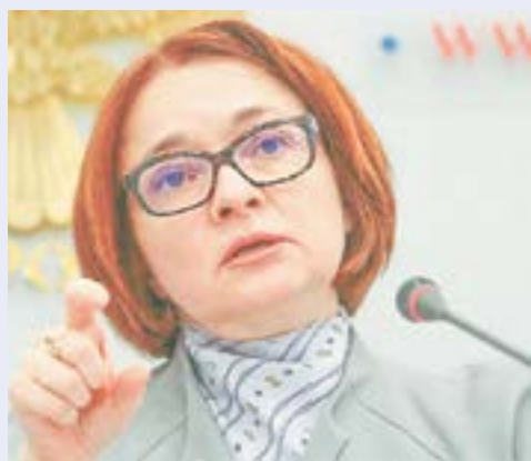
Эльвира Набиуллина надеется победить инфляцию.