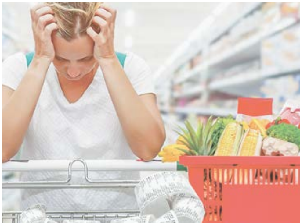
От таких цен люди хватаются за голову.

По мнению Эльвиры Набиуллиной, денежно-кредитные условия постепенно подстраиваются под произошедшие повышения ключевой ставки. Процентные ставки по кредитам и депозитам отреагировали не так быстро и выросли не столь заметно по сравнению с облигациями фе-