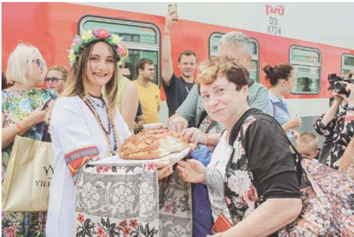
Гостей встретили с сибирским гостеприимством.