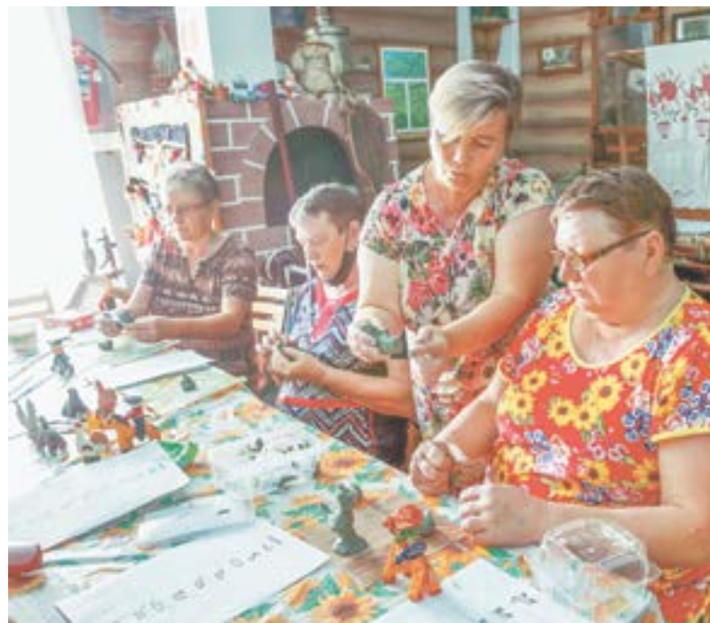
Учимся делать троицкую игрушку.