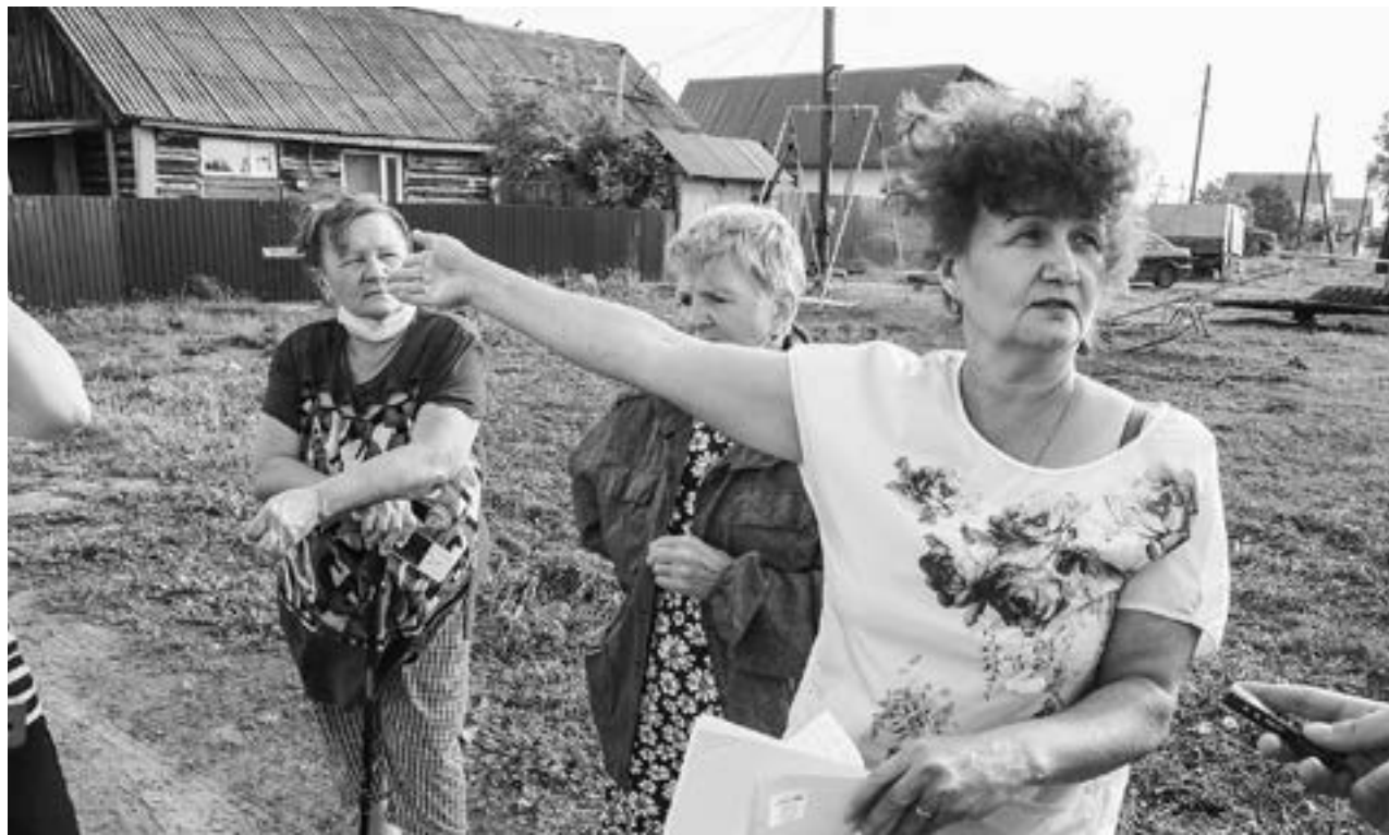
Жители Боровихи вынуждены дышать зловонием.

Жители села Боровиха, не дождавшись помощи от правоохранительных и надзорных органов, продолжат борьбу за право дышать чистым воздухом. Сельчане написали открытые письма в адрес мясоперерабатывающих предприятий, которые поставляют отходы на завод по производству мясокостной муки «Алтайкорм». Инициативная группа надеется, что без сырья завод приостановит свою деятельность и перестанет их отправлять.