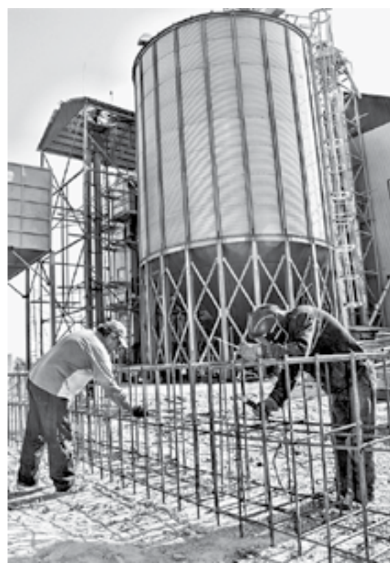
Завершается строительство семенного завода.

Хозяйство также специализируется на размножении пшеницы, которая занимает 2 тыс. га. Компании-оригинаторы поставляют «Гею» суперэлиту сортов. Из них целинники выращивают элиту, оставляют себе на развод, а хозяйствам продают семена первой репродукции.