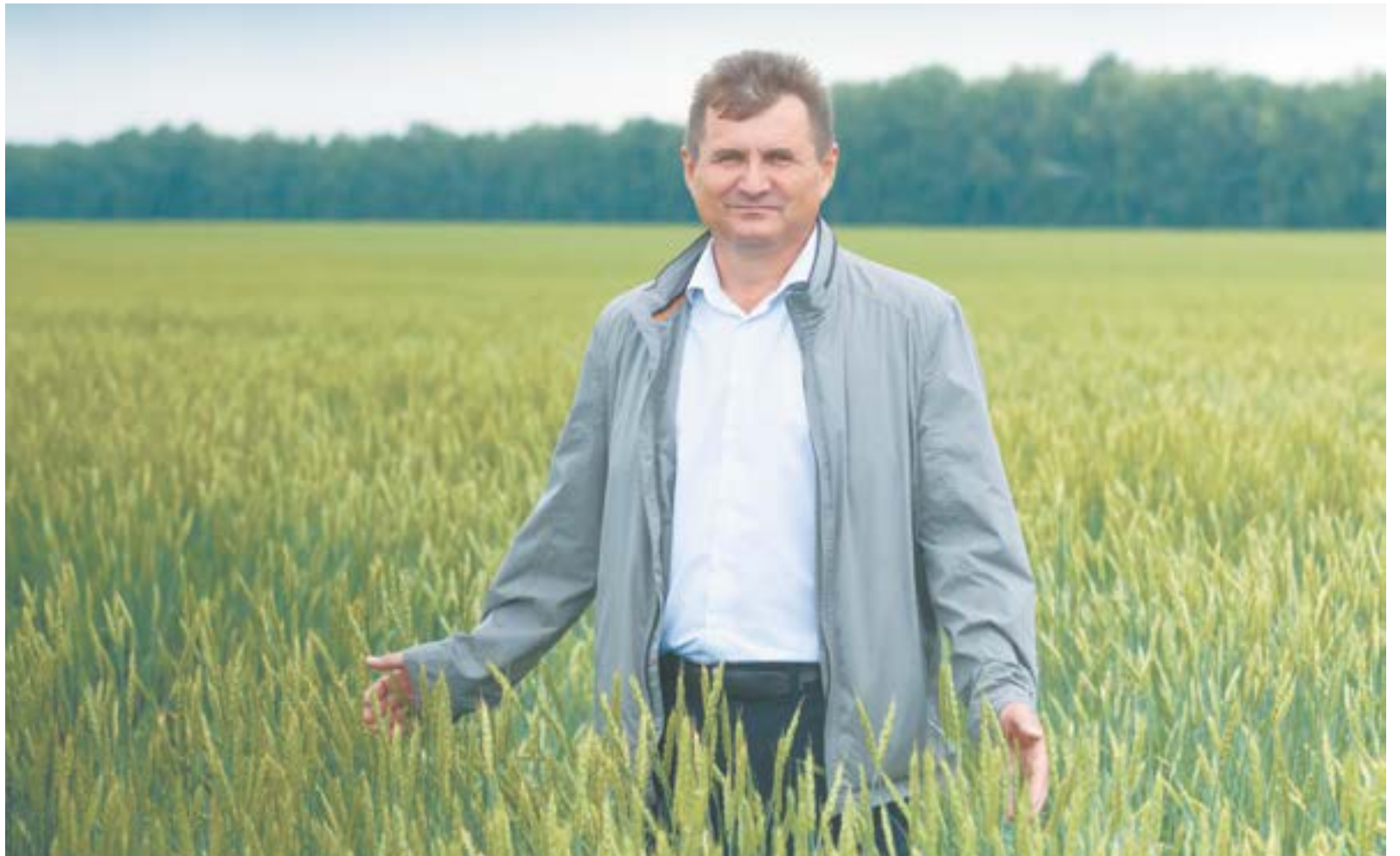
В Павловском районе выращивают элитные сорта пшеницы.

– В последнее время у местных сельхозпроизводителей в чести немецкие низкорослые сорта пшеницы, славящиеся высокой урожайностью. Предприятию приходится учитывать потребности современного рынка. Сейчас мы посеяли на одном из участков новый неартифицированный сорт Юнион, он похож по показателям на немецкий низкорослый сорт пшеницы. Надеемся, что через