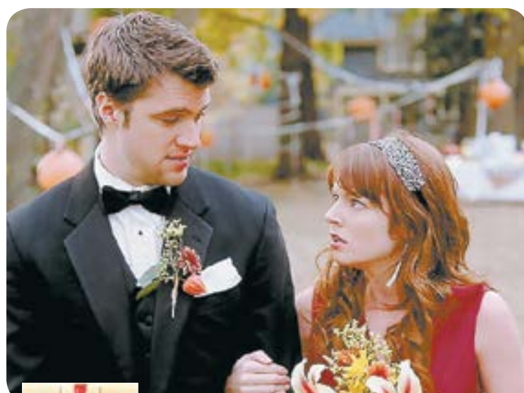
00.00 Х.ф. «Помолвка понарошку» (16+)