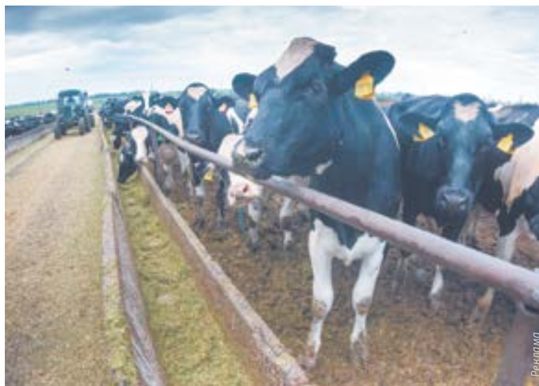
На племязаводе «Комсомольское» разводят черно-пеструю породу коров приобского типа.

некоторое время мы сможем конкурировать с ним на рынке, – говорит руководитель предприятия.