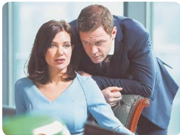
22.00 Х.ф. «Я люблю своего мужа» (16+)

04.45 Т.с. «Лесник» (16+) 07.20 «Кто в доме хозяин?» (12+) 08.00 Сегодня 08.20 «У нас выигрывают!» Лотерейное шоу (12+) 10.00 Сегодня 10.20 «Первая передача» (16+) 11.00 «Поезд будущего» с Сергеем Малозёмовым (12+) 12.00 «Дачный ответ» (0+) 13.00 «НашПотребНадзор» (16+) 14.05 «Однажды...» (16+) 15.00 Своя игра (0+) 16.00 Сегодня