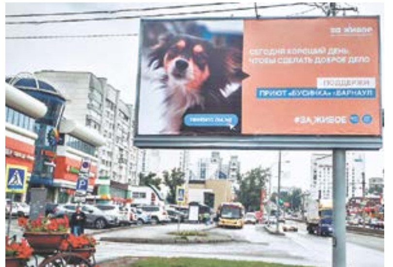
Кэрри попала в добрые руки.