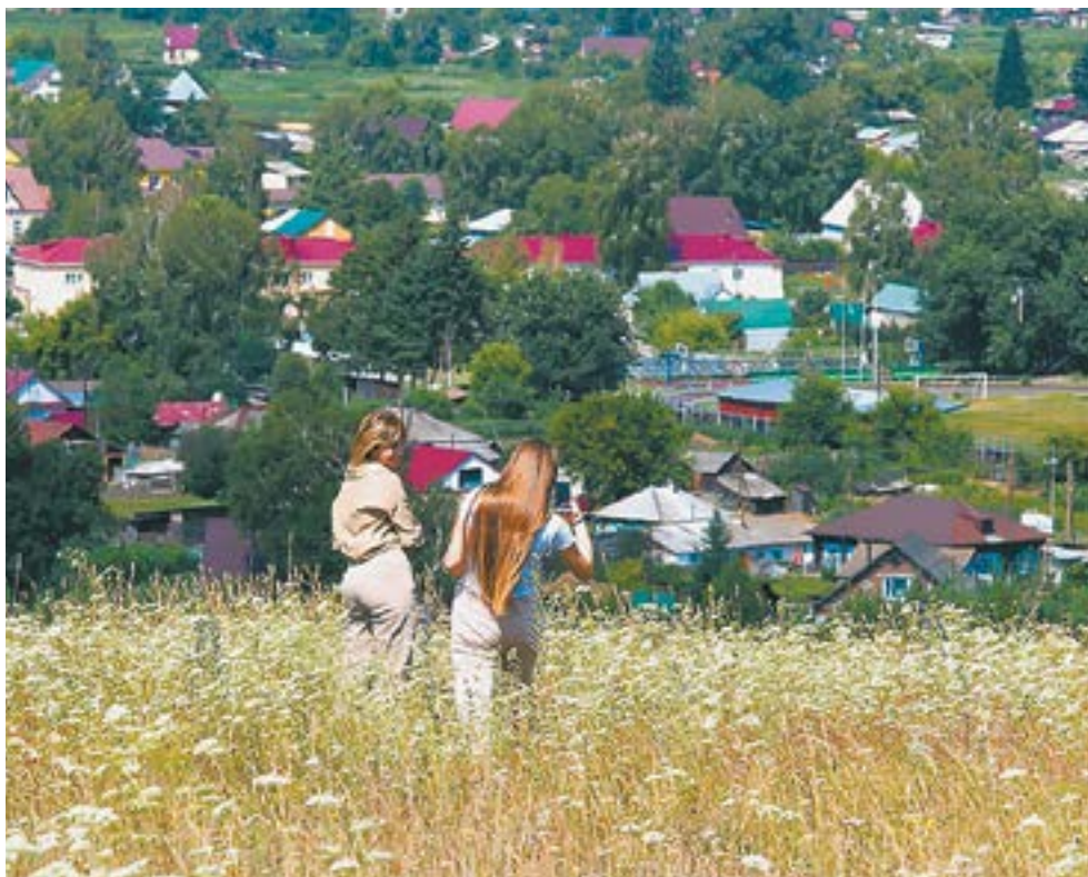
Вид на Сростки с Пикета.