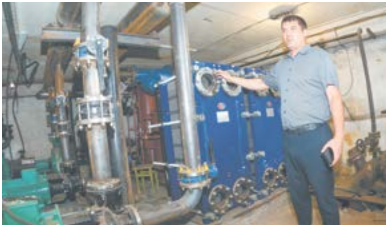
В этом году в Павловске модернизировали газовую котельную.

в Павловске модернизируется газовая котельная, которая отопляет большую часть села. А сначала она работала на угле. В 2001 году ее перевели на газ, в обновленном состоянии она прослужила 20 лет, и оборудование вновь требовало модернизации. В результате котельную включили в краевую программу, выделив на модернизацию оборудования 18 миллионов рублей. Осенью котельная заработает на новых мощностях, без текущих ремонтов и теплопотерь.