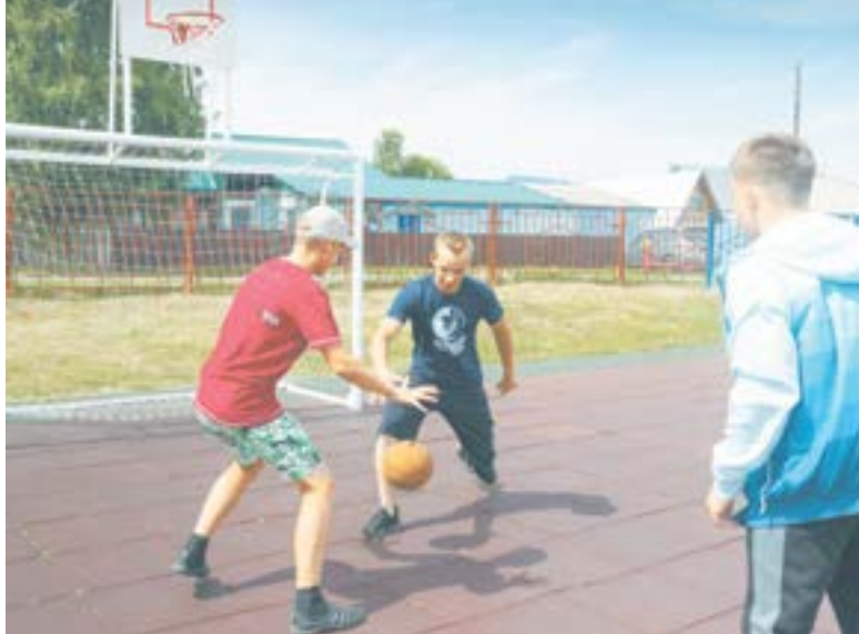
В Прутской средней школе основная ставка – на спорт.

Благодаря участию в краевой программе «Обеспечение населения Алтайского края жилищно-коммунальными услугами»