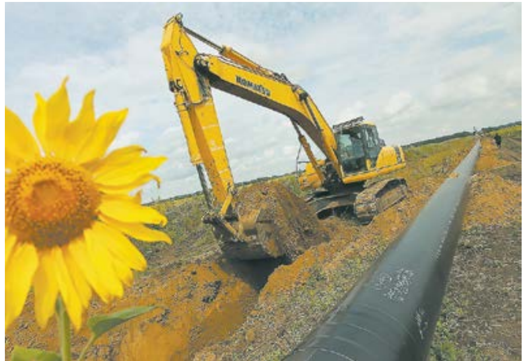
Темпы газификации в крае будут увеличены.

Фракцией «Единая Россия» были подготовлены поправки в закон о газоснабжении. Теперь у людей будет возможность провести трубу и купить весь набор необходимого оборудования по минимальной стоимости.