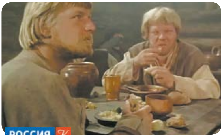
00.40 Х.ф. «Тайна золотой горы»

09.00 ПроСТО кухня (12+) 09.30 Премьера. ПроСТО кухня (12+) 10.00 Уральские пельмени (16+) 10.10 М.ф. «Тролли» (6+) 12.00 Х.ф. «Бунт ушастых» (6+) 14.00 М.ф. «Кот в сапогах» (0+) 15.40 М.ф. «Кунг-фу панда» (6+) 17.25 М.ф. «Кунг-фу панда - 2» (0+) 19.10 М.ф. «Кунг-фу панда - 3» (6+) 21.00 Х.ф. «Золушка» (6+) 23.05 Х.ф. «Звездная пыль» (16+) 01.35 Х.ф. «Дневник памяти» (16+) 03.35 «6 кадров» (16+) 05.00 М.ф. «Мультфильмы» (0+) 05.50 Ералаш (0+)