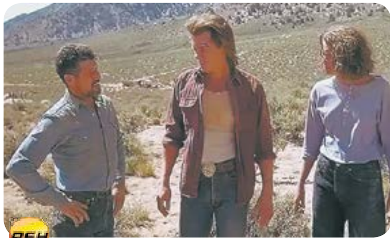
20.30 Х.ф. «Дрожь земли» (16+)

ИМЕЮТСЯ ПРОТИВОПОКАЗАНИЯ НЕОБХОДИМА КОНСУЛЬТАЦИЯ СПЕЦИАЛИСТА