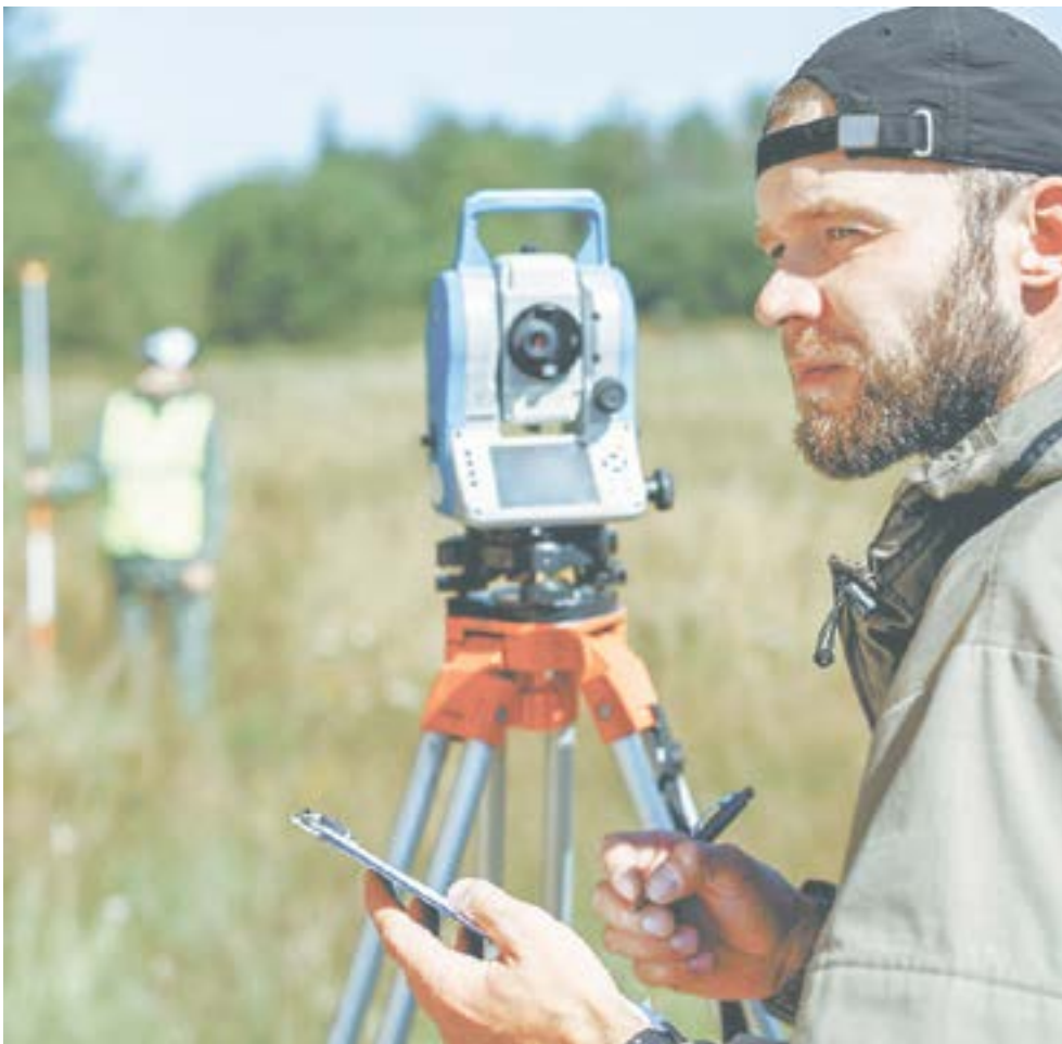
Оборот земли регулирует во многом устаревший закон.