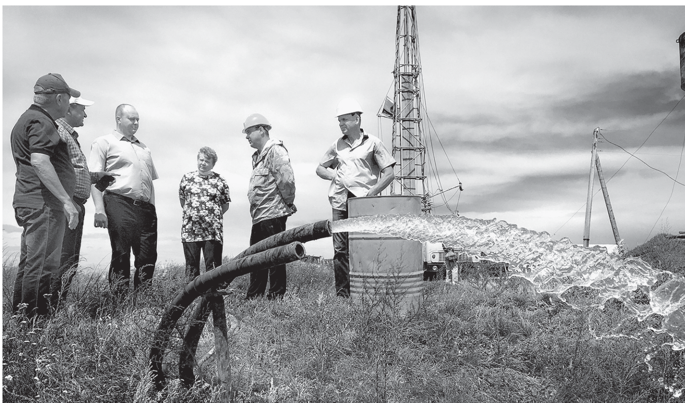
Несколько дней ушло на техническую прокладку.

Много лет из кранов жителей села Воробьево Шипуновского района бежало жидкость, по цвету больше напоминавшая квас, а не воду. Сейчас в селе завершается строительство новой водозаборной скважины. Объект еще не введен в эксплуатацию, но сельчане уже успели оценить качество новой воды.