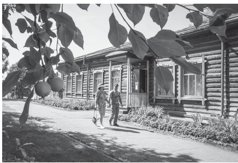
Количество посетителей с нарядным годом растет.

Прежде всего выставка посвящена теме сохранения культуры. Мы рассказываем о писателях,