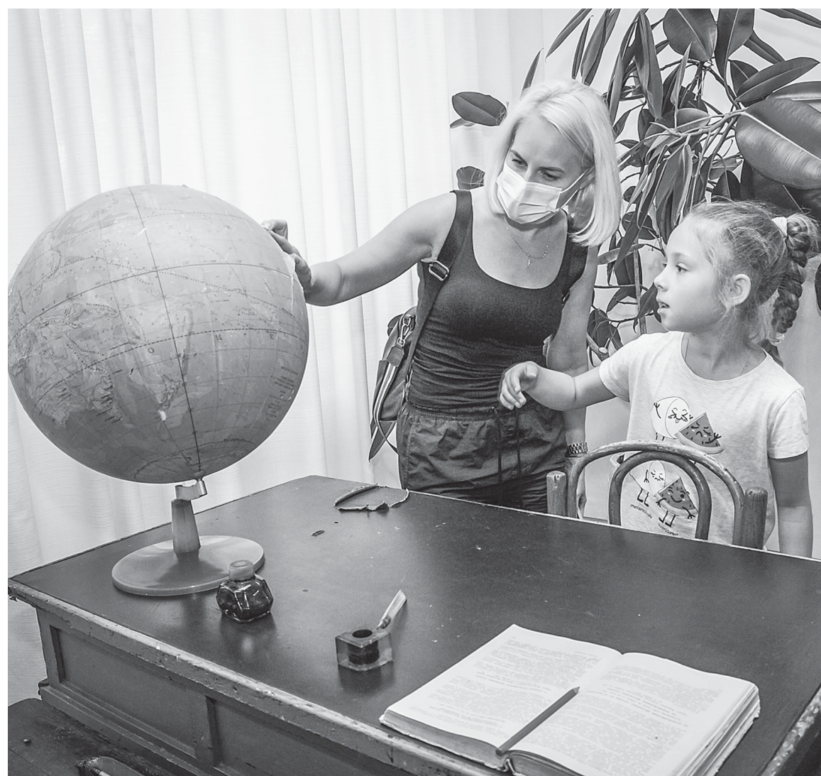
Гости могут познакомиться с местом, где учился В.М.Шукшин.

Всего планируется показать около пятидесяти предметов, часть из которых выставляется впервые.