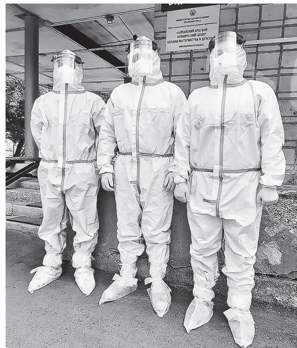
Молодые специалисты в ковидном госпитале.