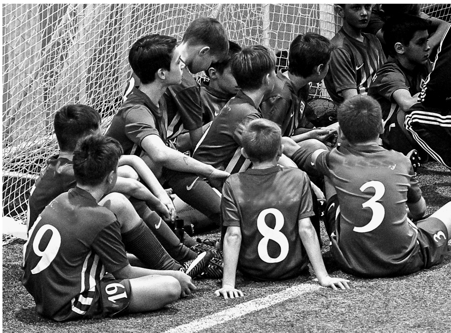
В рамках проекта для подростков проводят спортивные состязания.

В Алтайском крае определили победителей конкурсного отбора организаций на участие в проекте по социализации трудных подростков.