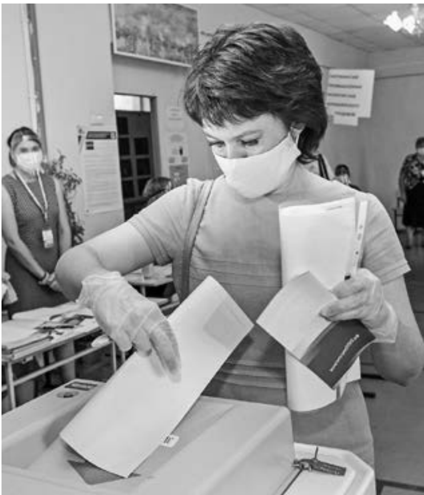
Голосование пройдет при соблюдении всех санитарных правил.

Кроме выборов в АКЗС и Государственную Думу, в единый день голосования состоится 101 избирательная кампания в органы мест-