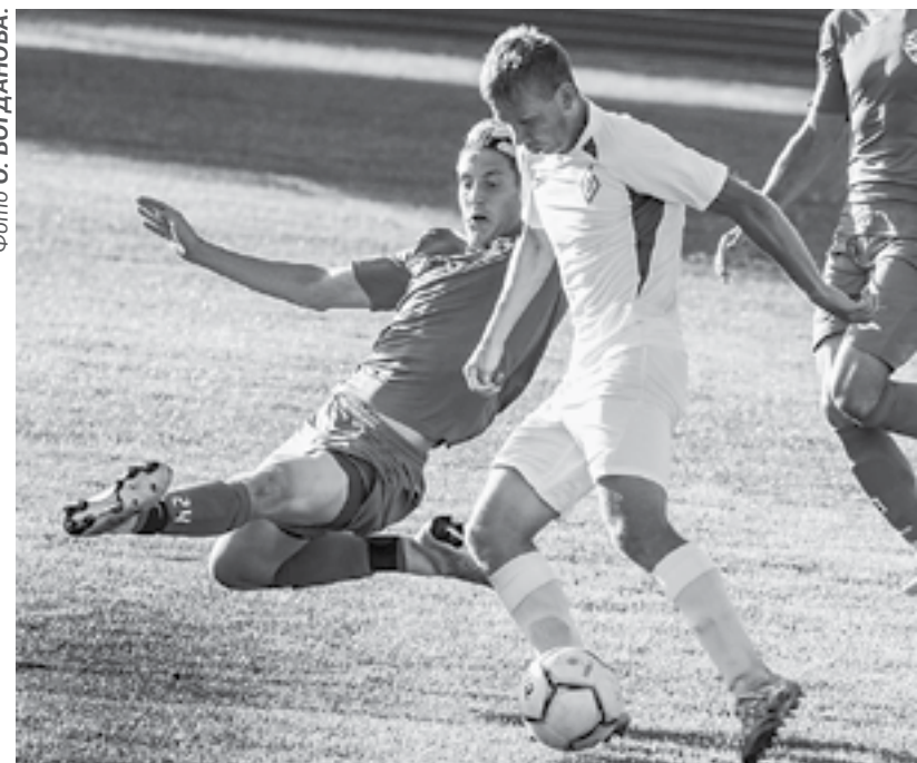
Борьба на поле.

Как оказалось, эти два гола в исполнении динамовских игроков стали единственными в основное