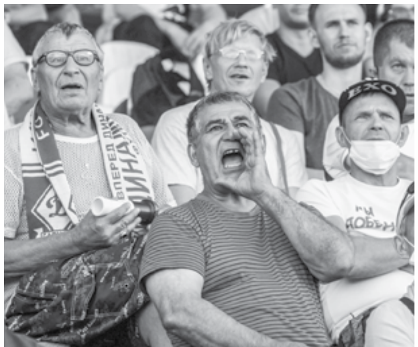
Болельщики горячо поддерживали игроков.