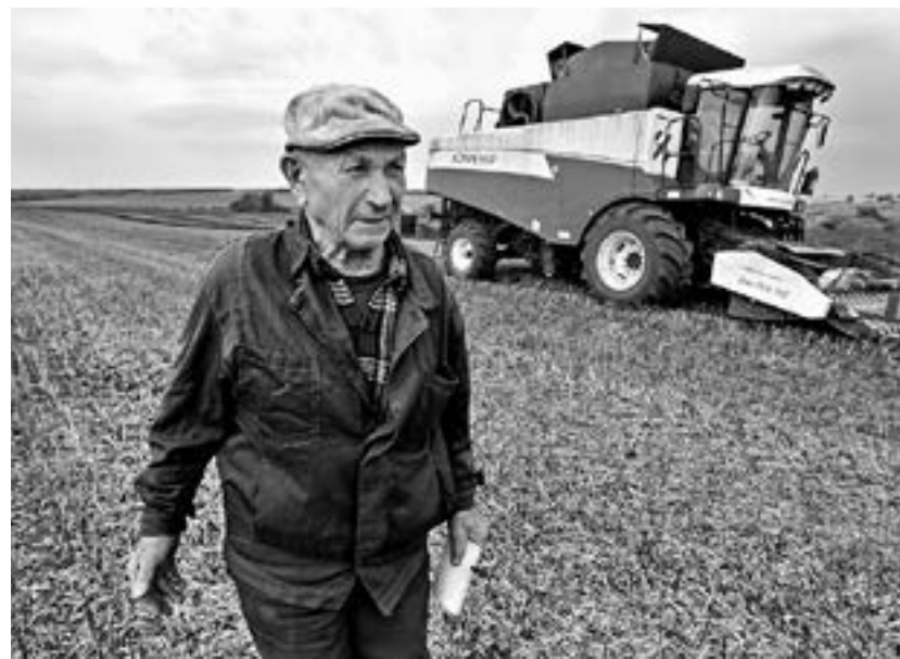
С 2022 года изменится порядок назначения повышенных пенсий сельчанам.

Важно для нас и то, что в федеральном законе (а вслед за ним – и в краевом) закрепили 25-километровую охранную зону вокруг хозяйств, занимающихся племенным раз-