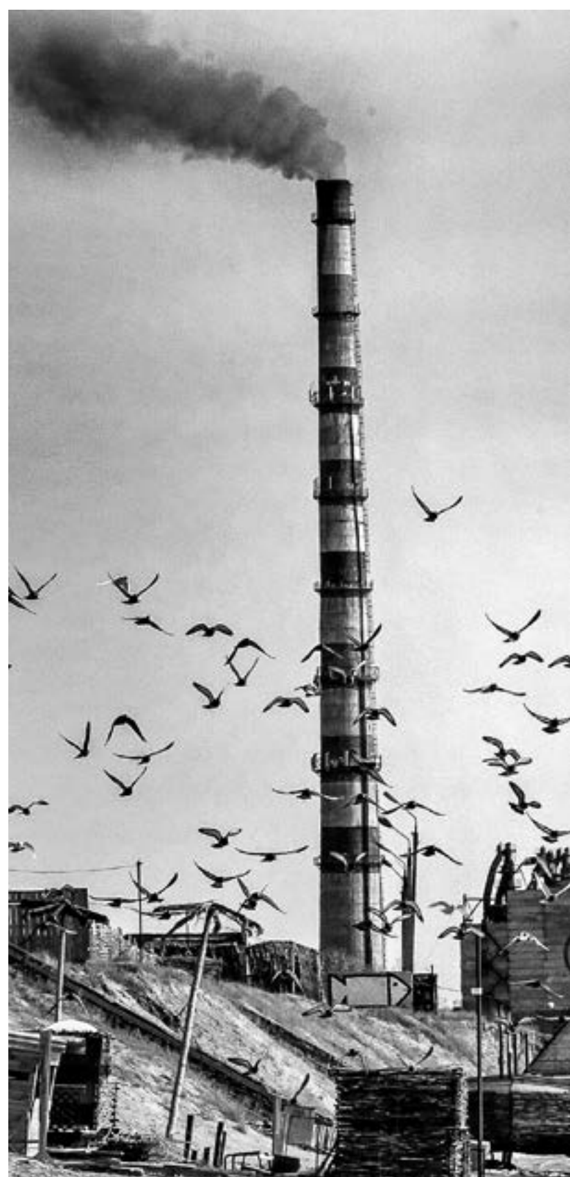
Выбросы парниковых газов наносят колоссальный вред окружающей среде.

В апреле в рамках международной конференции на базе Алтайского