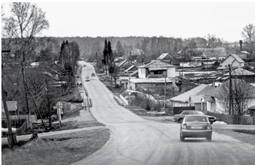
Уникальный проект по компенсации углеродного следа уже реализуется в Залесовском районе.

На заседании прозвучала идея сделать Алтайский край пилотным для отработки на его базе всех механизмов по компенсации углеродного следа. Речь идет не только о сокращении выбросов, но и об улавливании и полезном использовании парниковых газов. Такой лесной проект по компенсации углеродного