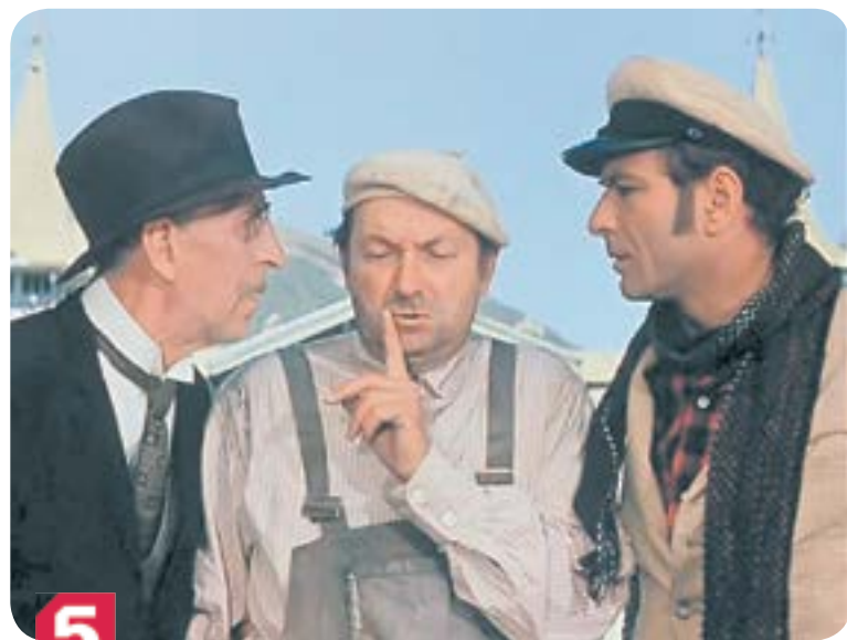
00.55 Х.ф. «ДВЕНАДЦАТЬ СТУЛЬЕВ» (6+)