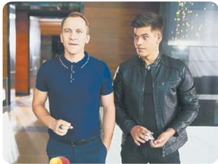
15.05 Х.ф. «НЕ ХОЧУ ТЕБЯ ТЕРЯТЬ» (16+)

04.45 Т.с. «Лесник» (16+) 07.20 Кто в доме хозяин? (12+) 08.00 Сегодня 08.20 У нас выигрывают! (12+) 10.00 Сегодня 10.20 Первая передача (16+) 11.00 Чудо техники (12+) 11.55 Дачный ответ (0+) 13.00 НашПотребНадзор (16+) 14.05 Однажды... (16+) 15.00 Своя игра (0+) 16.00 Сегодня 16.20 Следствие вели... (16+) 18.00 Т.с. «Стажеры» (16+) 19.00 Сегодня 19.35 Т.с. «Стажеры» (16+) 22.30 Маска (12+)