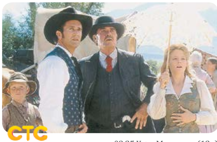
03.25 X.f. «МЭВЕРИК» (12+)