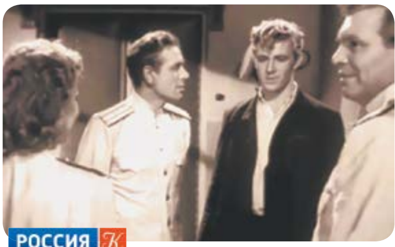
00.35 Х.ф. «Исправленному верить»

РОССИЯ 1 05.00 «Утро России. Суббота» * 08.00 Местное время. Вести – Алтай * 08.20 Местное время. Суббота 08.35 «По секрету всему свету» 09.00 «Формула еды» (12+) 09.25 «Пятеро на одного» 10.10 Сто к одному 11.00 Вести 11.30 «Смотреть до конца» (12+) 12.35 «Доктор Мясников» (12+) 13.40 Т.с. «Принцесса и нищенка» (16+) 18.00 «Привет, Андрей!» (12+) 20.00 Вести 21.00 Х.ф. «От любви до ненависти» (12+) 01.10 Х.ф. «Подсадная утка» (12+)