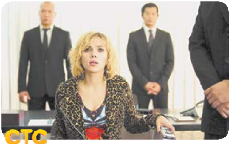
21.00 Х.ф. «Люси» (16+)