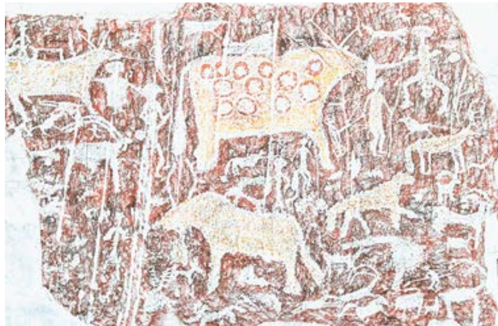
Древние сюжеты разных культур перекликаются.

Выставка эстампов древних петроглифов, обнаруженных впервые на скалах Алтая еще в экспедициях XVIII века, открыта в Бийском краеведческом музее. Это не премьера, конечно. Возможность полюбоваться искусством древних и попытаться постичь сакральный смысл оставленной ими информации периодически появляется у бийчан и гостей города. И все же сегодня мы удивим читателей «АП».