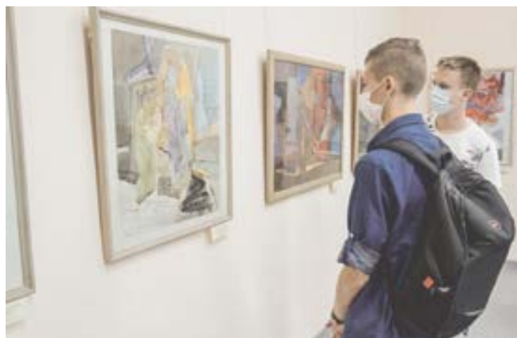
«Эскизы утраченных фресок» в зале музея.