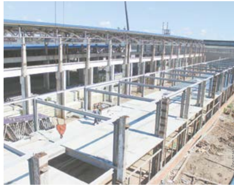
Площадь будущего технопарка превысит 13 тыс. кв. м.

– Один обрабатывающий центр с ЧПУ стоит 130 млн руб. Если сегодня на нем работает