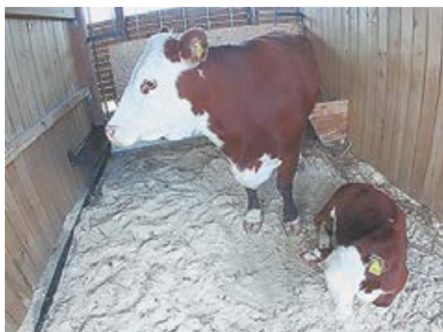
Корова и теленок – герефорды, выращенные в КФХ «Наука».

В крае 46 предприятий и организаций, занятых племенным животноводством. При этом есть хозяйства, получившие несколько лицензий на разведение племенного скота, например ООО «Фарм» имеет статус племенного завода по герефордской, казахской белоголовой породам и племенного репродуктора по абердин-ангусской породе.