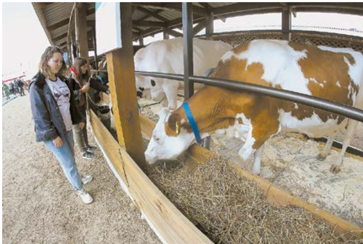
На выставке были представлены элитные животные.

А открывали экспозицию коровы молочного направления. Посетители могли полюбоваться на симменталов, занимающих больше трети в структуре поголовья края, на черно-пестрых голштинов, красно-пестрых и красных степных буренок. Их привезли