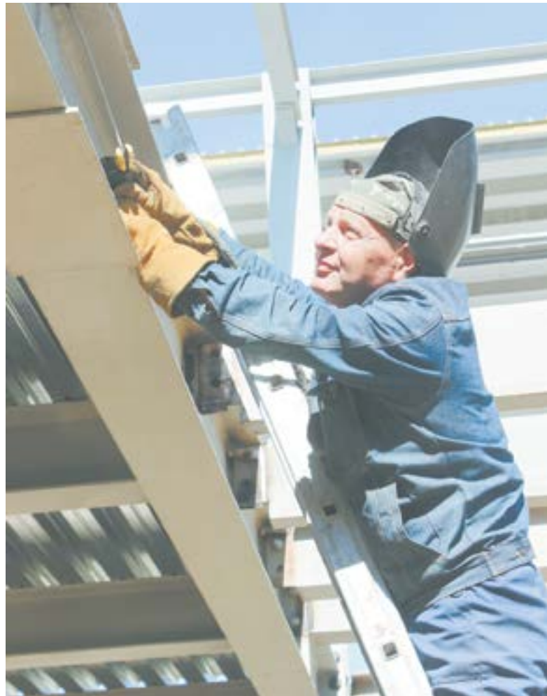
Идет монтаж новых ферм.

Все этапы работ выполняются строго по графику, в соответствии с бизнес-планом и соглашением, заключенным с краевым управлением по развитию пред-