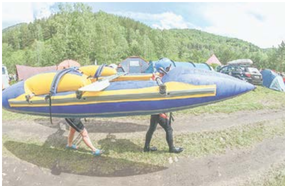
Активный отдых всегда востребован на Алтае.