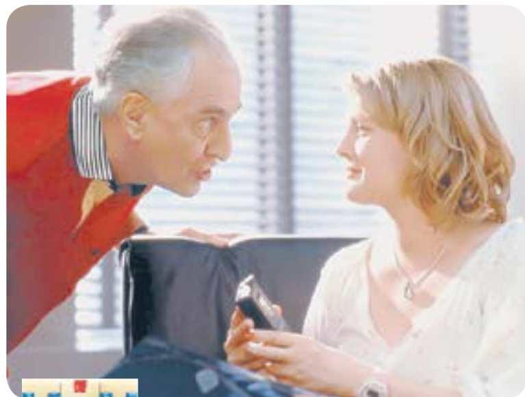
00.00 Х.ф. «НЕЦЕЛОВАННАЯ» (16+)