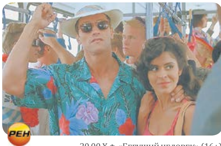
20.00 X.f. «БЕГУЩИЙ ЧЕЛОВЕК» (16+)