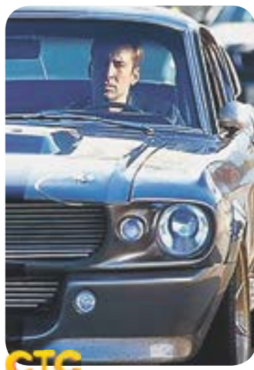
22.00 Х.ф. «Угнать за 60 секунд» (12+)

доктор - 4» (16+) 01.25 Д.с. «Реальная мисти-