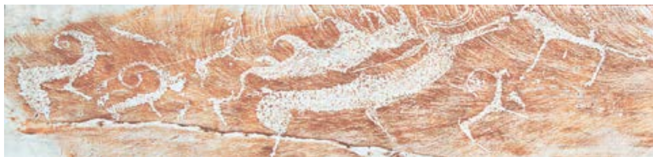
Наскальная алтайская писаница хранит свои тайны.