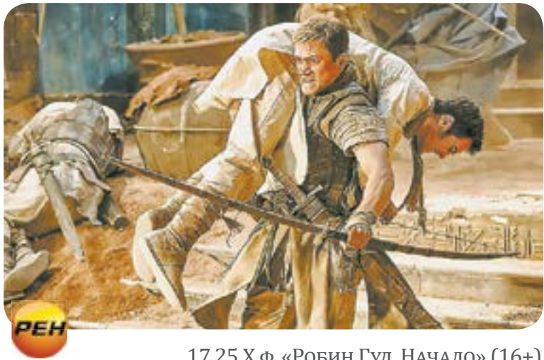
17.25 Х.ф. «Робин Гуд. Начало» (16+)

1 06.00 Телеканал «Доброе утро. Суббота» 10.00 Новости 10.10 «На дачу!» с Натасей Барбье (6+) 11.05 Д.ф. «Спасибо за то, чего нет». К 80-летию Людмилы Чурсиной (12+) 12.00 Игры XXXII Олимпиады 2020 в Токио 14.00 Новости (с субтитрами) 14.15 Игры XXXII Олимпиады 2020 в Токио 16.00 Новости (с субтитрами) 16.15 Игры XXXII Олимпиады 2020 в Токио 20.30 Сегодня вечером (16+) 21.00 Время 21.20 Сегодня вечером (16+) 23.55 Х.ф. «Та, которой не было» (16+) 01.40 Наедине со всеми (16+) 02.20 Модный приговор (6+) 03.10 Дневник игр XXXII Олимпиады 2020 в Токио (0+) 04.10 Давай поженимся! (16+) 04.50 Мужское/Женское (16+)