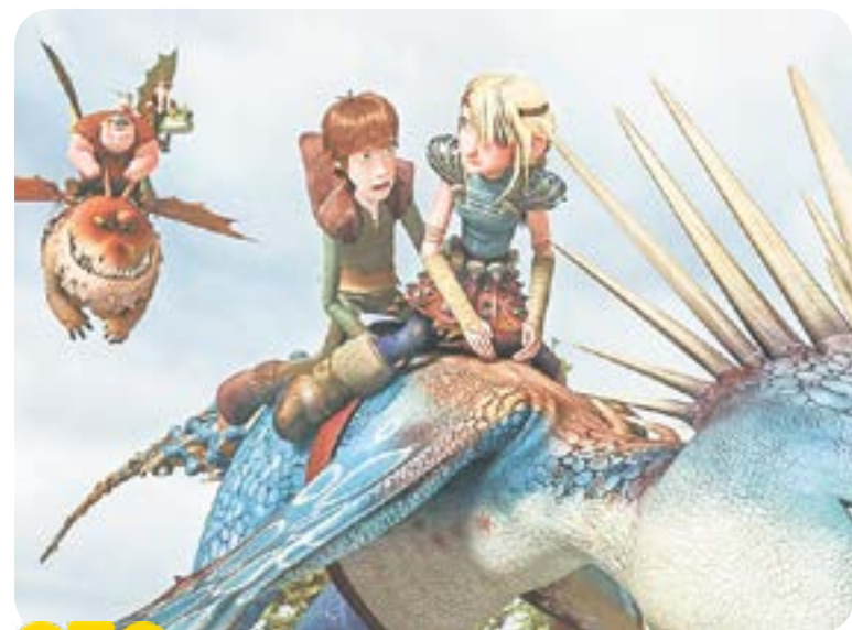
06.50 М.с. «Драконы и всадники Олуха» (6+)

00.00, 03.00 Д.д. «Люди РФ» (субтитры) (12+) 00.30, 01.00, 01.30, 02.00, 02.30, 03.00, 04.00, 04.30, 05.00, 05.30, 12.00, 12.30, 13.00, 13.30, 19.00, 20.00 Новости с субтитрами (12+) 00.50, 01.20, 01.50, 02.20, 02.50, 03.50, 04.20, 04.50, 05.20, 05.50, 10.15, 12.15, 12.45, 17.15, 18.45, 20.15, 20.50, 22.20, 22.50 Интервью дня (12+) 06.00, 06.30, 07.00, 07.30, 09.00, 09.30 Утренний канал (12+) 06.20, 06.50, 07.20, 07.50, 08.10, 08.20, 09.20, 10.30, 17.30, 21.00, 22.00, 22.30 Новости (12+) 08.00, 19.20, 21.20 Персона (12+) 08.05, 08.50 Новости. Коротко (12+) 08.15 Правила жизни. Дети (12+) 08.30 Д.ф. «Анатолий Щетинин. Под солнцем Алтая» (12+) 08.55 Хорошие новости (12+) 10.00, 13.00, 17.00, 20.30 Прямой эфир. Новости (12+) 10.10 Рецепт дня (12+) 10.45 Д.ф. «Малая родина. Топчихинский район» (12+) 10.50 Д.ф. «Малая родина. Троицкий район» (12+) 11.00 Д.ф. «Звезда и смерть графа Вронского. Сербский гамбит» (12+) 13.15 Катунь LIVE Здоровье (12+) 14.45 Открытое правительство (12+) 15.00 Д.ф. «Маленький Миша» (6+) 15.30 Д.д. «Великие изобретатели» (12+) 16.00 Д.д. «Лекарства, которые спасли мир» (12+) 16.30, 21.30 На кухне с «Мария-Ра» (6+) 17.45 Фабрика (12+) 18.00 Здесь был Саша (12+) 18.55 «Постфактум» с Артёмом Кудиновым (12+) 19.30 Огород в подарок (12+) 21.50 Наши (12+) 23.00 Киношоу (12+)