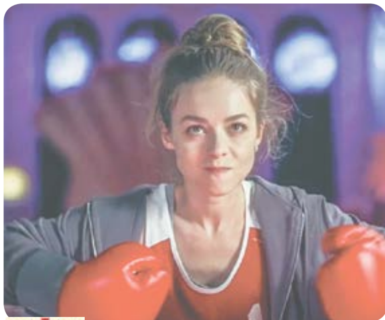
НТ 23.00 Т.с. «НАСТЯ, СОБЕРИСЬ!» (18+)

ЗД 04.50 Т.с. «Лесник» (16+) 06.30 Утро. Самое лучшее (16+) 08.00 Сегодня 08.20 Т.с. «Морские дьяволы» (16+) 10.00 Сегодня 10.20 Т.с. «Морские дьяволы» (16+) 11.20 Т.с. «Красная зона» (12+) 13.00 Сегодня 13.20 Чрезвычайное происшествие