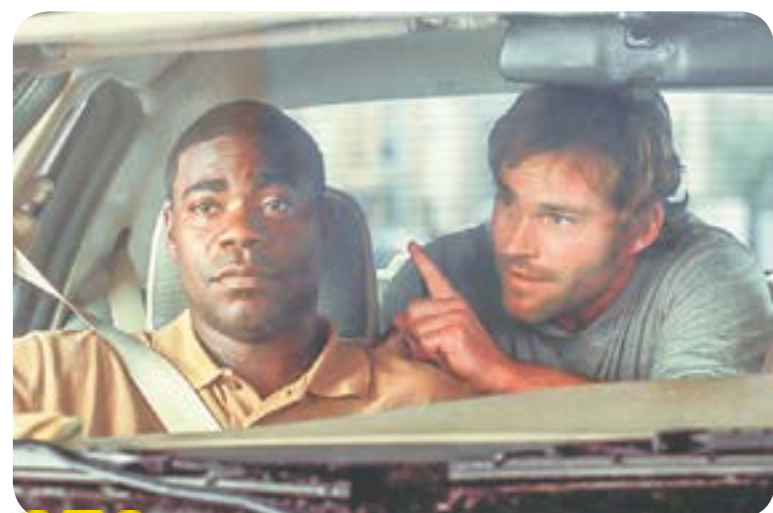
СТС 01.05 Х.ф. «Двойной копец» (16+)

K24 00.30, 03.00 Д.с. «Люди РФ» (субтитры) (12+) 01.00, 01.45, 02.30, 05.00 Новости. Итоги (12+) 01.30, 02.15, 05.30, 10.15, 12.15, 17.15, 18.15, 20.15, 20.50, 21.20, 22.20, 22.50 Интервью дня (12+) 01.40, 03.55 Медицинский совет (12+) 03.30, 05.40 Ран, Тёма, ран (12+) 03.50, 18.05, 21.50 Персона (12+) 04.00 Д.с. «Европахх. Окно в Европу» (16+) 06.00, 06.30, 07.00, 07.30, 09.00, 09.30 Утренний канал (12+) 06.20, 06.50, 07.20, 07.50, 08.10, 08.20, 09.20, 10.30, 17.30, 21.00, 21.30, 22.00, 22.30 Новости (12+) 08.00, 18.00 «Постфактум» с Артёмом Кудиновым (12+) 08.05, 08.50 Новости. Коротко (12+) 08.15 Правила жизни. Дети (12+) 08.30 Д.ф. «Маленький Миша» (6+) 08.55 Хорошие новости (12+) 10.00, 13.00, 17.00, 20.30 Прямой эфир. Новости (12+) 10.10 Рецепт дня (12+) 10.45 Д.ф. «Космос Валерия Октябрю» (12+) 11.00 Т.с. «Разведчицы» (16+) 12.00, 12.30, 18.30, 19.00, 20.00 Новости с субтитрами (12+) 12.45 Фабрика (12+) 13.15 Катунь LIVE (12+) 14.25 Хлебный край (12+) 15.10 Д.ф. «Курская битва. Время побеждать» (12+) 16.00 Д.с. «Достояние республик» (12+) 16.30 Д.п. «Лекарства, которые спасли мир» (12+) 17.45 Открытое правительство (12+) 18.45 Наши (12+) 19.30 На кухне с «Мария Ра» (6+) 23.00 Т.с. «Метод Лавровой» (16+)