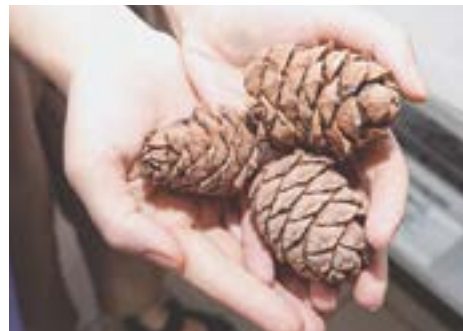
Алтайскую экологически чистую продукцию нужно продвигать на предприятия Минобороны.