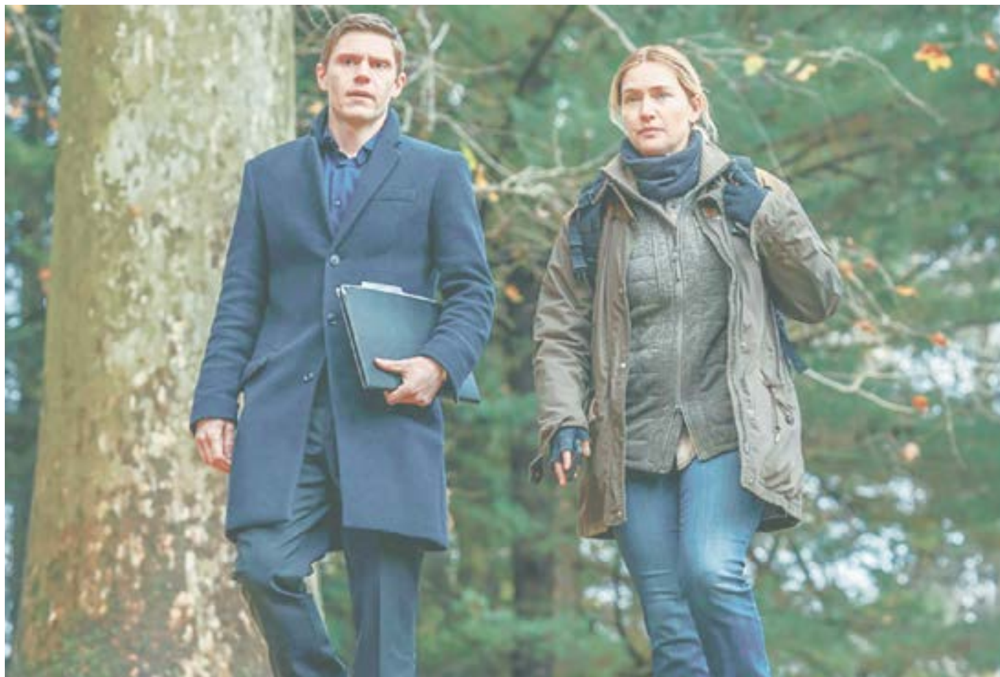
«Мейр из Исттауна»: история сильной женщины из американской глубинки.