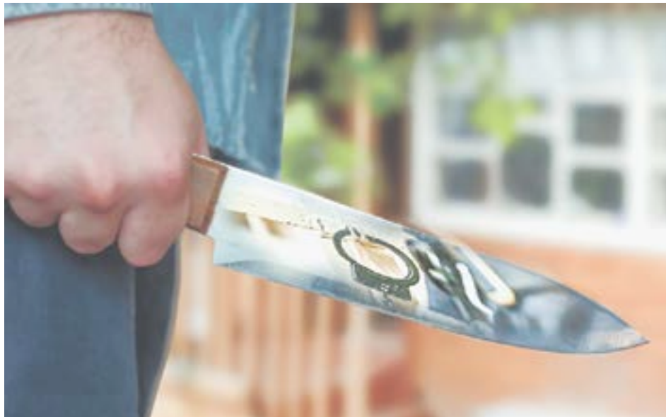
Коллаж О. ТАРАСОВОЙ.

Александр достал из шкафа пакет, где были 130 тысяч рублей, которые они с сестрой копили на ремонт дома, и отдал налетчику.