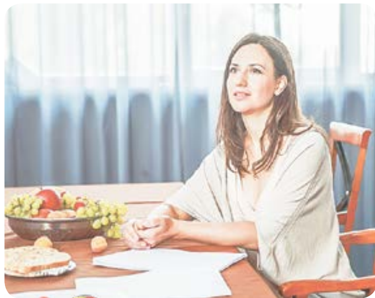
23.05 Х.ф. «ВЫБИРАЯ СЕБЯ» (16+)

04.50 Т.с. «Лесник» (16+) 06.30 Утро. Самое лучшее (16+) 08.00 Сегодня