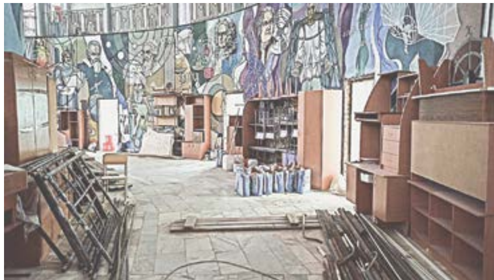
Каждая дверь - это аудитория, росписи на стенах сохраняются.