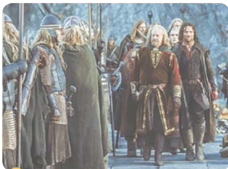
13.30 Х.ф. «Властелин колец. Братство кольца» (12+)

05.00 «Тайны Чапман» (16+) 08.55 Х.ф. «Хеллбой. Герой из пекла» (16+) 11.05 Х.ф. «Хеллбой-2. Золотая армия» (16+) 13.30 Х.ф. «Властелин колец. Братство кольца» (12+) 17.00 Х.ф. «Властелин колец. Две крепости» (12+) 20.35 Х.ф. «Властелин колец. Возвращение короля» (12+) 00.30 Х.ф. «Храброе сердце» (16+) 03.30 «Военная тайна» с Игорем Прокопенко (16+)