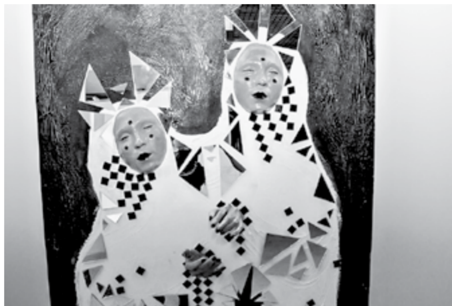
Молодые художники Сибири умеют удивлять.