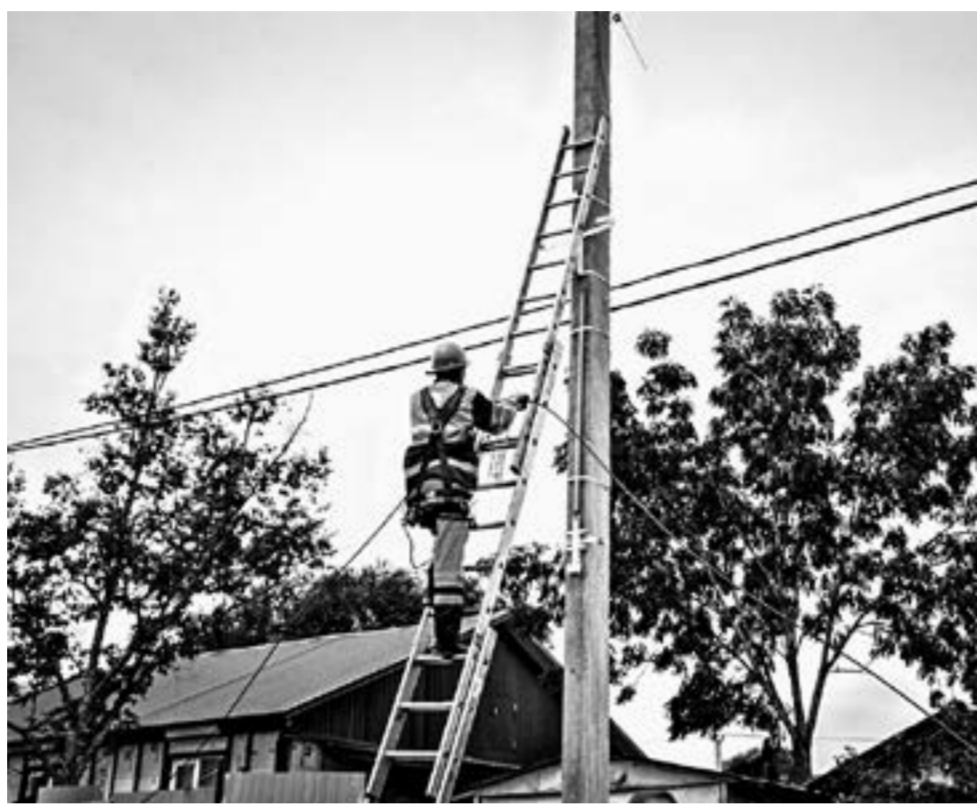
На конец 2020 года в крае было 600 населенных пунктов без устойчивого доступа в Сеть.

Считаю, что потенциал для совершенствования взаимодействия