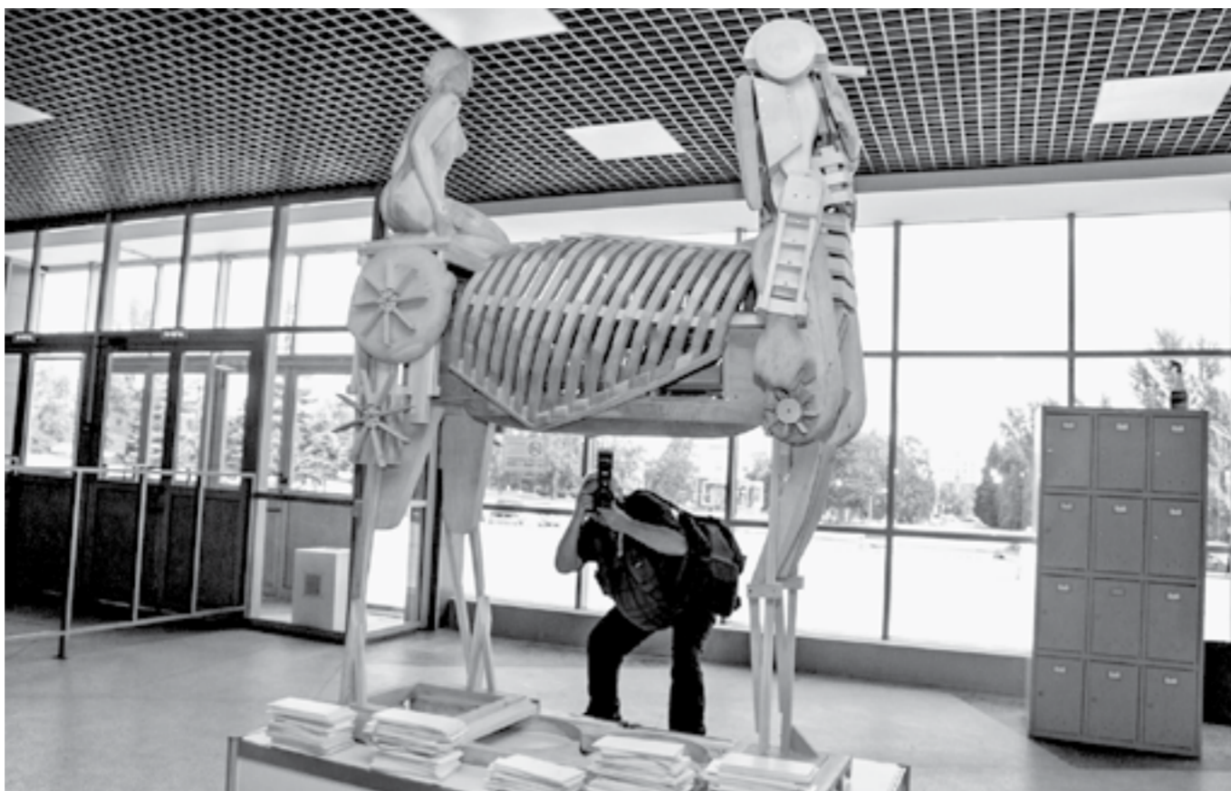
Около 300 авторов и 500 произведений – так выглядит выставка в цифрах.

Петренко не скрывает: это как репетиция «взрослой» региональной выставки «Сибирь-ХИП», которую край планирует провести здесь же в 2023 году. Просто если сейчас работы художников размещены в галерее вокруг чаши арены, то потом придется занять ее целиком и дополнительно заказать два шатра по тысяче метров с экспозиционным оборудованием.