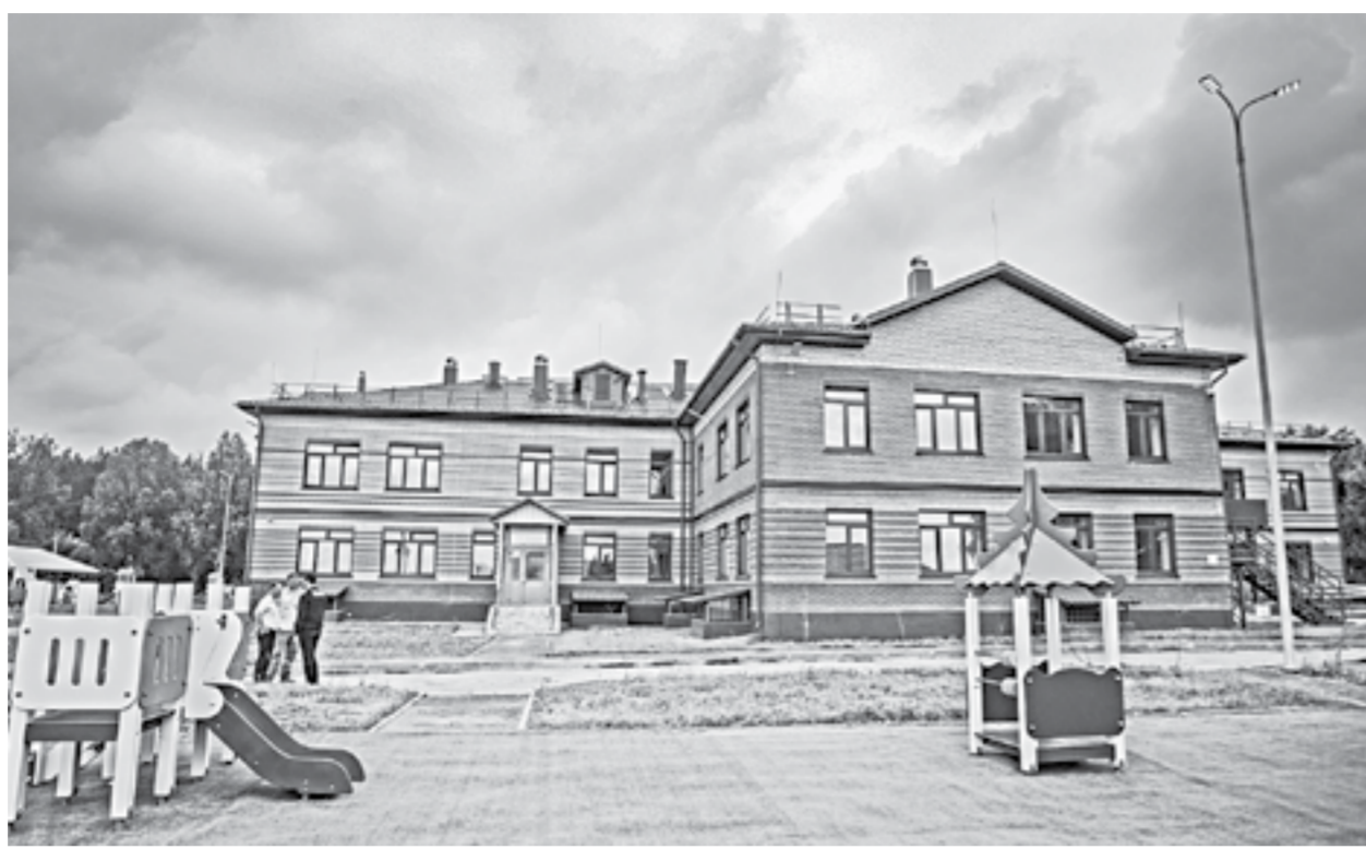
Новый «Светлячок» готовится к открытию.

Тогда дополнительная нагрузка упала на оставшиеся детские сады. В сложившихся условиях ребятишкам приходилось заниматься в комбинированных группах от 2,5 до 5 лет и от 5 до 7 лет. Это, разумеется, не является нормальным, учитывая разную степень развития среди возрастов. Преимущественно в ясли ходили в «Теремок», который пережил капитальный ремонт в 2013 году (на работы ушло 15 миллионов рублей) и был самым достойным среди всех возможных вариантов. Однако в одиночку «Теремок» не справлялся.