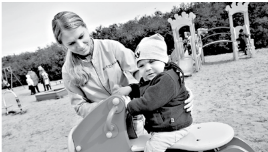
В рамках проекта в селах часто строят детские площадки.

С 2022 года также появится возможность реализации проектов общерегионального значения, которыми будут пользоваться два или более населенных пункта. Заявки будут подавать муниципальные районы. Кроме того, типология проекта поддержки местных инициатив теперь дополнена направлением «Объекты по охране окружающей среды». Основными условиями участия в проекте являются: софинансирование муниципального образования – не менее 10% от общей стоимости проекта, а также денежный вклад населения – не менее 5%. Максимальный размер субси-