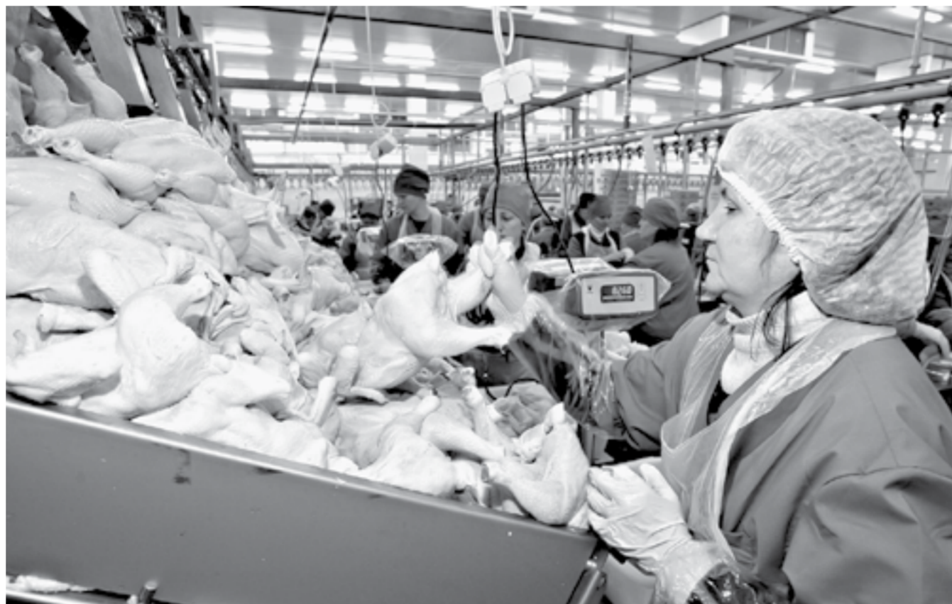
До пожара продукция «Алтайского бройлера» занимала около 90 процентов переработки мяса птицы в регионе.