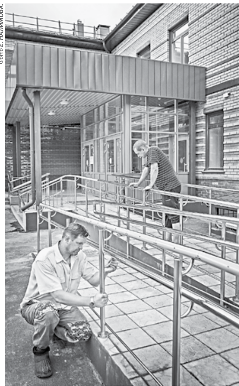
Последние косметические штрихи.

детских и спортивная площадки, котельная, угольный склад и пожарные резервуары. Общая площадь самого здания – 2500 квадратных метров. В стенах нового детского сада уже существуют необходимые условия для раздельного занятия всех возрастных групп детей. Дошкольный возраст и старшая группа будут занимать в классах с партами, сред-