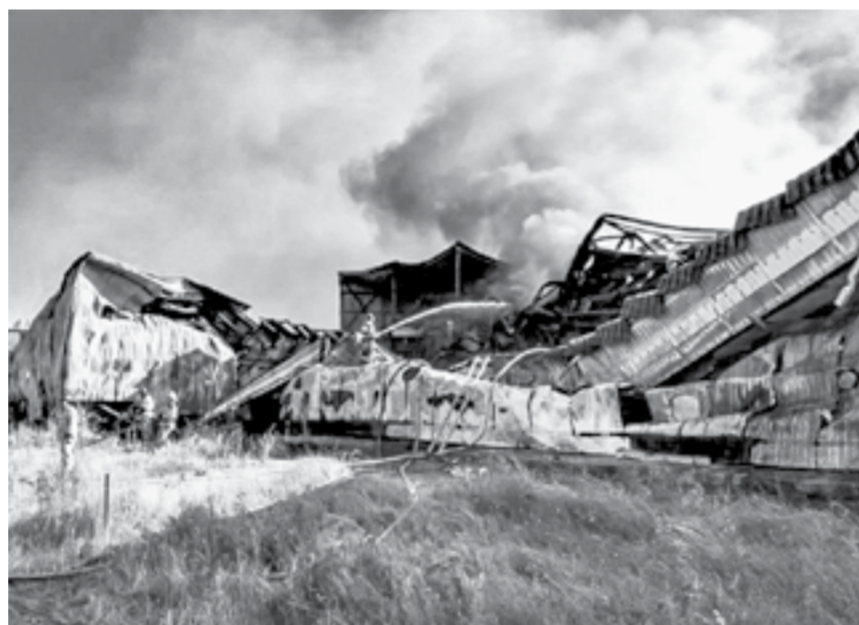
Пожар уничтожил почти 3000 кв. м производственных площадей.