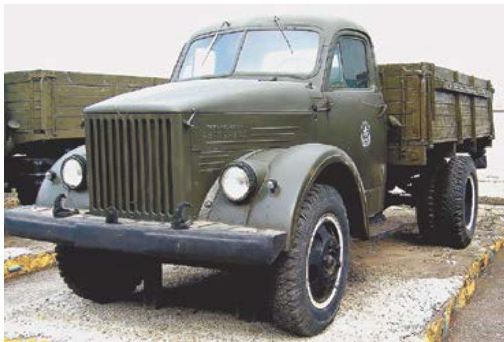
На ГАЗ-51 Анатолий объехал весь край.