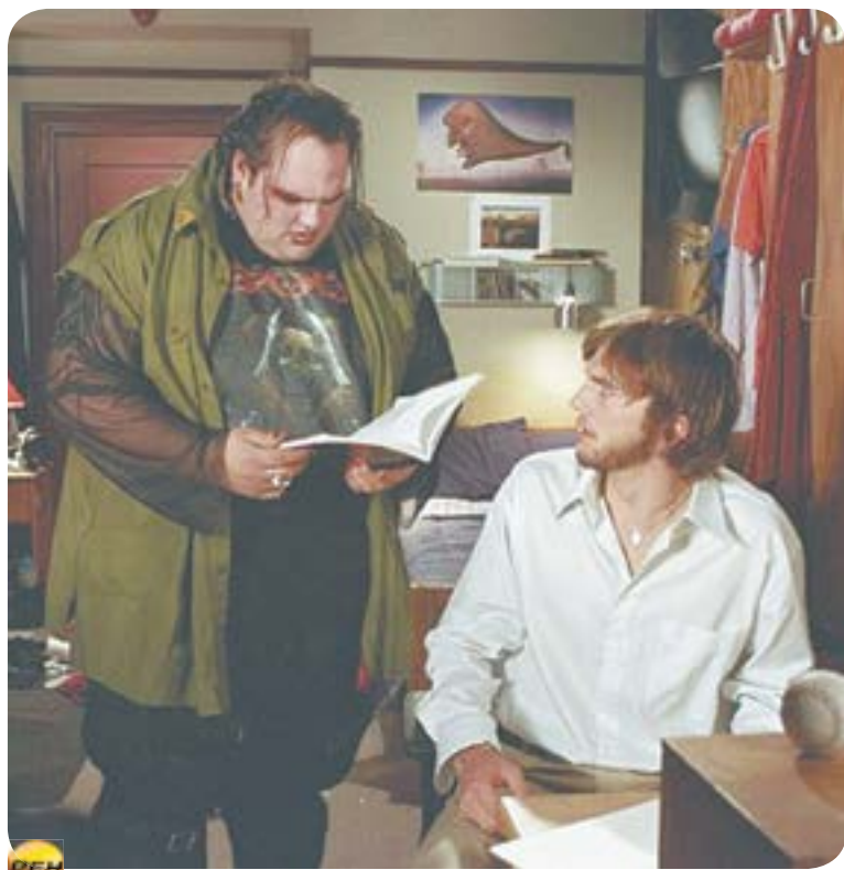
00.30 Х.ф. «ЭФФЕКТ БАБОЧКИ» (16+)

23.20 Т.с. «Мельник» (16+) 02.50 Т.с. «Адвокат» (16+)