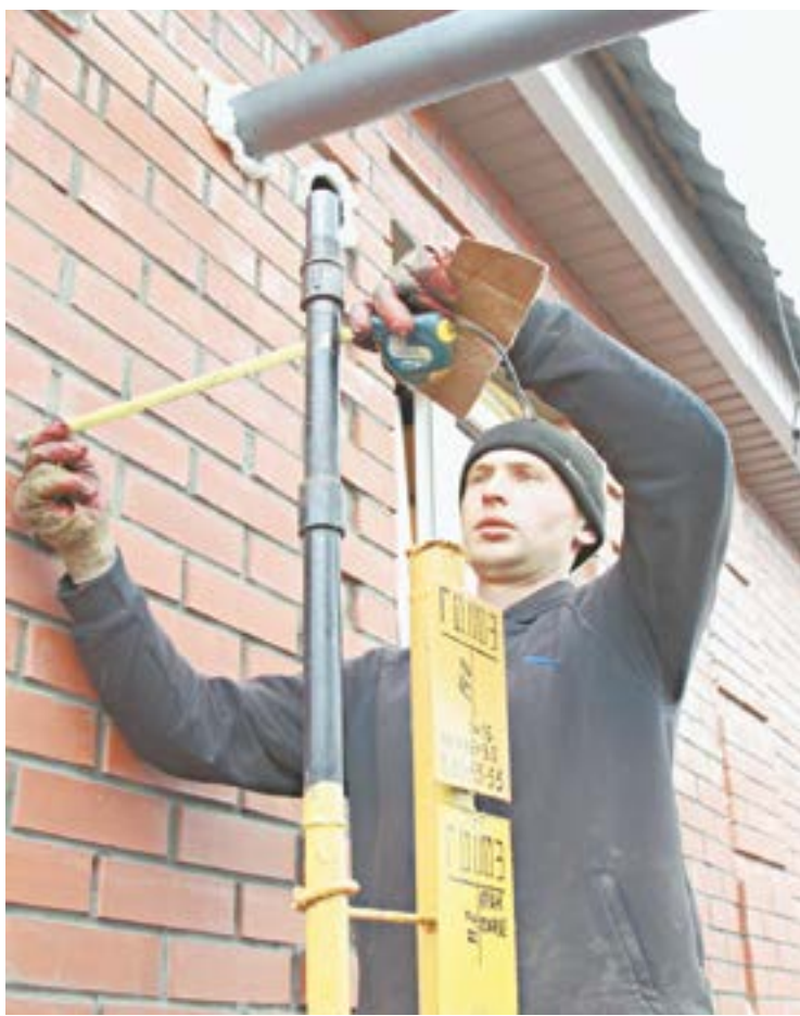
Власти ищут возможности удешевить стоимость газификации.

Владимир Путин считает завышенными цены на внутренний туризм. По его словам, это