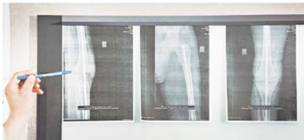
Снимки помогли определить, какая операция требуется пациенту.

«Любая новая методика всегда представляет интерес, особенно если она касается каких-то областей, где не много выходов из определенных ситуаций. На форуме было много вопросов от коллег. Уверен, что новая технология, предложенная нами, будет внедряться по всей России».